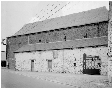
Vue de l'élévation latérale de la grange. IVR31_20055900596V