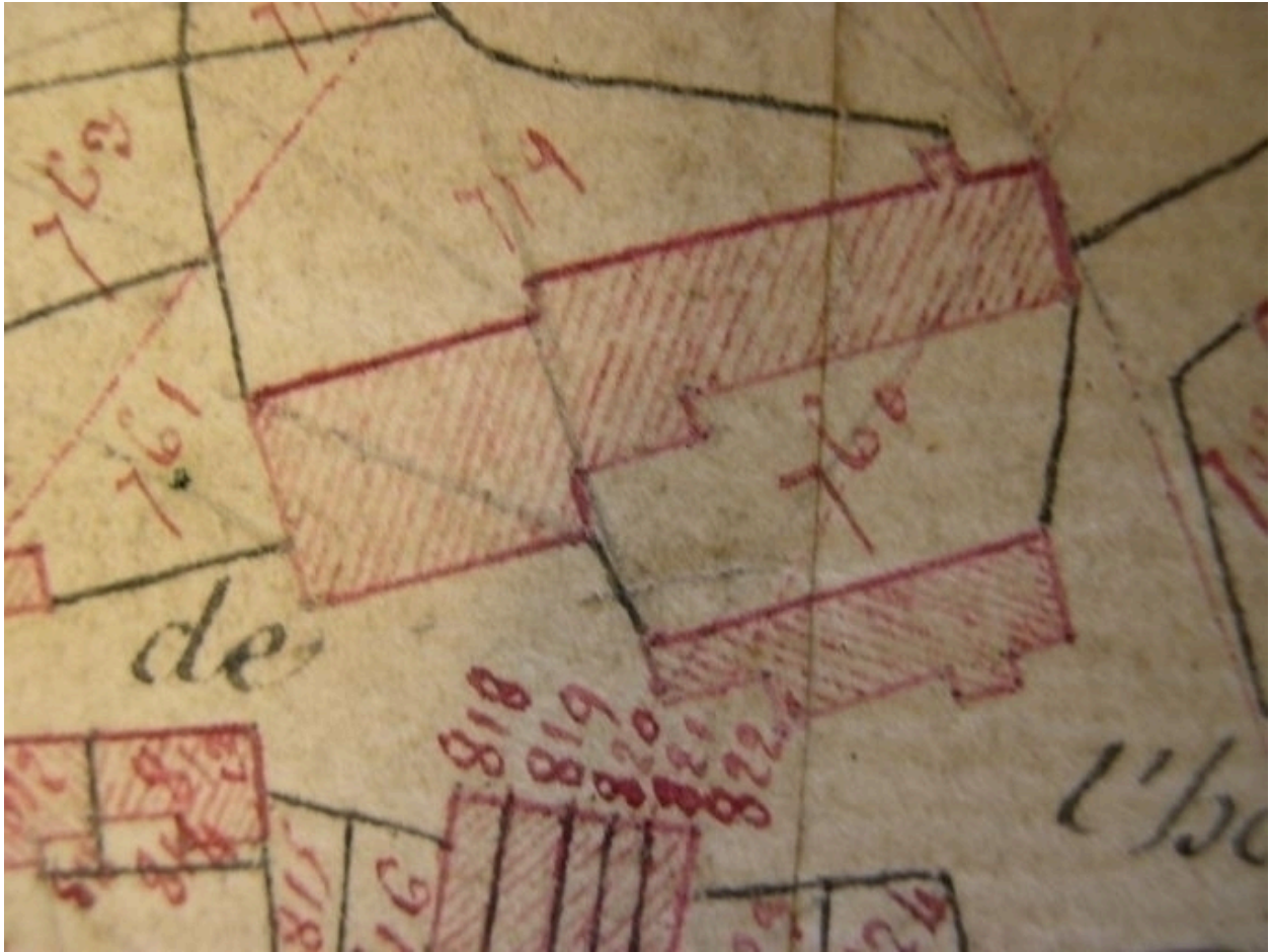
Extrait de la feuille cadastrale C2. Plan de situation en 1810.