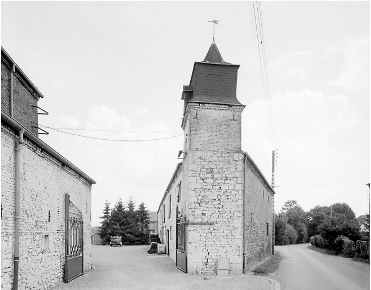
Entrée de la ferme avec la tour.