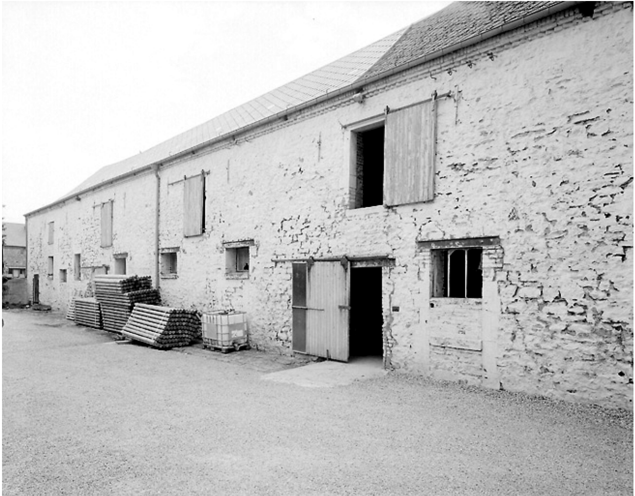
Vue des étables-fenil depuis la cour.