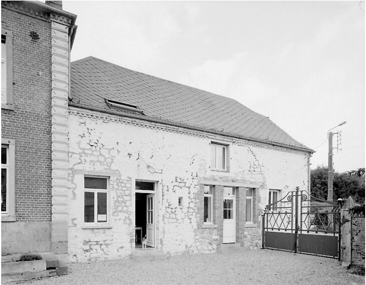
Vue du bâtiment abritant actuellement des bureaux.