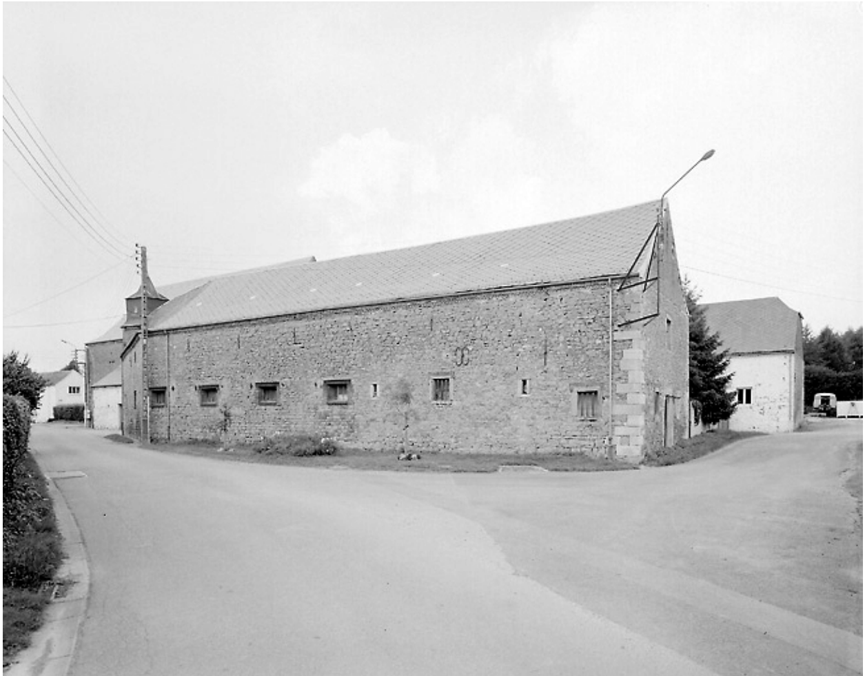
Vue des étables-fenil depuis la rue de l'Hôpital.