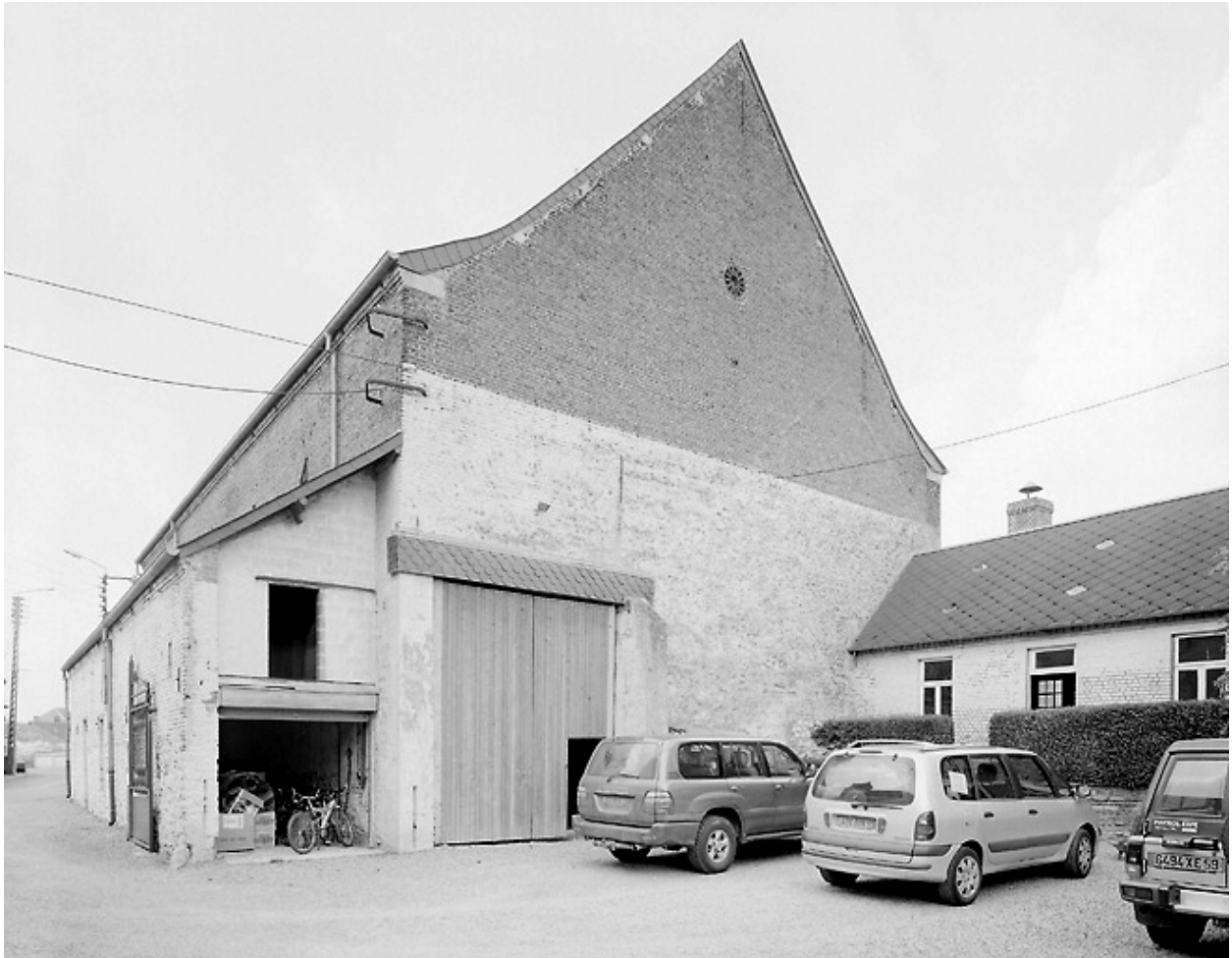
Vue de l'entrée de la grange.