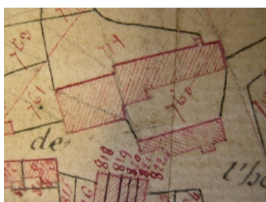
Extrait de la feuille cadastrale C2. Plan de situation en 1810.

IVR31_20045905237NUCA