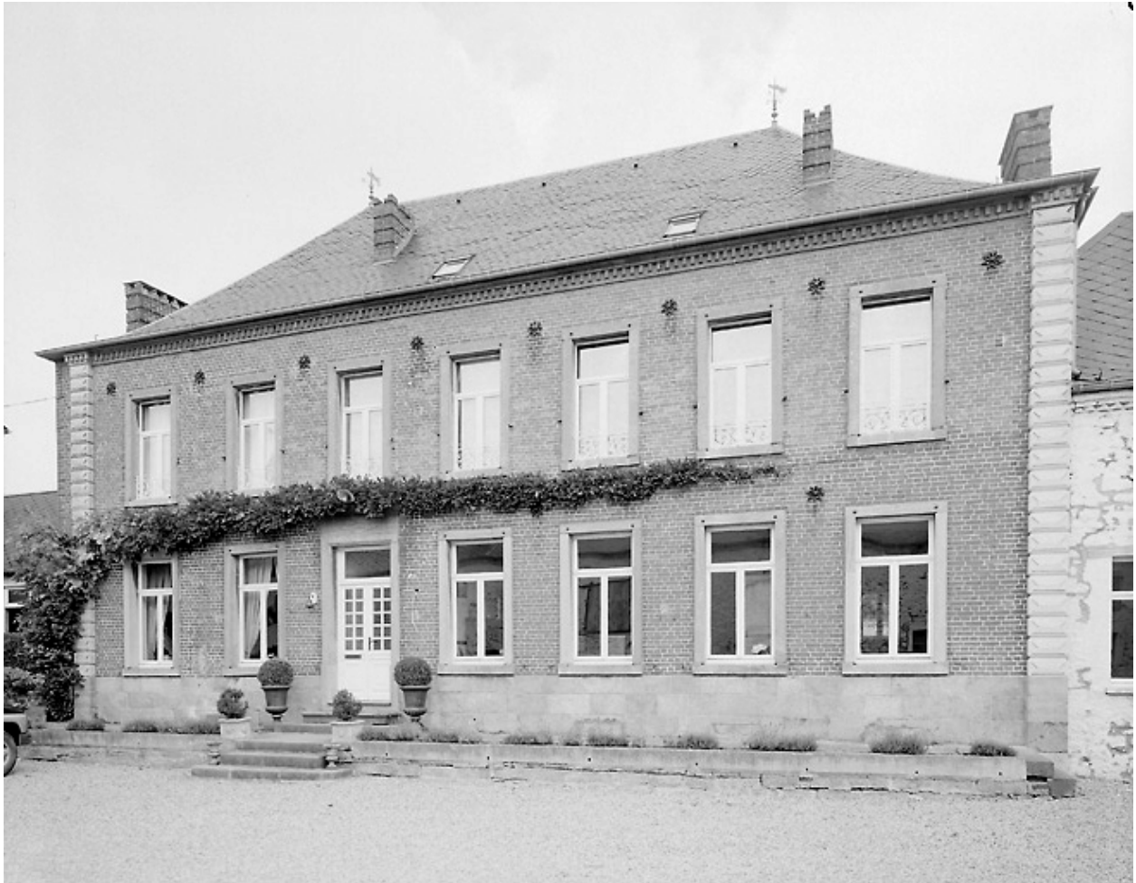
Vue du logis.