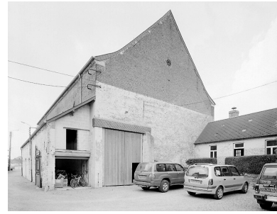
Vue de l'entrée de la grange.