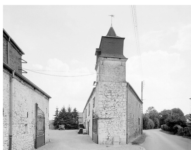
Entrée de la ferme avec la tour. IVR31_20055900599V