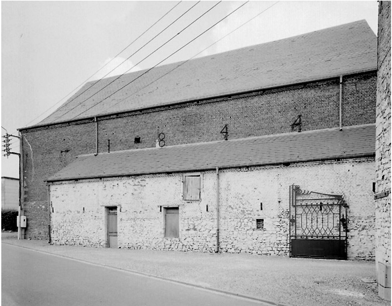
Vue de l'élévation latérale de la grange.