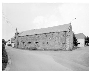
Vue des étables-fenil depuis la rue de l'Hôpital. IVR31_20055900595V

IVR31_20045905236NUCA