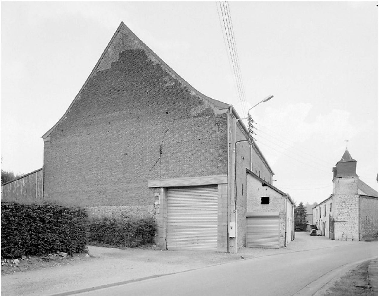
Vue de la grange depuis la rue de l'Hôpital.