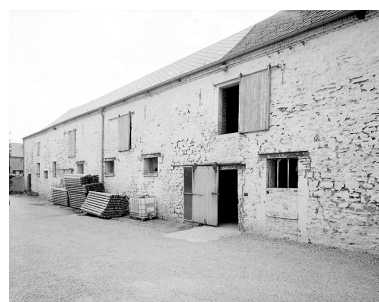
Vue des étables-fenil depuis la cour. IVR31_20055900592V