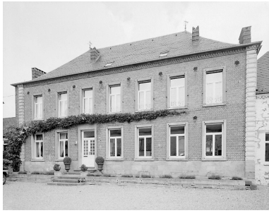
Vue du logis. IVR31_20055900591V