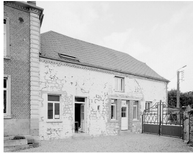
Vue du bâtiment abritant actuellement des bureaux.