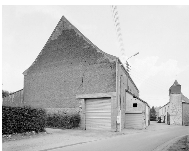
Vue de la grange depuis la rue de l'Hôpital. IVR31_20055900598V