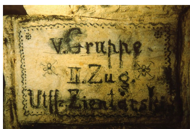
Vue d'une inscription allemande.