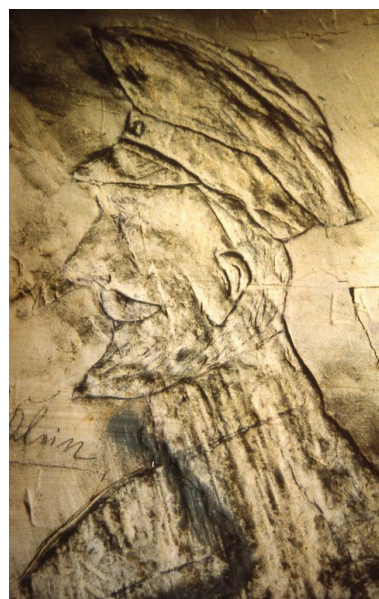
Vue d'un bas-relief présentant le buste d'un officier.