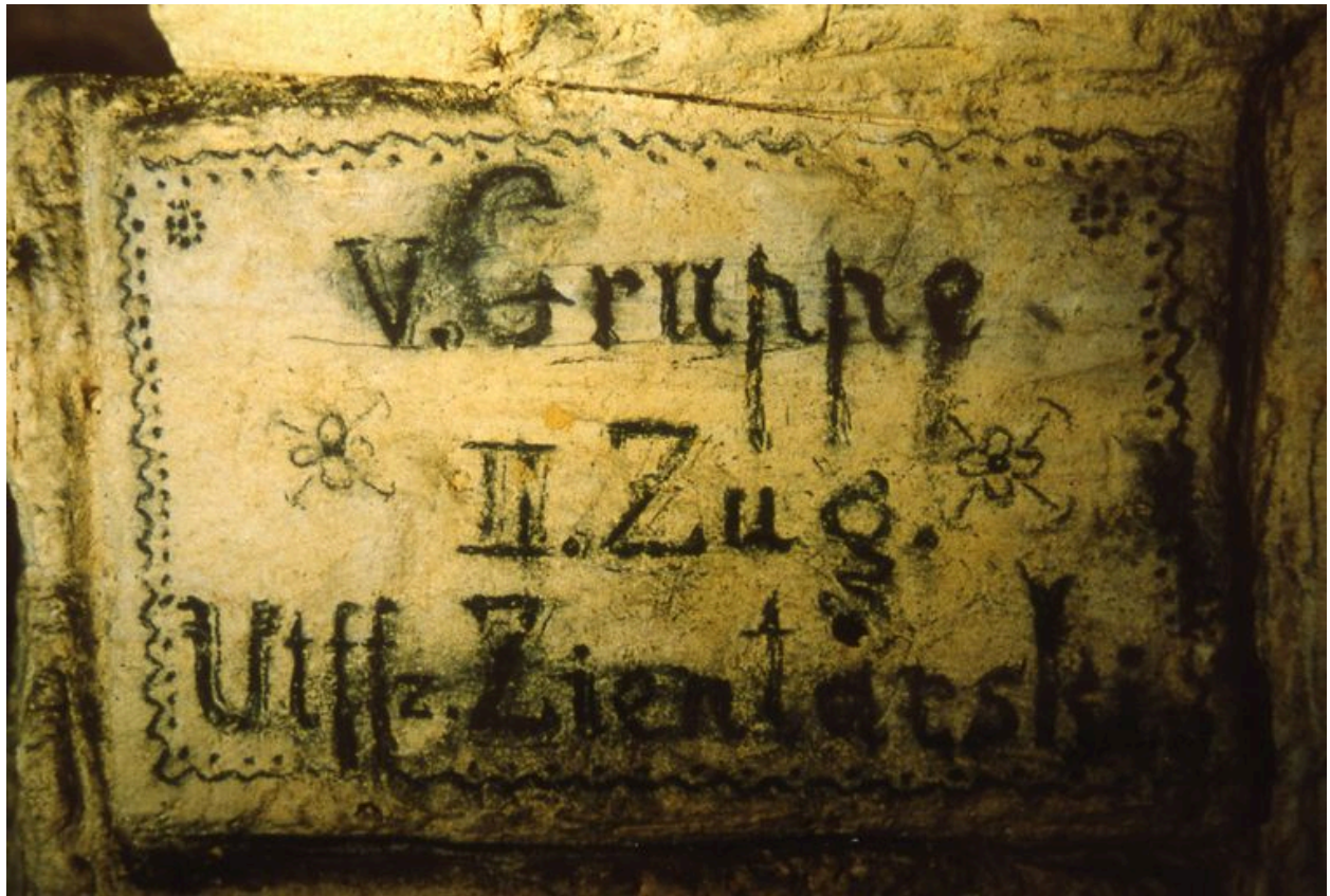
Vue d'une inscription allemande.