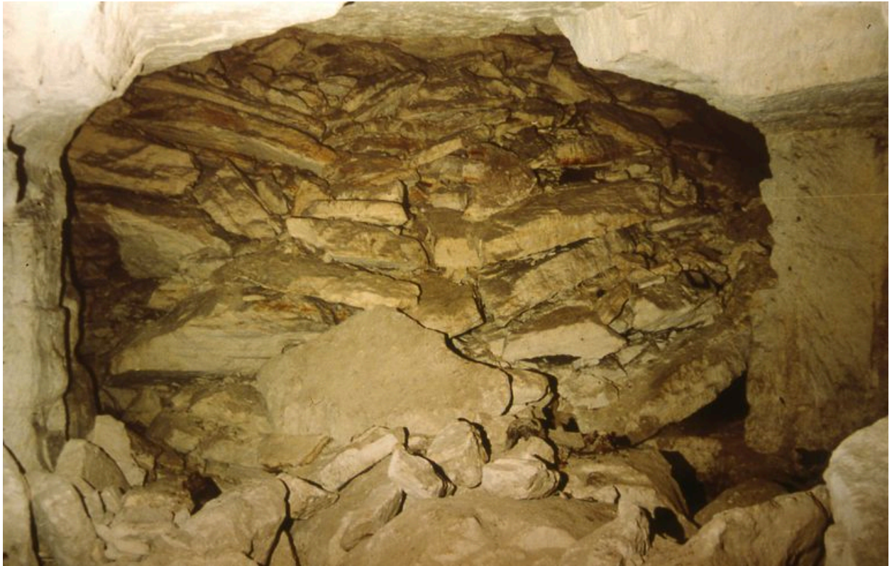
Vue d'une galerie obstruée.