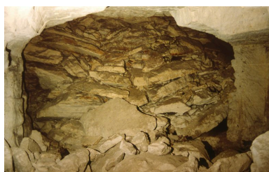
Vue d'une galerie obstruée.