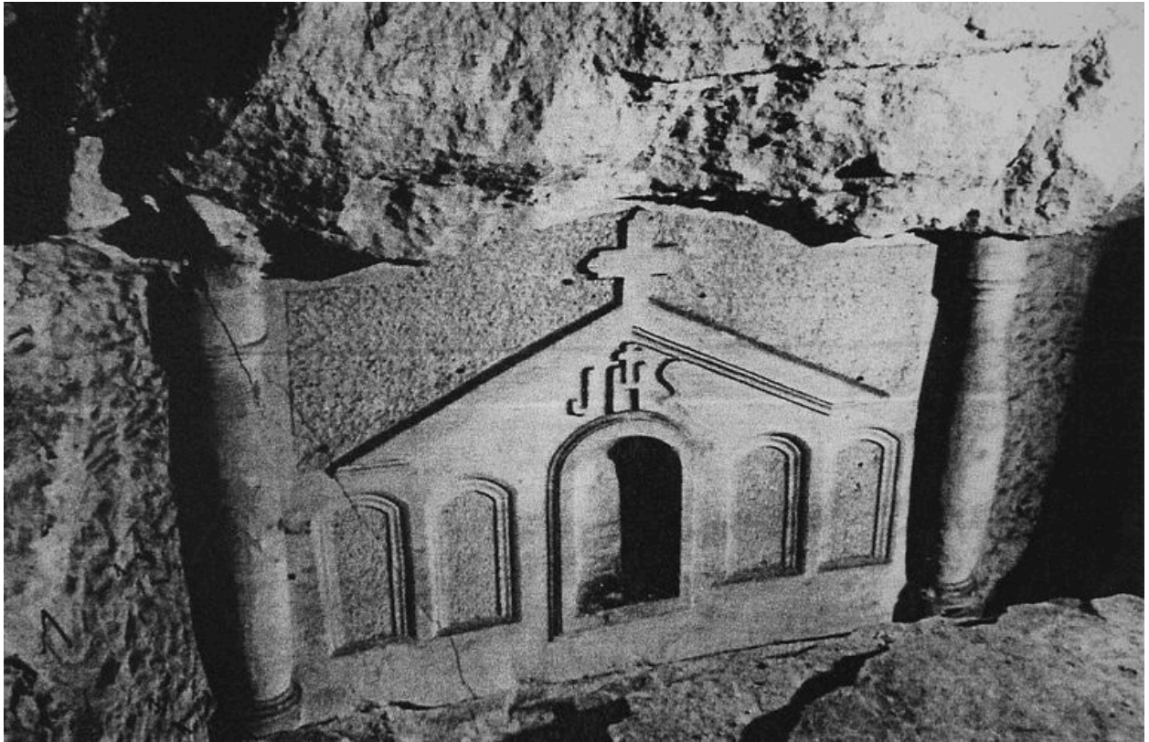
Vue d'un autel chrétien aujourd'hui disparu (DRAC Picardie, M. H.).