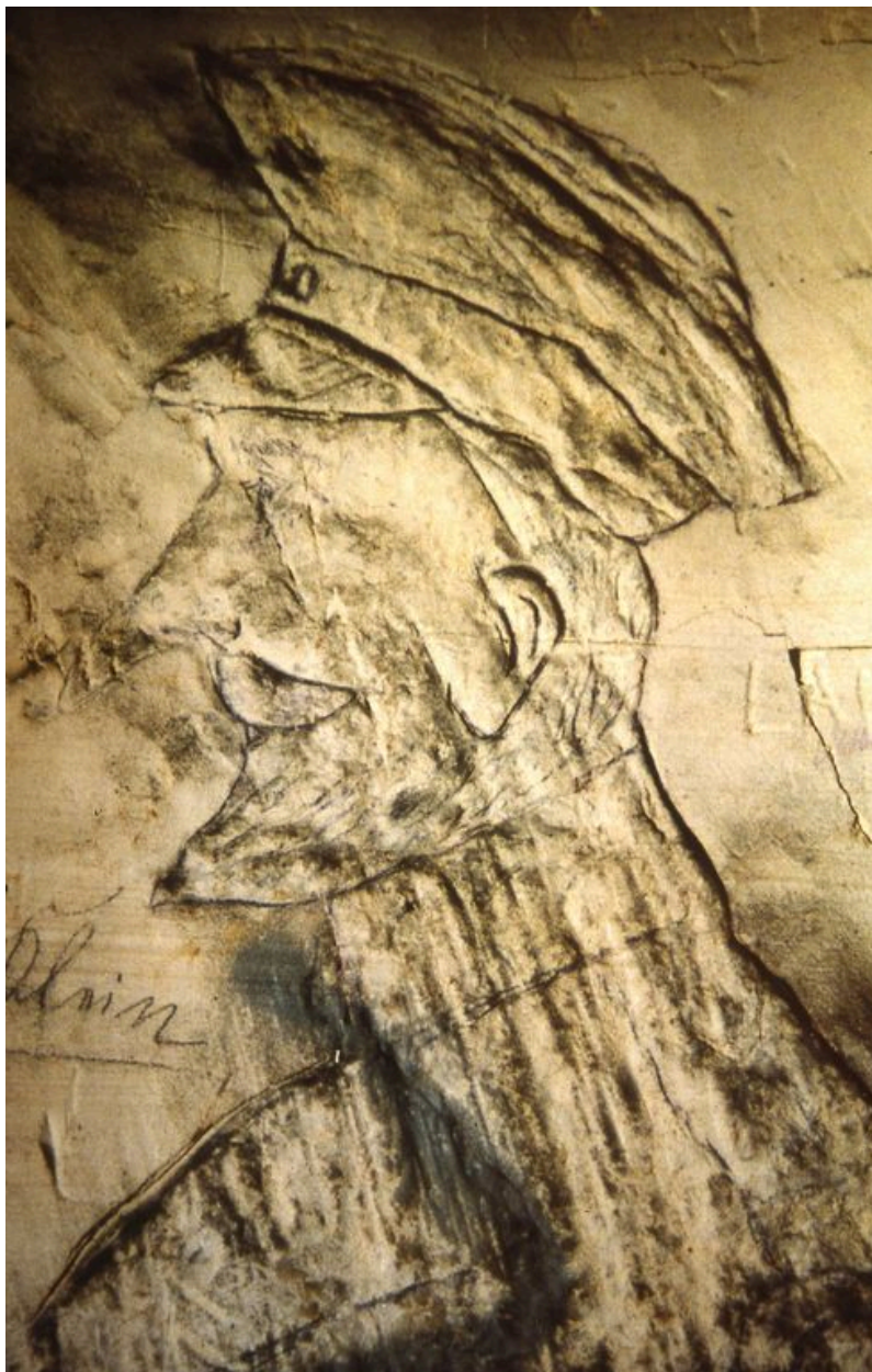
Vue d'un bas-relief présentant le buste d'un officier.