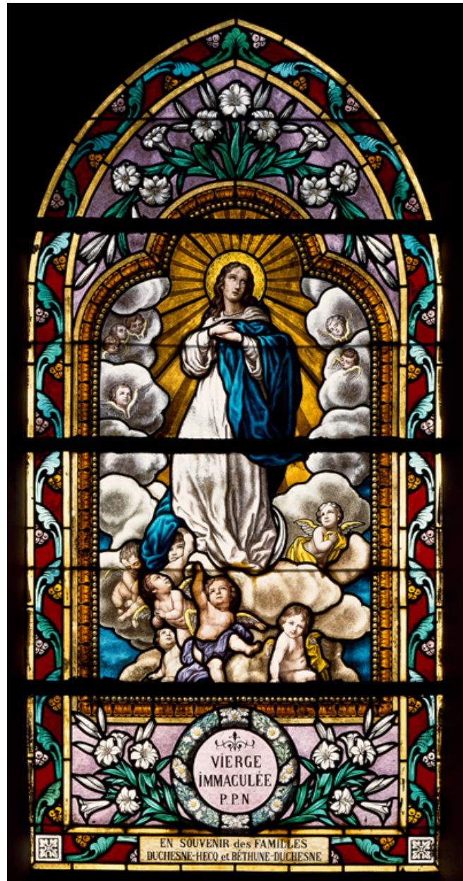
Verrière (baie 9) : Assomption, d'après Murillo.