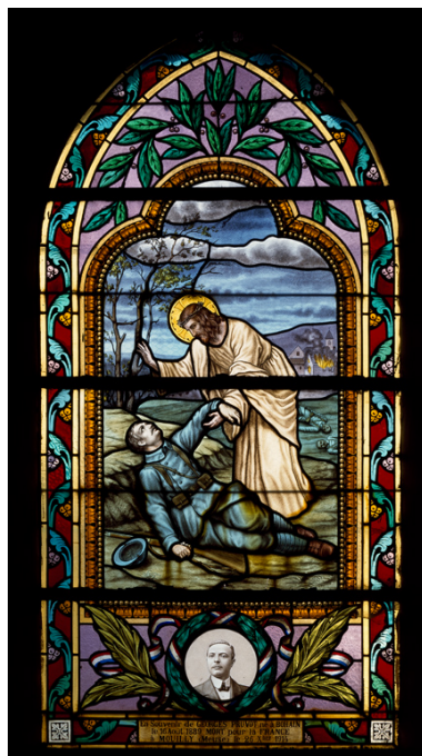
Verrière (baie 10) : Le Christ béni un soldat mourant.