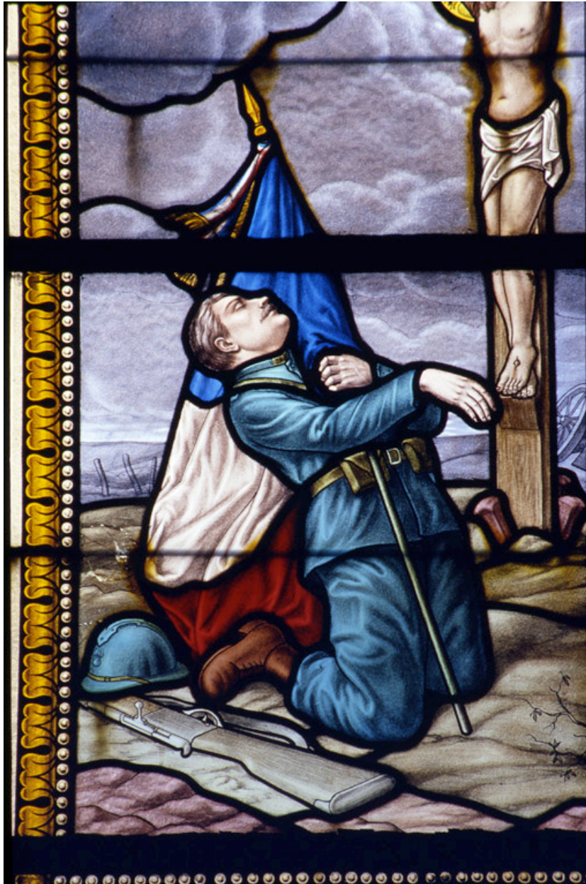
Détail de la verrière (baie 8) : porte-étendard blessé.