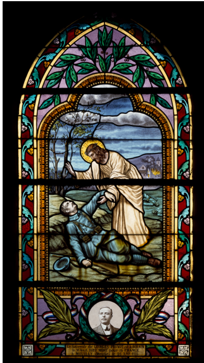
Verrière (baie 10) : Le Christ bénit un soldat mourant.