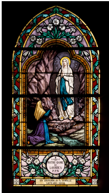
Verrière (baie 7) : Apparition de la Vierge à Bernadette Soubirous.