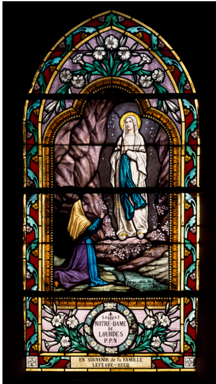
Verrière (baie 7) : Apparition de la Vierge à Bernadette Soubirous.