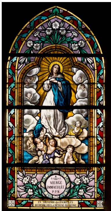
Verrière (baie 9) : Assomption, d'après Murillo. IVR22_19950202820XA