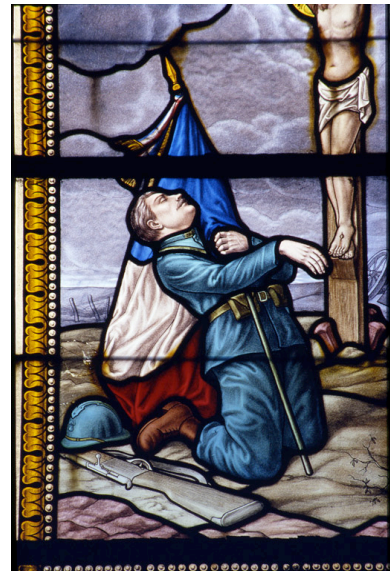
Détail de la verrière (baie 8) : porte-étendard blessé.