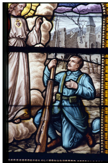
Détail de la verrière (baie 6) : soldat agenouillé.