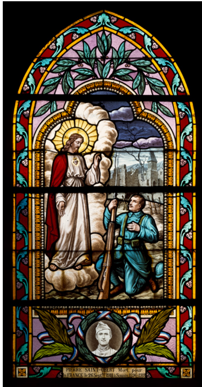
Verrière (baie 6) : Le Christ bénit un soldat.