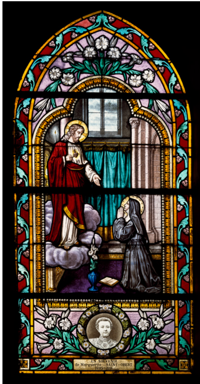
Verrière (baie 5) : Apparition du Christ à sainte Marguerite Marie Alacoque.