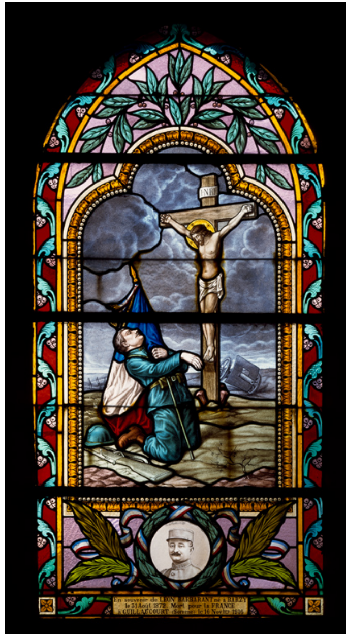
Verrière (baie 8) : Soldat tombant devant un Christ en croix.