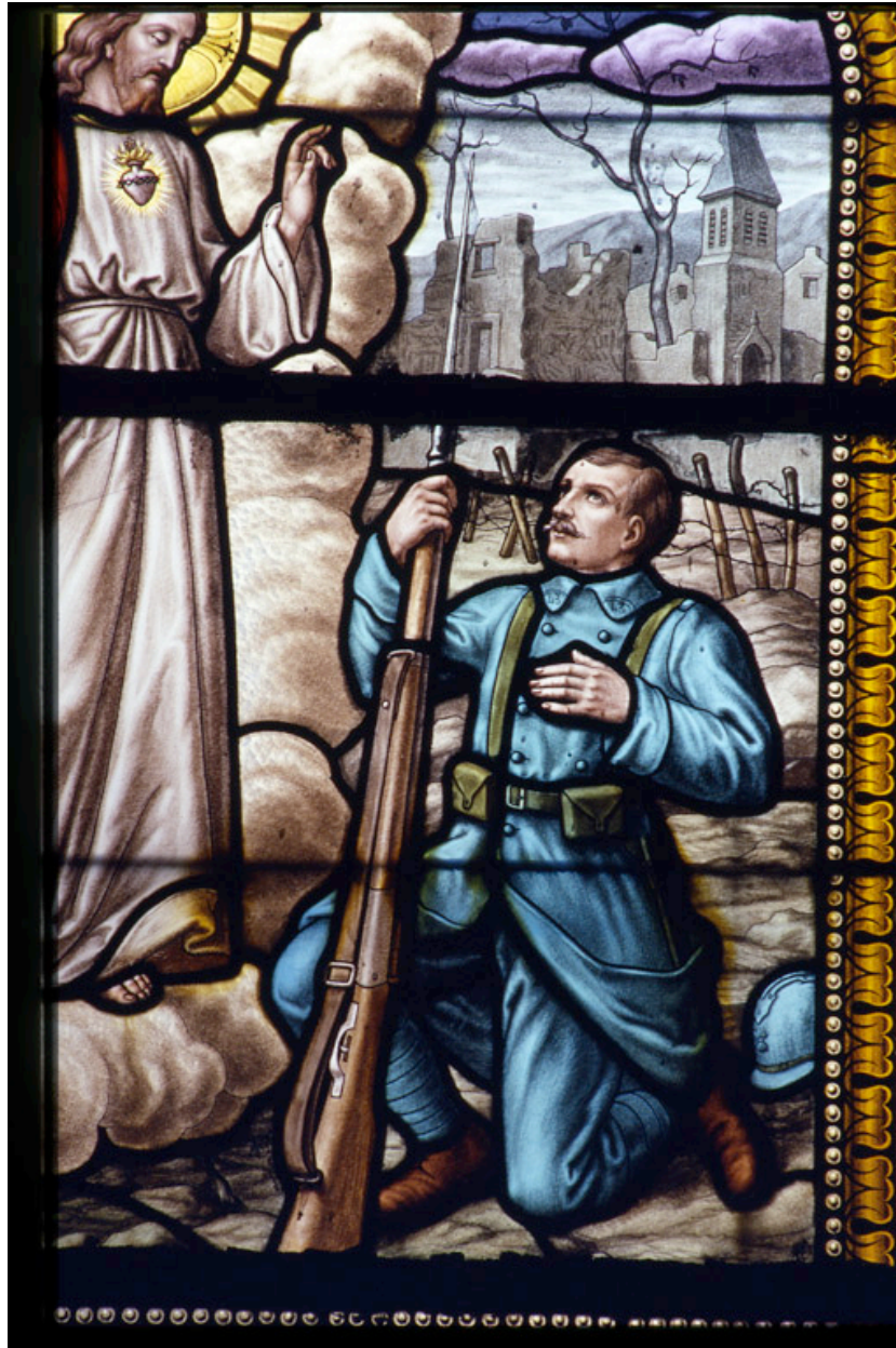
Détail de la verrière (baie 6) : soldat agenouillé.