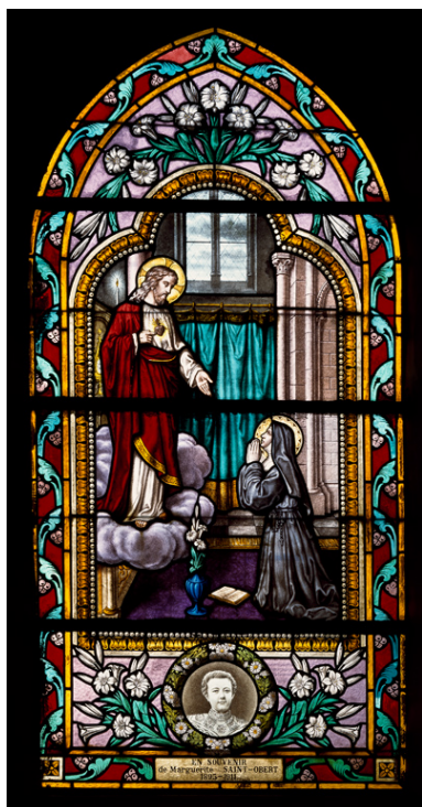
Verrière (baie 5) : Apparition du Christ à sainte Marguerite Marie Alacoque.