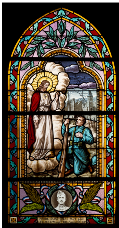
Verrière (baie 6) : Le Christ bénit un soldat.