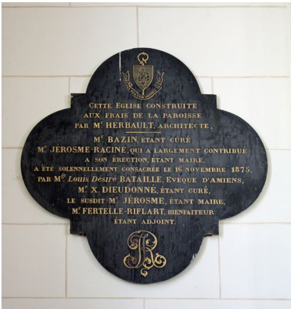
Plaque de la bénédiction de l'église.