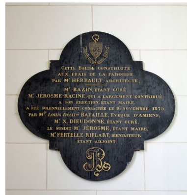
Plaque de la bénédiction de l'église.