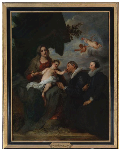
Tableau de la Vierge aux donateurs, copie de Van Dyck.