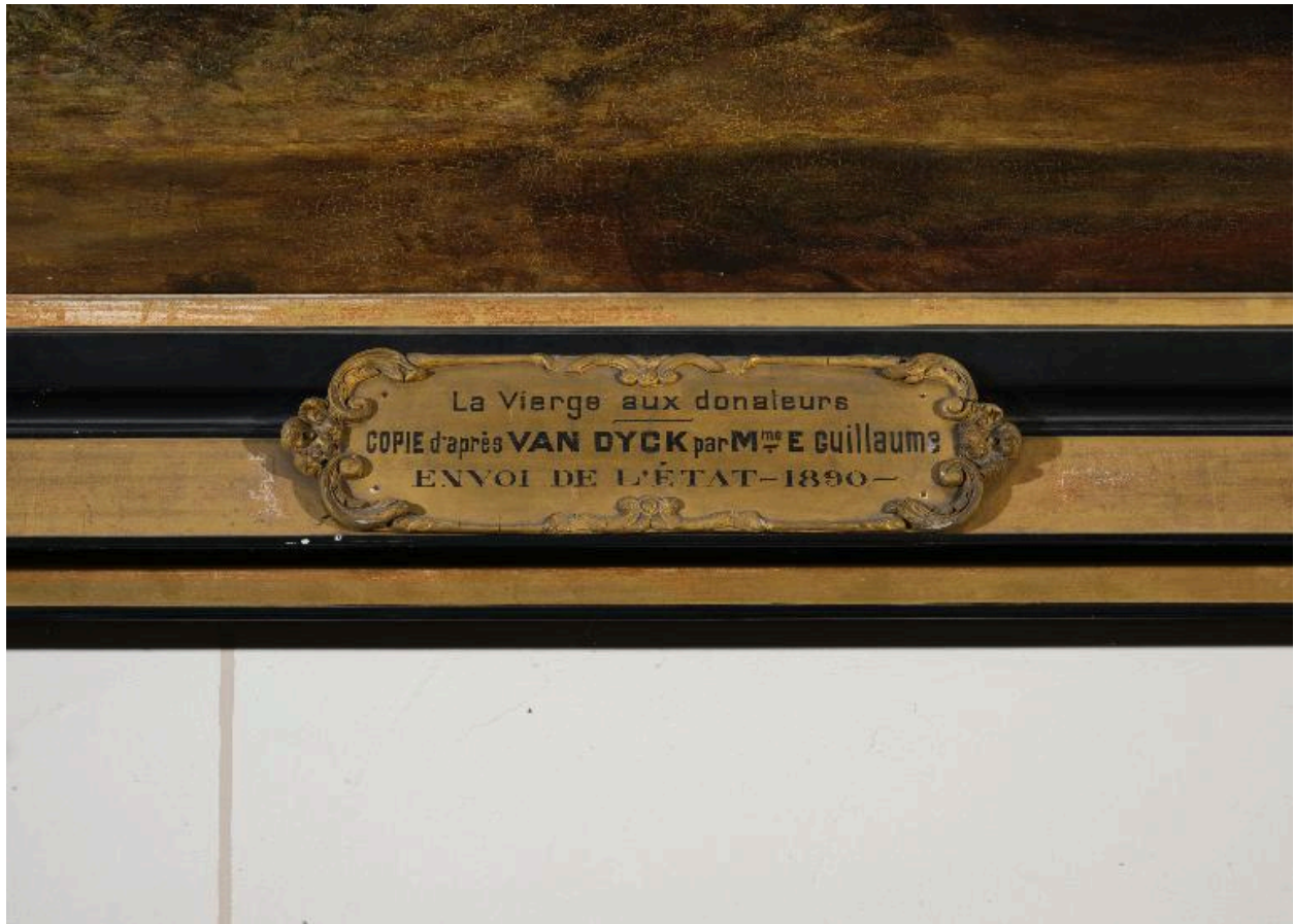
Tableau de la Vierge aux donateurs, détail de l'inscription sur le cadre.