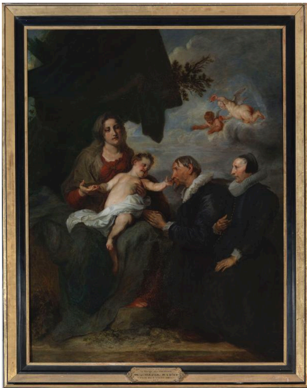
Tableau de la Vierge aux donateurs, copie de Van Dyck.