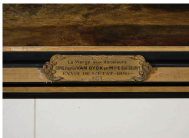
Tableau de la Vierge aux donateurs, détail de l'inscription sur le cadre. IVR22_20128000853NUC2A