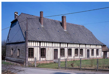
Vue générale. IVR22_19990201284XA

IVR22_20080290096NUCA