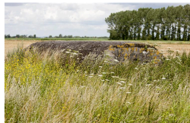
Vue vers le nord