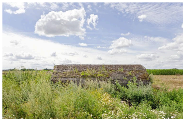
Vue vers le sud-ouest IVR31_20145904229NUCA