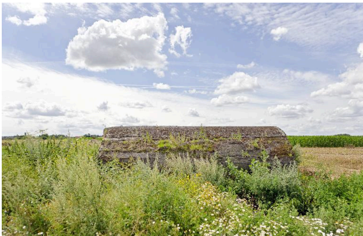
Vue vers le sud-ouest