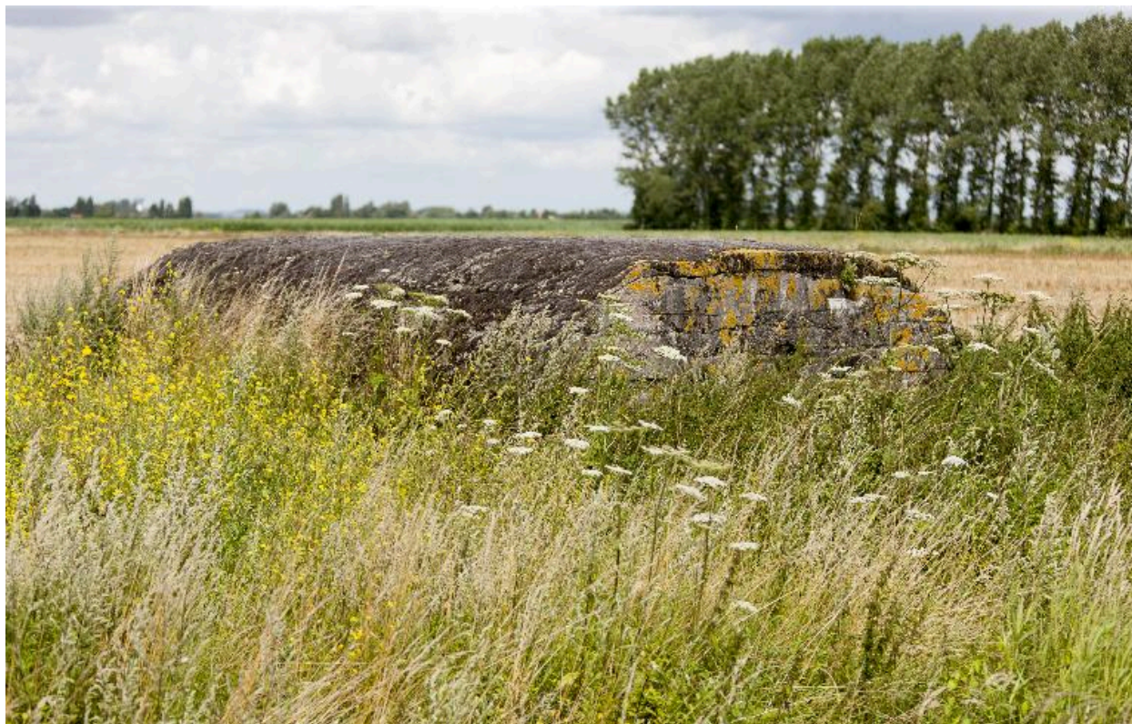
Vue vers le nord