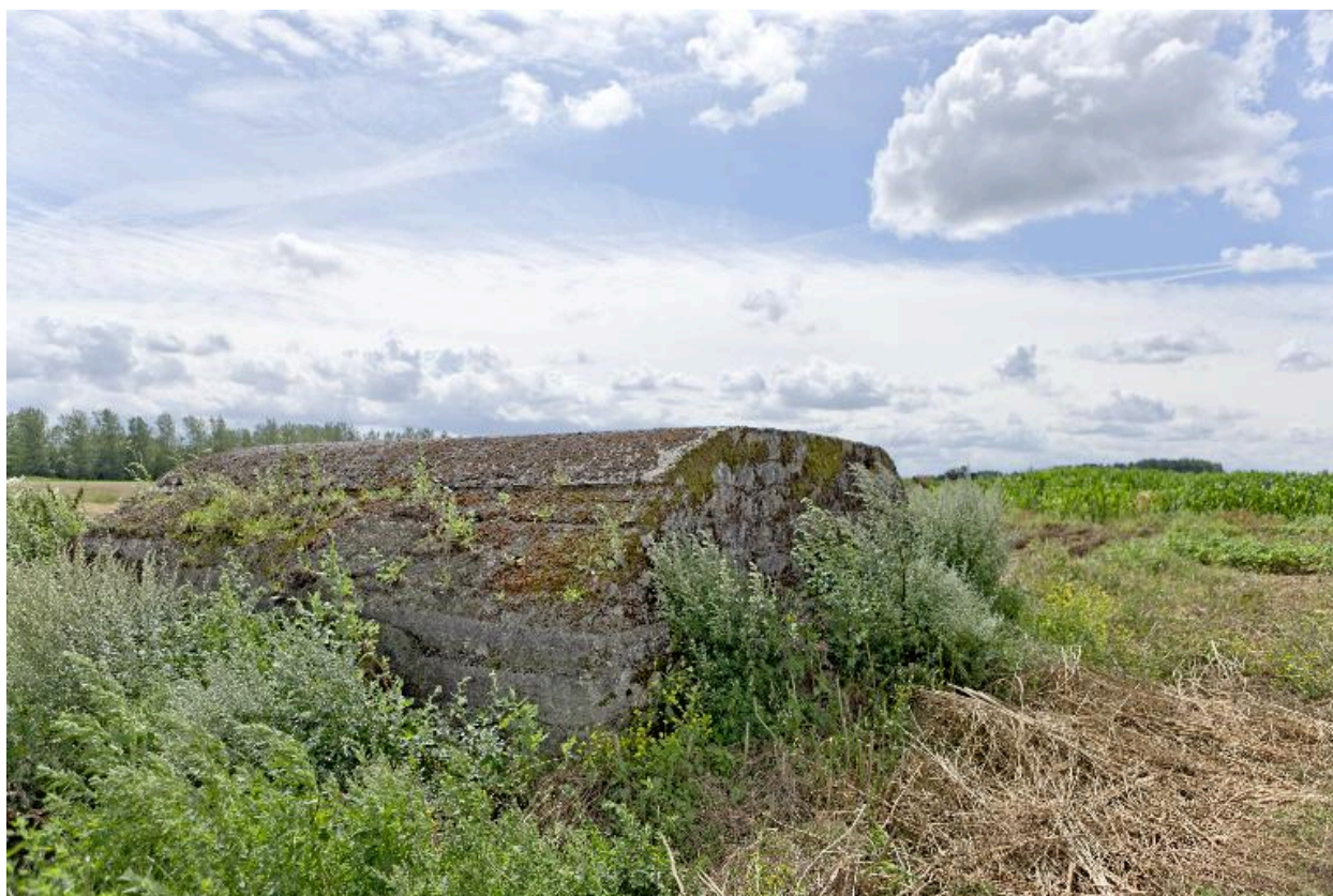
Vue vers le sud