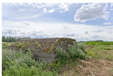
Vue vers le sud IVR31_20145904230NUCA