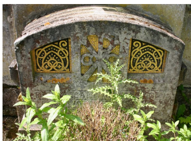
Détail du décor en mosaïques, ornant la base de la stèle à croix.