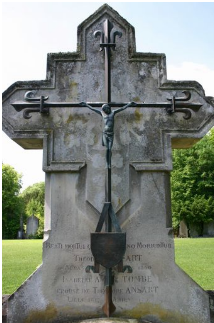
Détail de la croix en bronze.