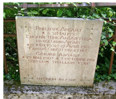
Stèle-épitaphe, côté gauche.