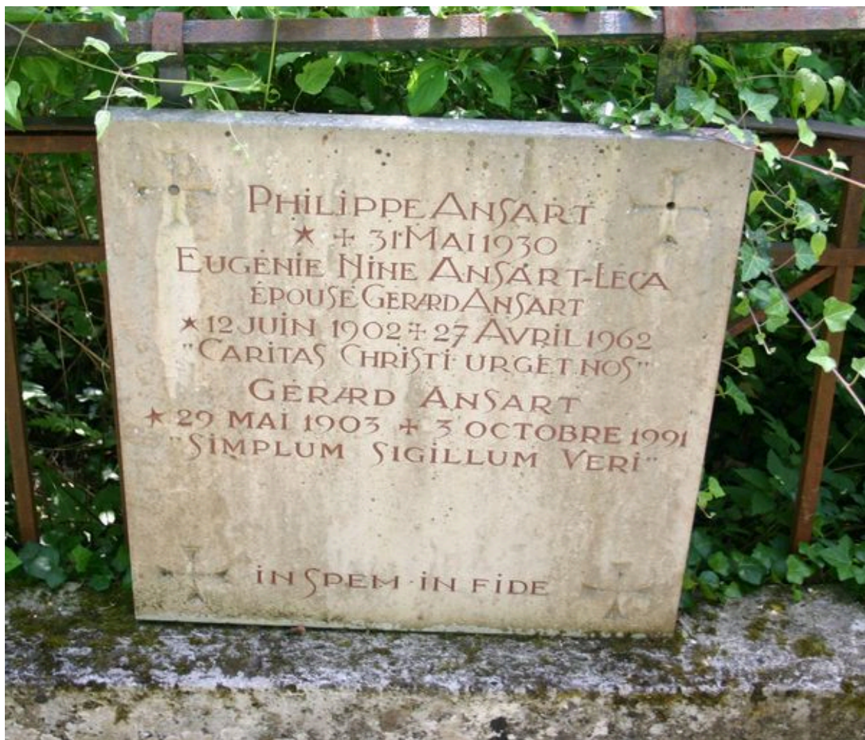
Stèle-épitaphe, côté gauche.