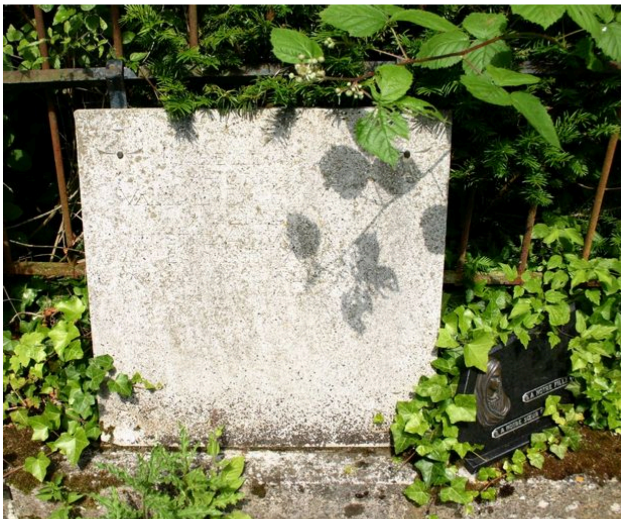
Stèle-épitaphe, côté droit.