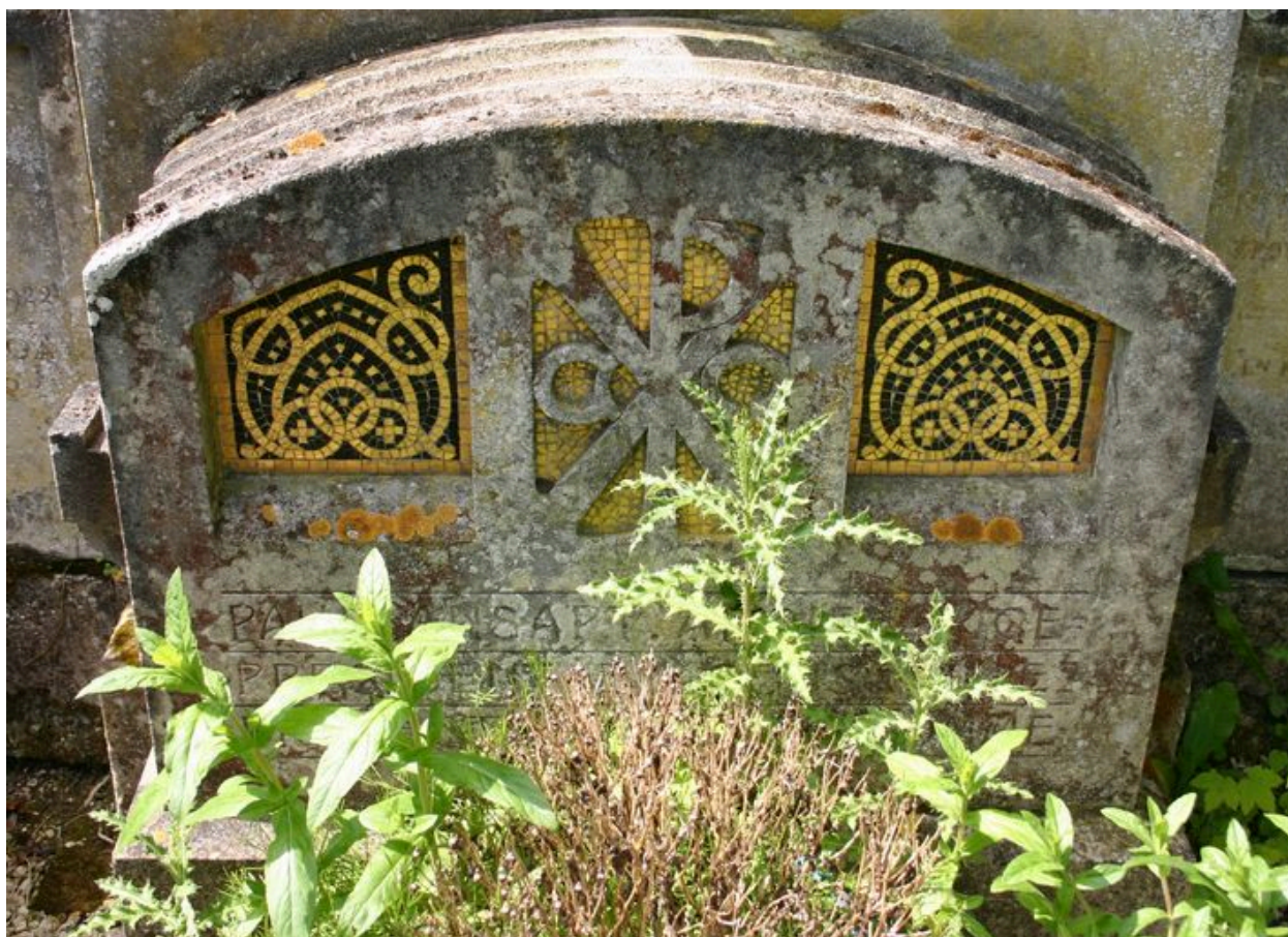
Détail du décor en mosaïques, ornant la base de la stèle à croix.