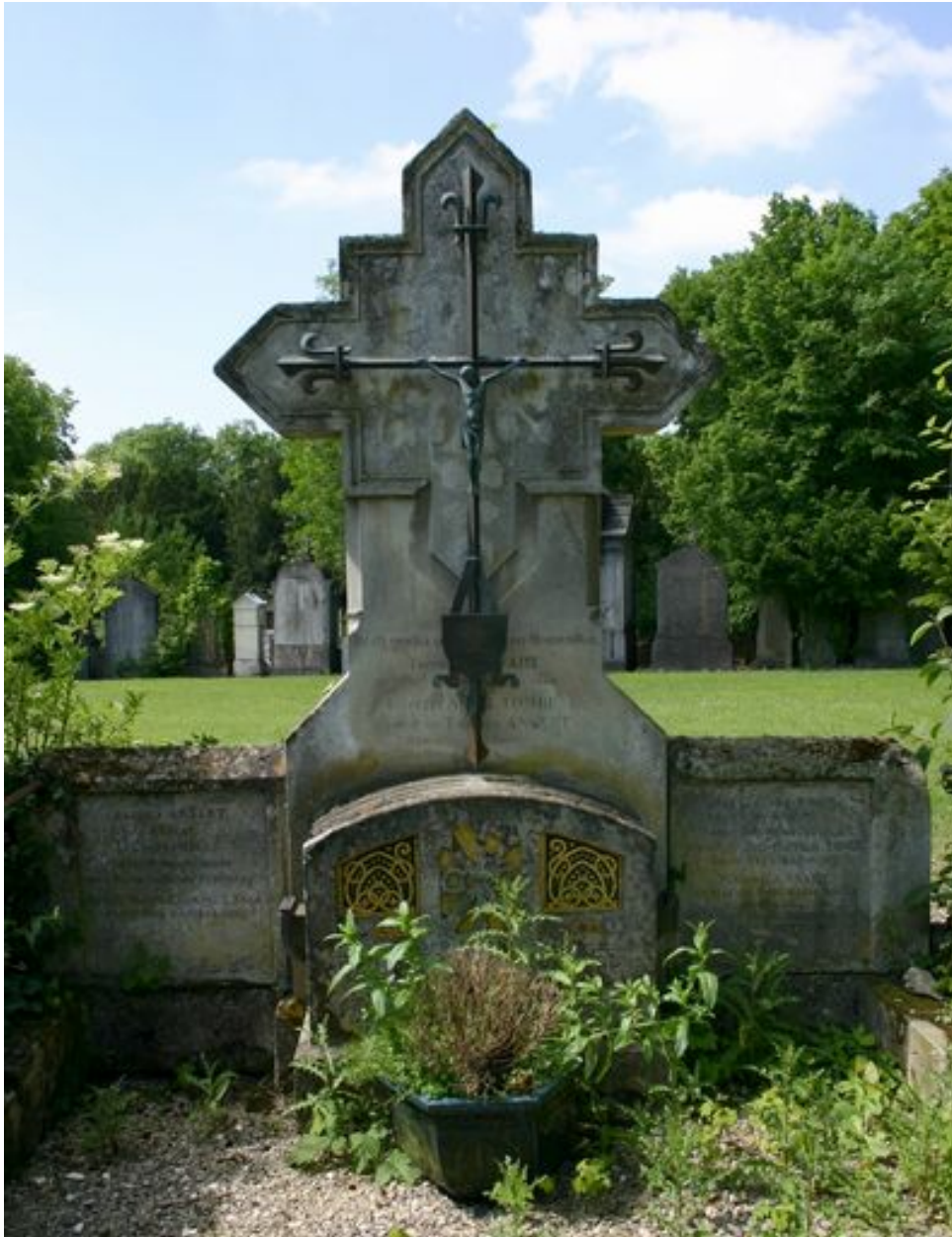
Stèle à croix monumentale.