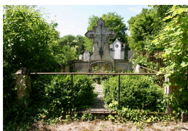
Vue générale. IVR22_20098001279NUCA