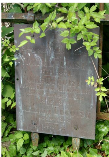
Plaque funéraire en bronze. IVR22_20098001284NUCA