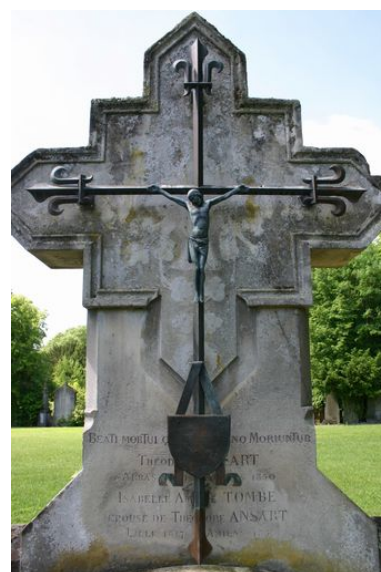
Détail de la croix en bronze.