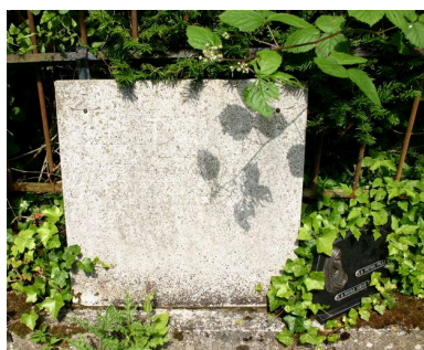
Stèle-épitaphe, côté droit. IVR22_20098001283NUCA