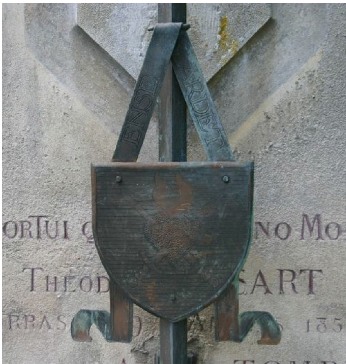
Déatil de la base de la croix en bronze.