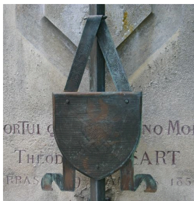
Détail de la base de la croix en bronze.

Phot. Caroline Vincent IVR22_20098001294NUCA