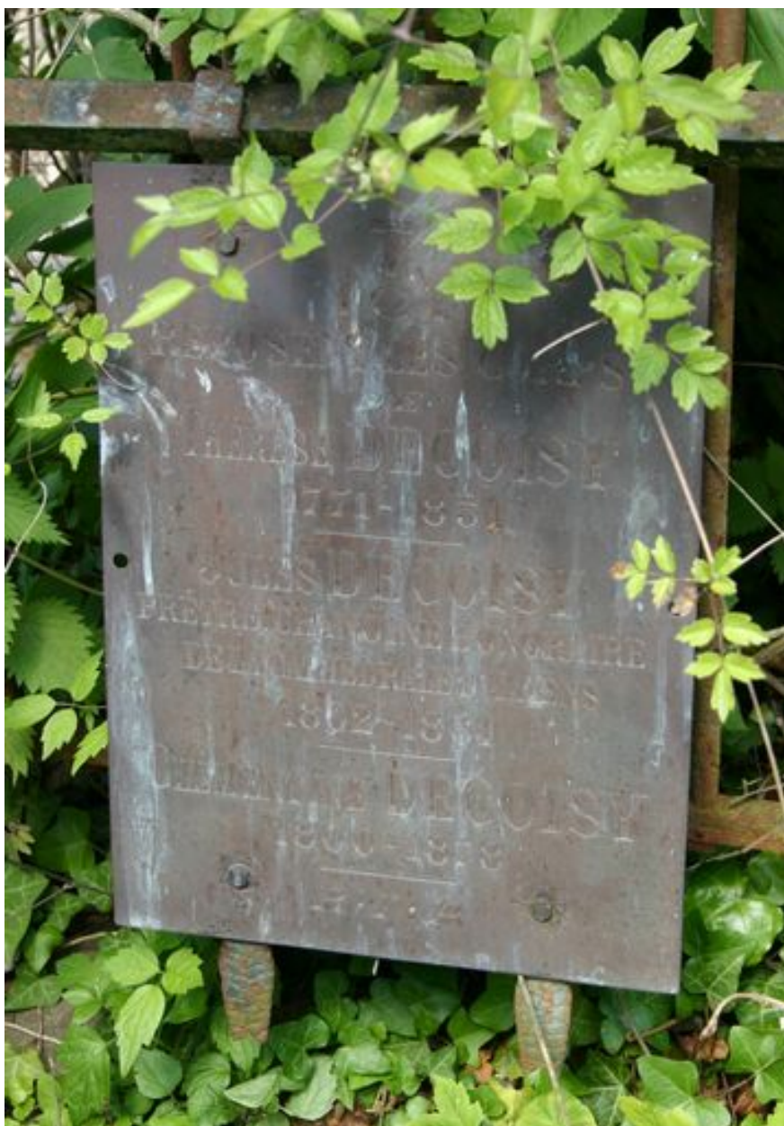
Plaque funéraire en bronze.