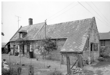
Elévation antérieure. IVR22_19846001102X

Plan de situation. Extrait du plan cadastral de 1982, section AI 157. IVR22_20096000291NUCA