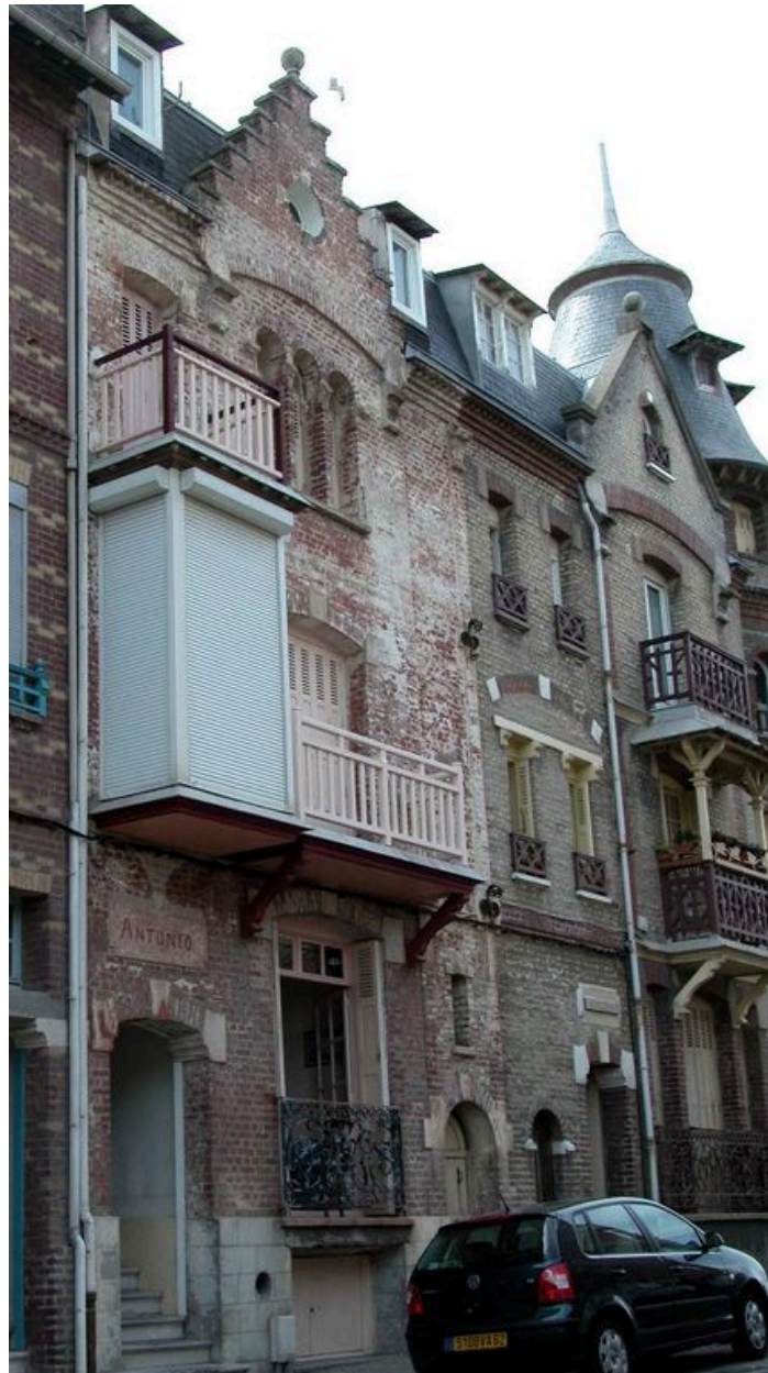
Vue du logement dit Antonio.