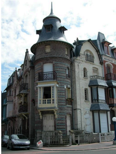
Vue d'ensemble depuis l'esplanade. IVR22_20038005336NUCA