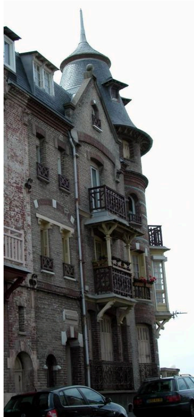
Vue d'ensemble. IVR22_20038005301NUCA