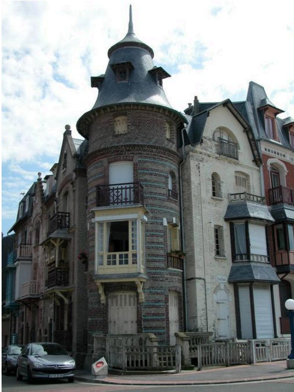
Vue d'ensemble depuis l'esplanade.