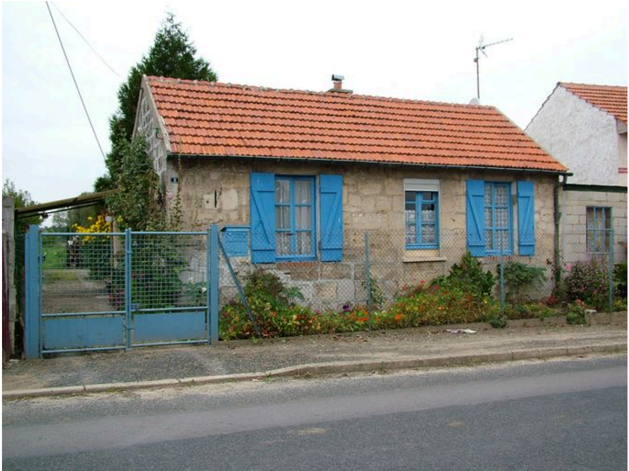
Vue générale d'une maison type.