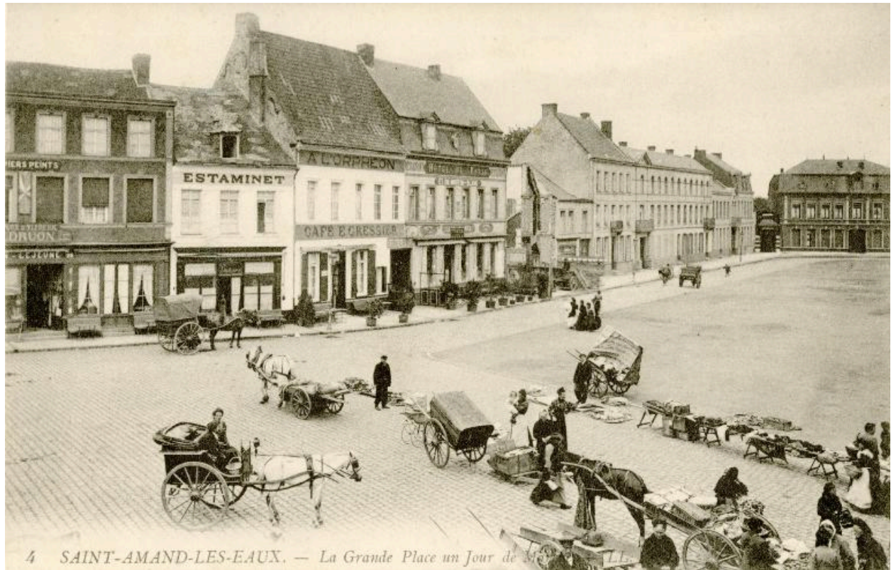
Vue générale de la place, côté ouest, début du 20e siècle, carte postale.