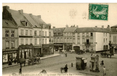
Vue de la place vers le sud, la fontaine, la rue d'Orchies et la rue de Tournai (à droite), carte postale, début du 20e siècle. IVR31_20135908075NUCA