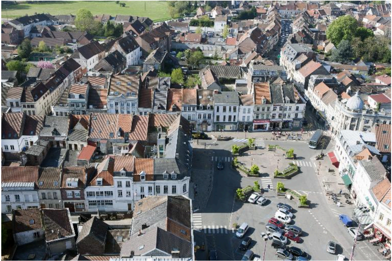
La place et la rue Thiers depuis la tour abbatiale.