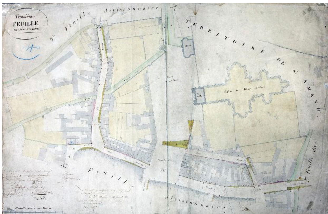
Cadastre de 1821, 3e feuille, le centre (Médiathèque Saint-Amand-les-Eaux, fonds ancien).