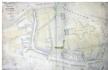
Cadastré de 1821, 3e feuille, le centre (Médiathèque Saint-Amand-les-Eaux, fonds ancien). IVR31_20125901844NUCA