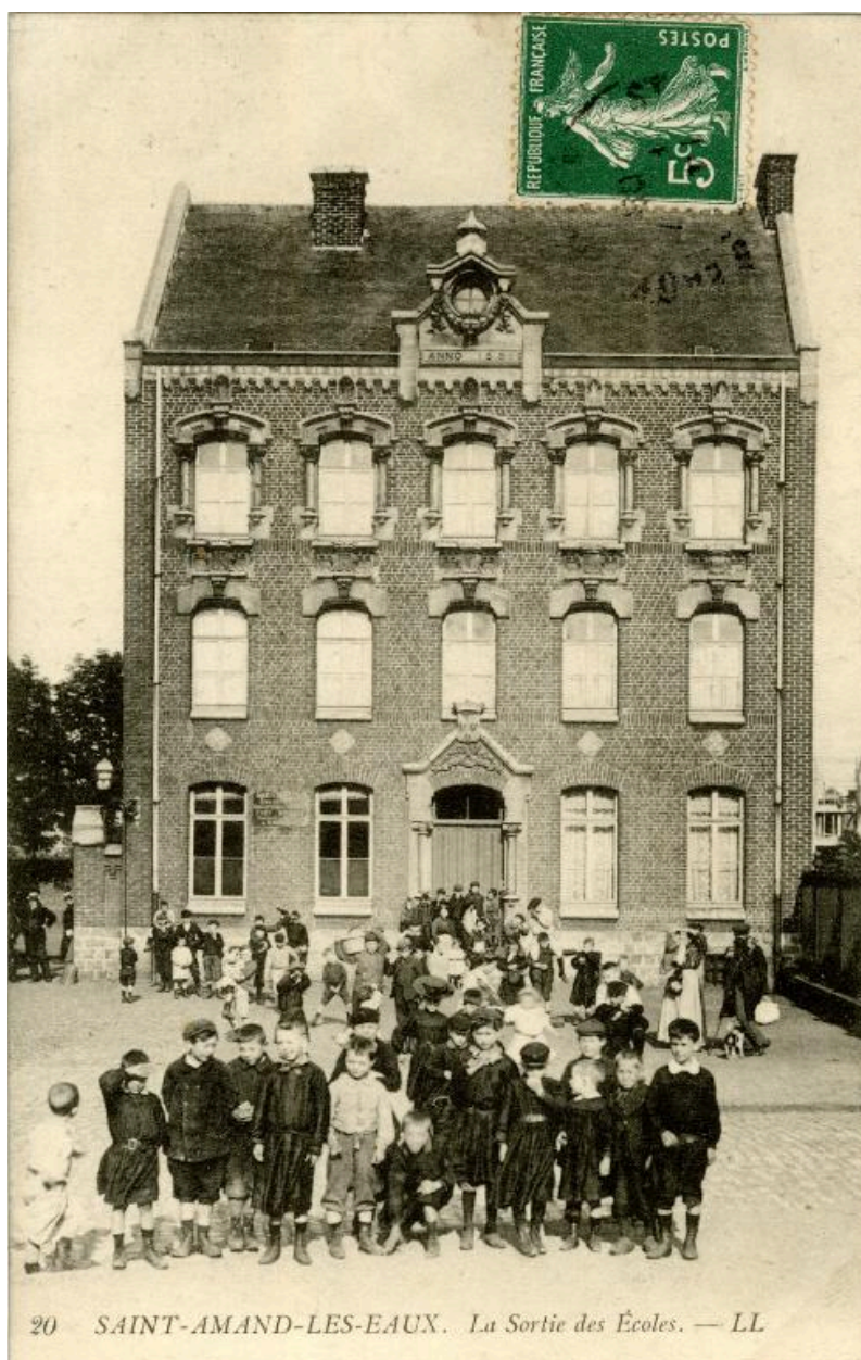
L'école construite en 1881 sur les ruines de l'ancienne abbaye, près de l'ancien échevinage, carte postale, début du 20e siècle.