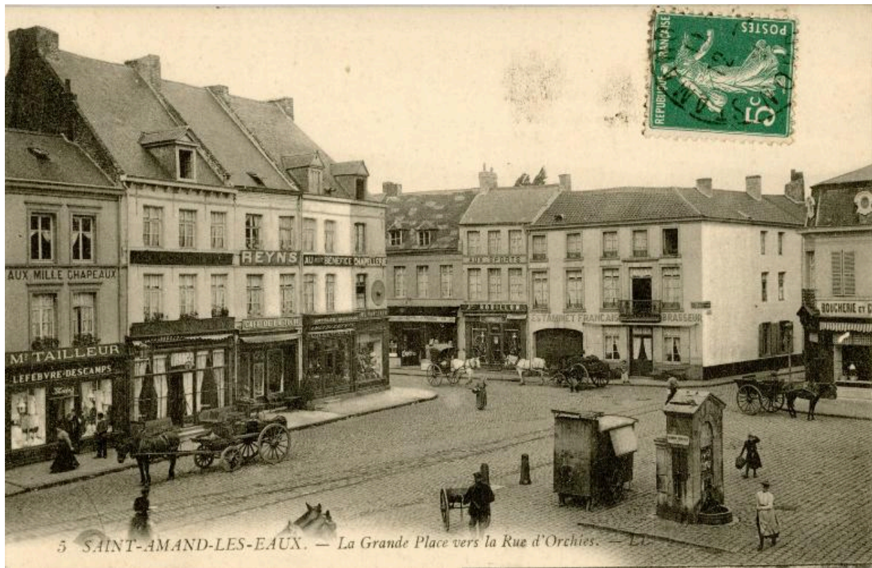
Vue de la place vers le sud, la fontaine, la rue d'Orchies et la rue de Tournai (à droite), carte postale, début du 20e siècle (Musée municipal Saint-Amand-les-Eaux).