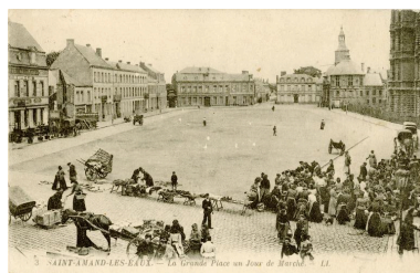
Vue générale de la place, début du 20e siècle, carte postale (Musée municipal Saint-Amand-les-Eaux). IVR31_20135908072NUCA