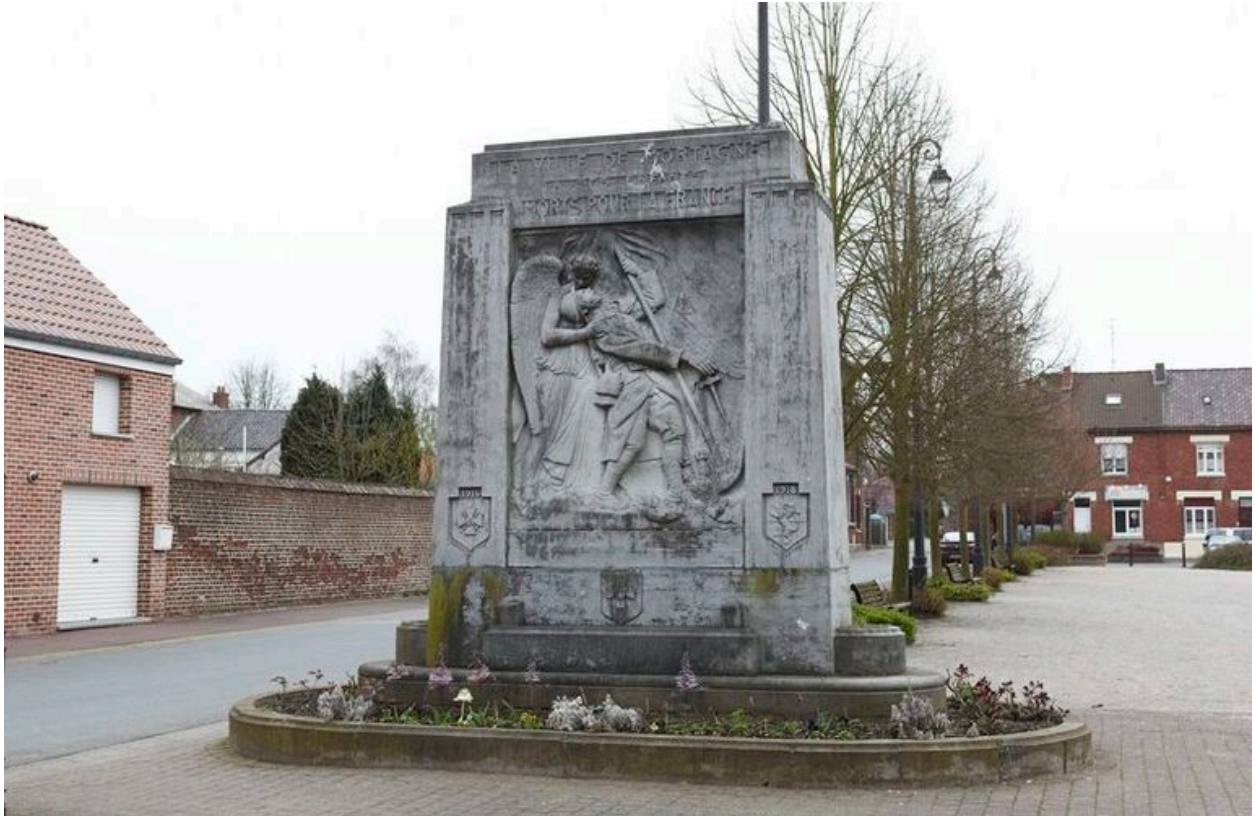
Vue générale du monument.