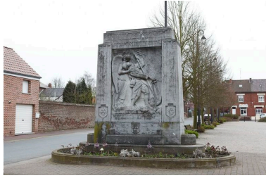
Vue générale du monument.