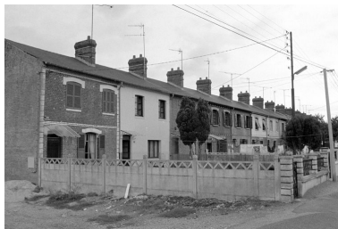
Logement d'ouvriers, vue partielle. IVR22_19908000612Z