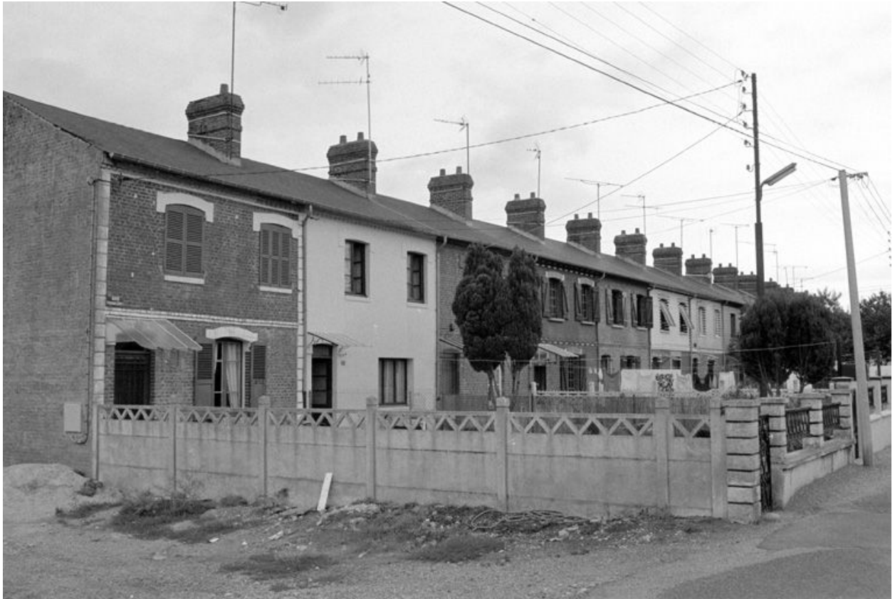
Logement d'ouvriers, vue partielle.