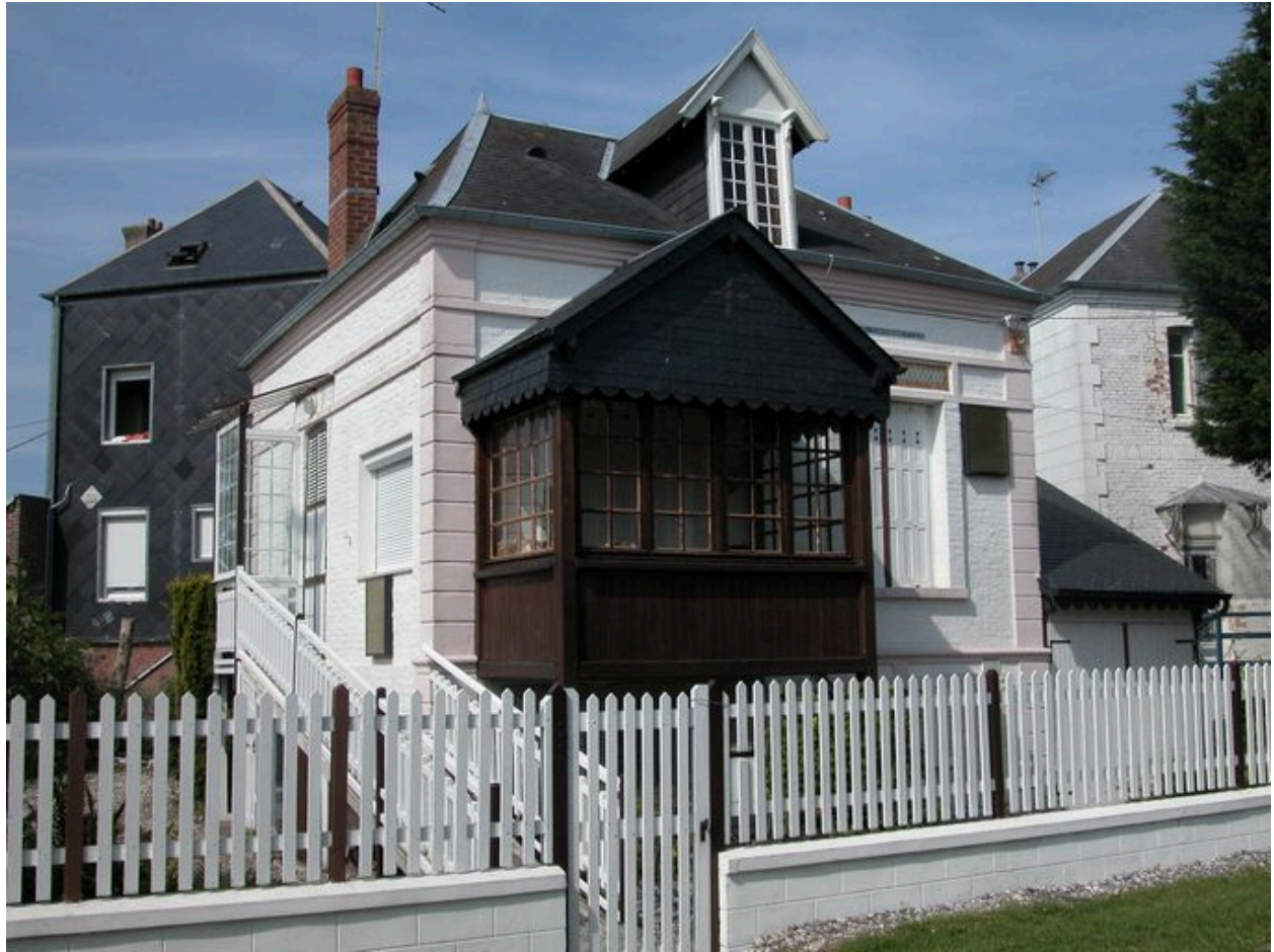
Vue de trois-quarts.