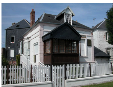
Vue de trois-quarts.