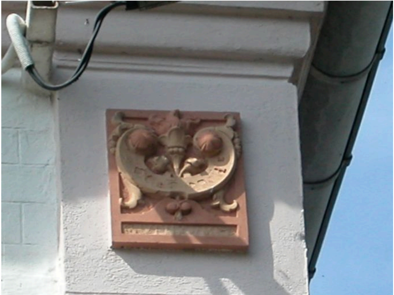
Détail de la plaque en argile portant signature (effacée).