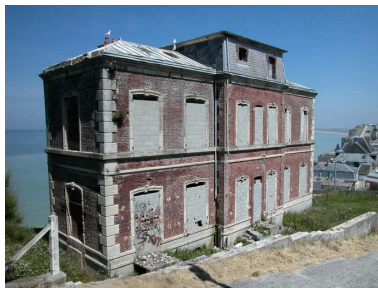
Vue d'ensemble, façade postérieure.