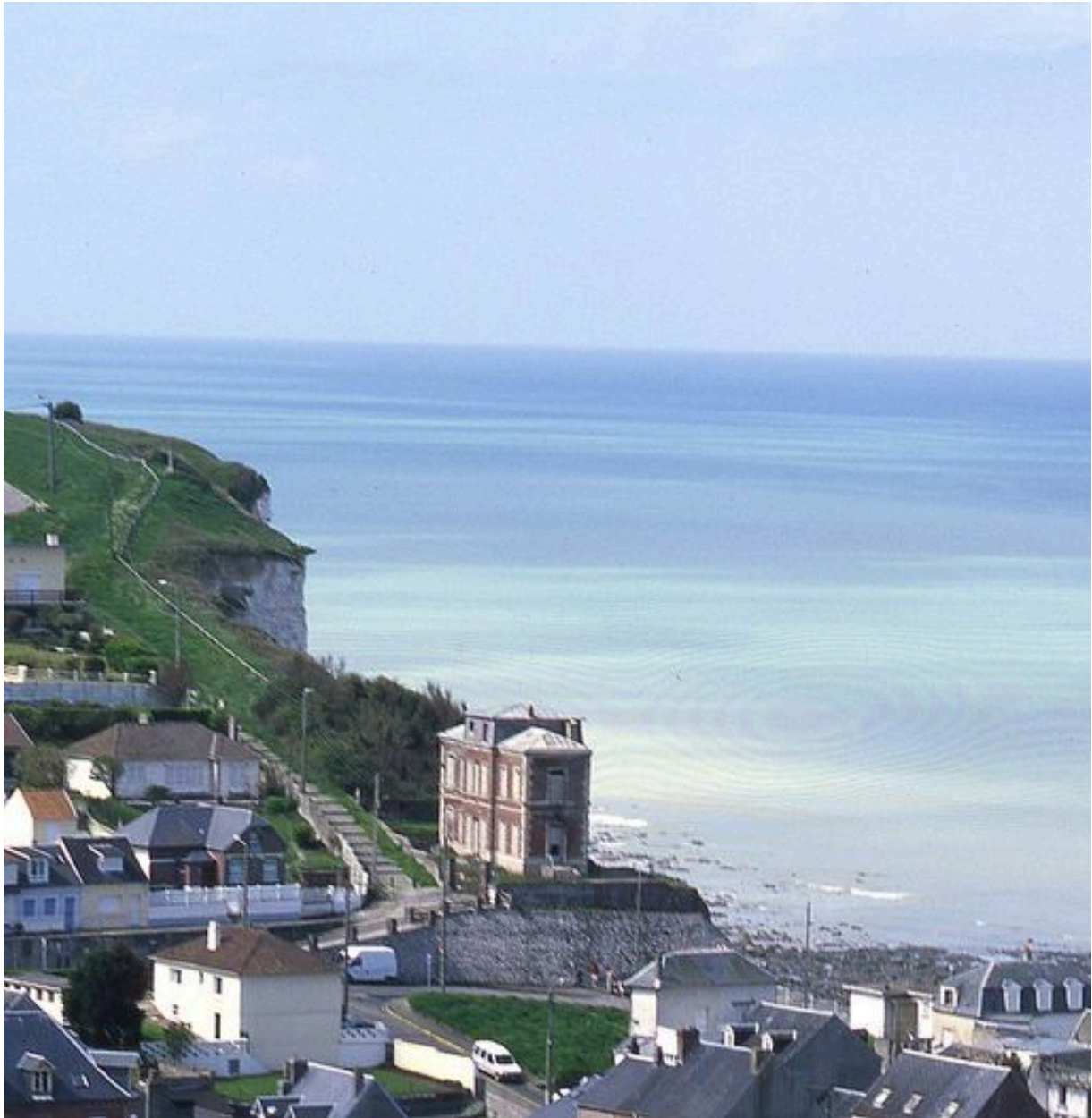
Vue d'ensemble depuis le site du Moulinet.