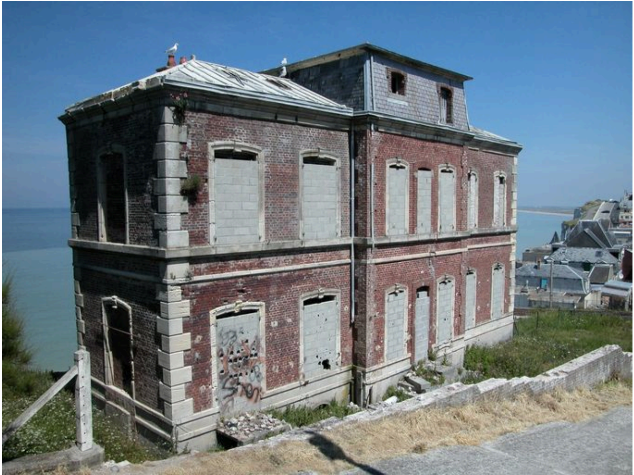
Vue d'ensemble, façade postérieure.