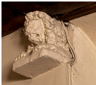
Blochet de la charpente du chœur.

IVR32_20226000930NUCA