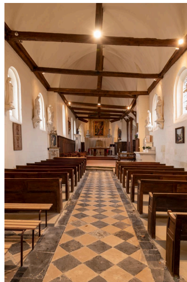
Vue vers le chœur. IVR32_20226000931NUCA