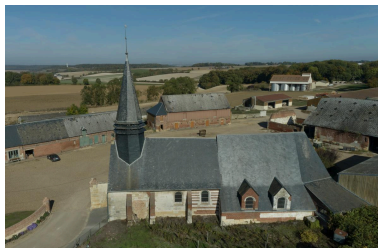
Vue aérienne de l'élévation sud. IVR32_20226001096NUCA