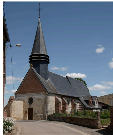
Vue générale depuis le sud-ouest. IVR32_20226000678NUCA