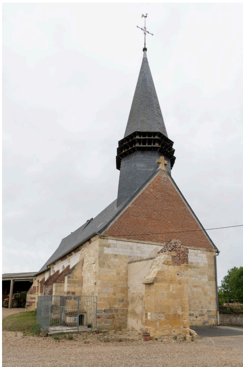
Vue depuis l'ouest.