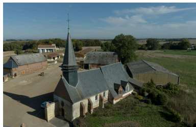
Vue générale et aérienne de l'église. IVR32_20226001095NUCA