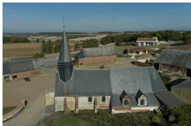
Vue aérienne de l'élévation sud. IVR32_20226001096NUCA