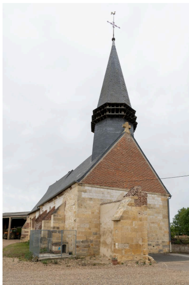
Vue depuis l'ouest. IVR32_20226000932NUCA