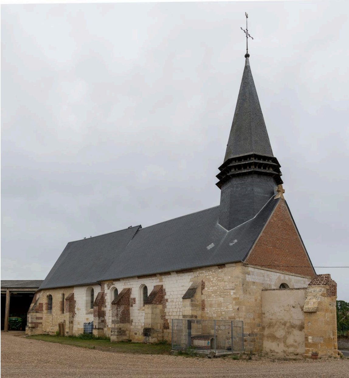
Vue depuis le nord-ouest.