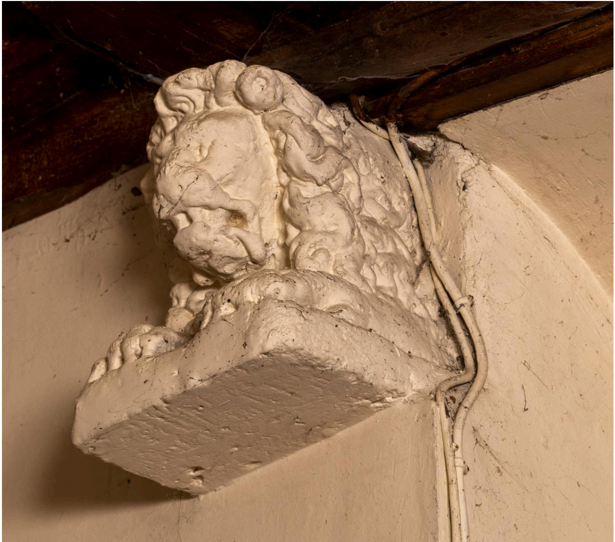
Blochet de la charpente du chœur.