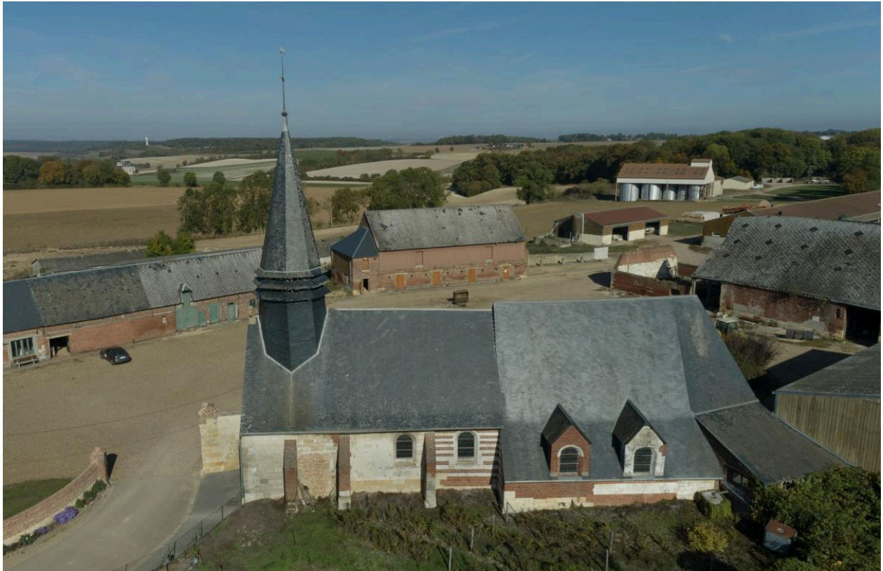
Vue aérienne de l'élévation sud.