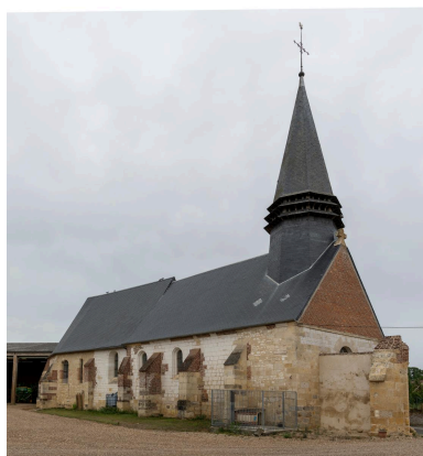
Vue depuis le nord-ouest. IVR32_20226000933NUCA