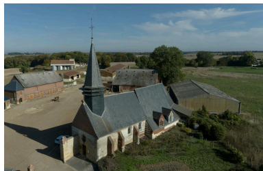
Vue générale et aérienne de l'église.