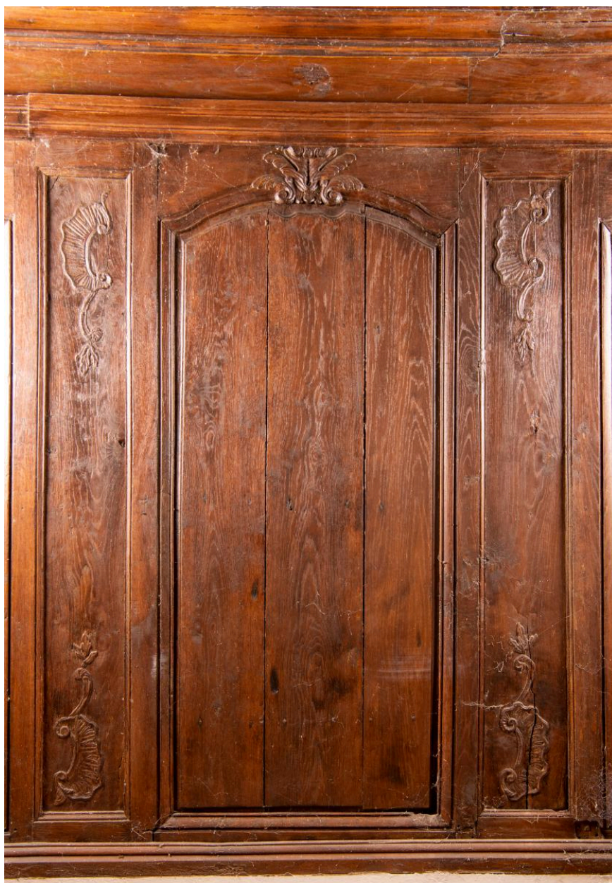
Panneau de lambris du chœur, 2e moitié du 18e siècle.