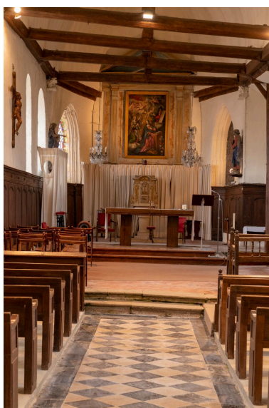
Vue du chœur depuis la nef.