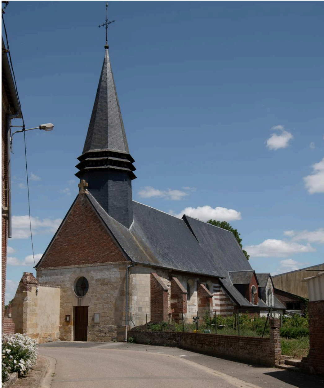
Vue générale depuis le sud-ouest.