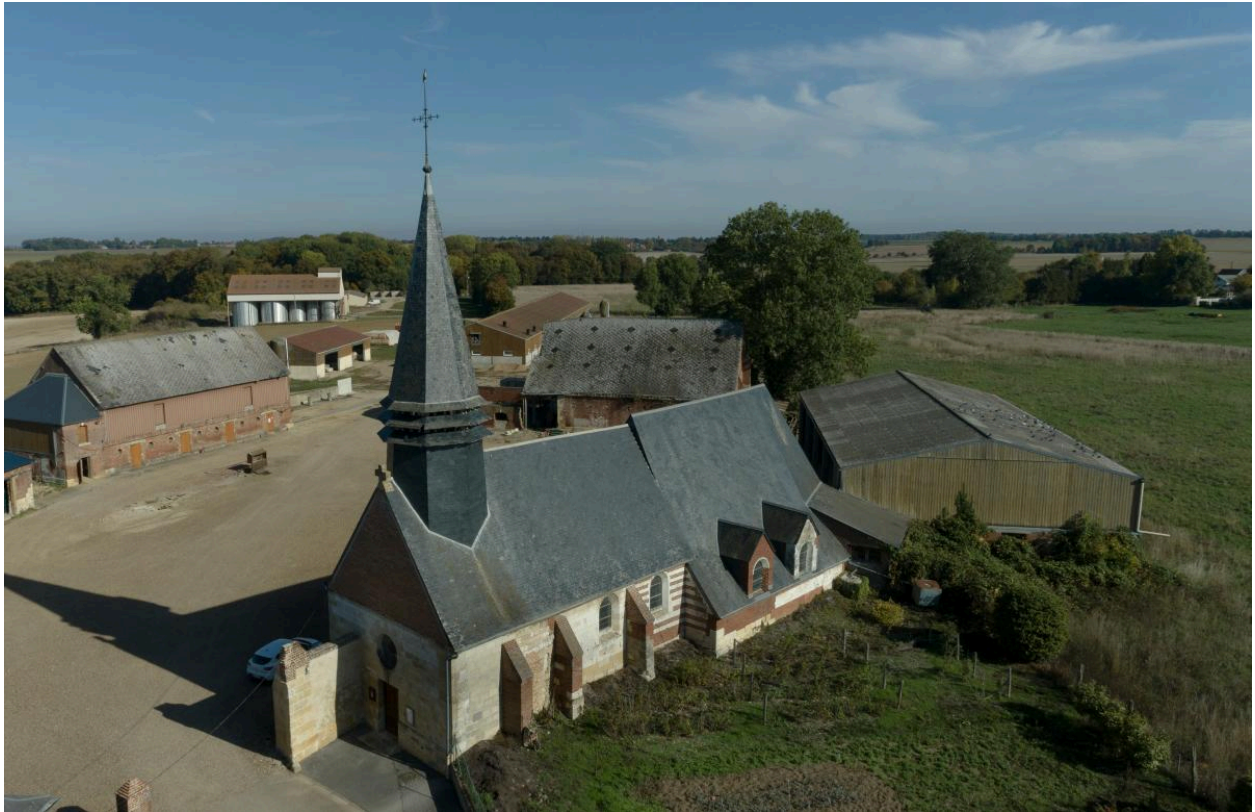
Vue générale et aérienne de l'église.