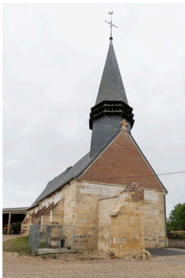
Vue depuis l'ouest. IVR32_20226000932NUCA