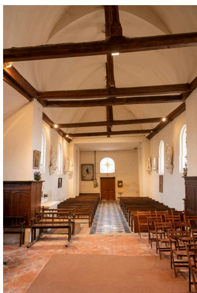
Vue vers la nef.