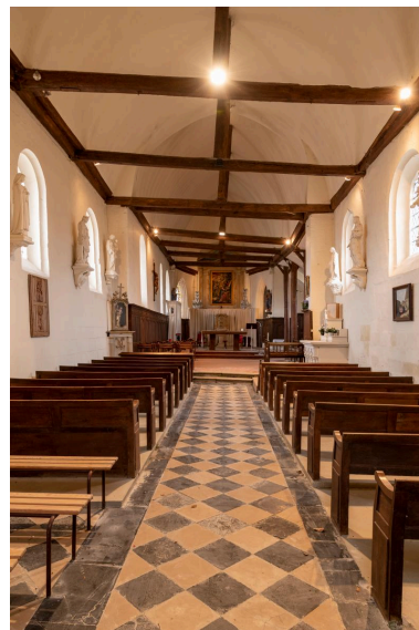
Vue vers le chœur.