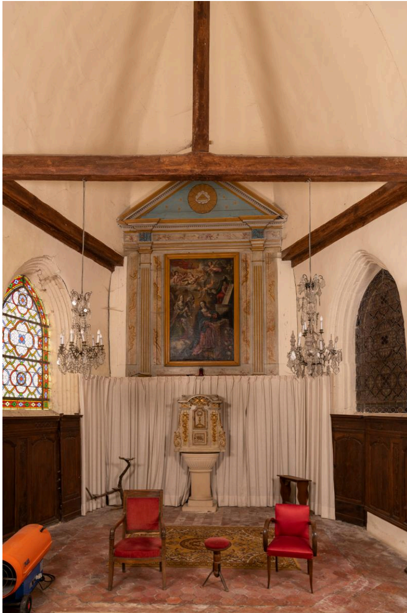
Vue générale du chœur.