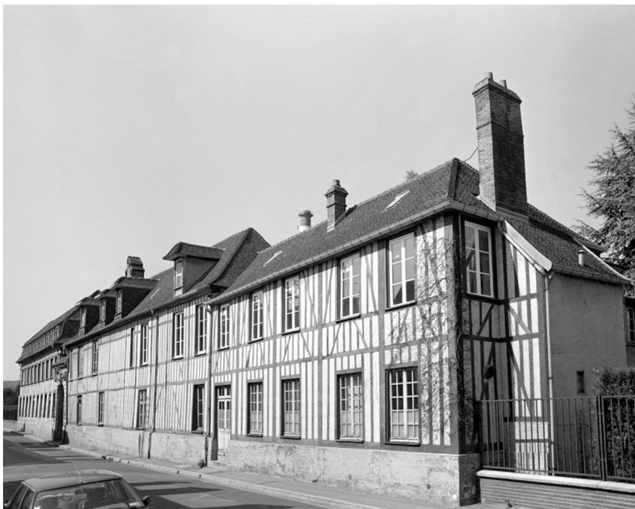
Vue latérale et ouest de la façade sud de la passementerie Gaitas.