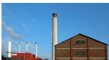
Vue d'ensemble. IVR22_20076000320NUCA