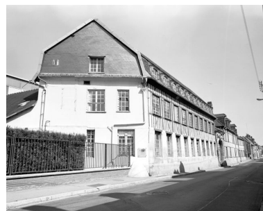
Vue latérale ouest est de la façade sud de la passementerie Gaitas. IVR22_19966002579X