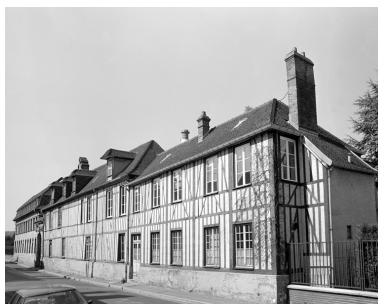
Vue latérale et ouest de la façade sud de la passementerie Gaitas. IVR22_19966002581X