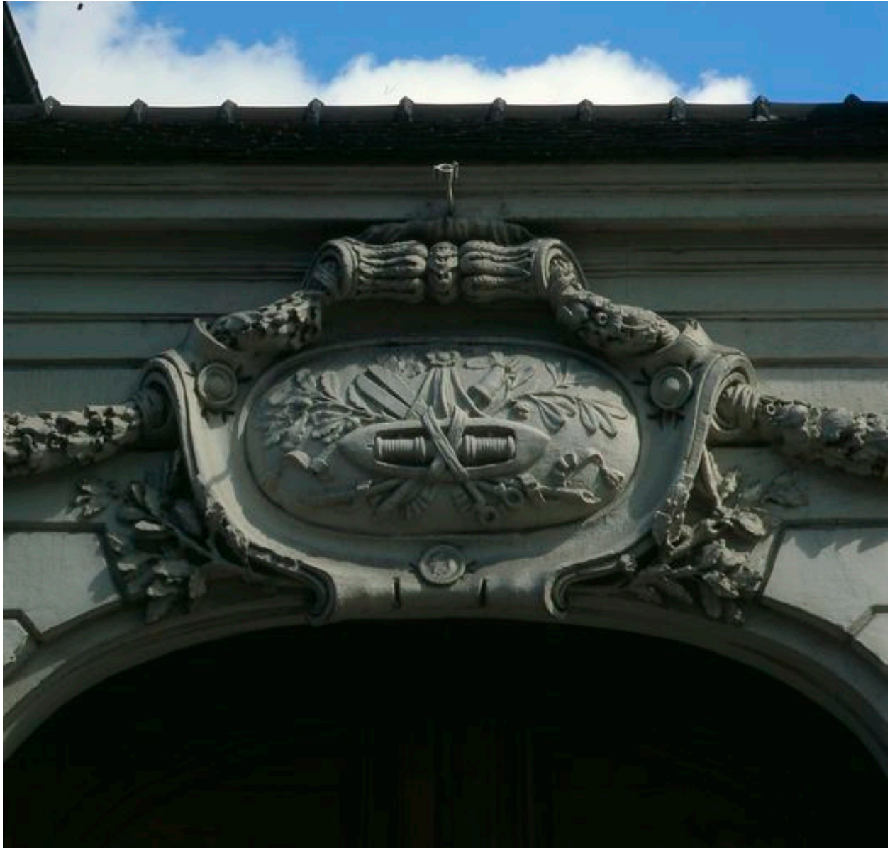
Détail du cartouche orné du portail d'entrée.