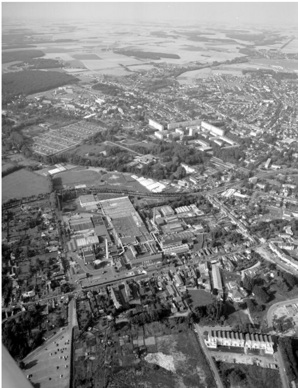
Vue aérienne de l'usine en 1994.