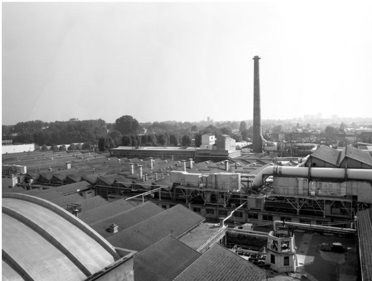
Vue plongeante sur le château d'eau et une partie des ateliers de fabrication construits après l'incendie de 1919.