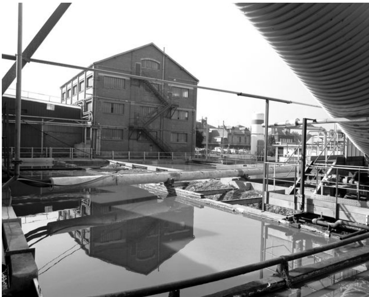
Les bassins de décantation construits dans les années 1920 avec, à l'arrière plan, le bâtiment n°4 datant des mêmes années mais non identifié.