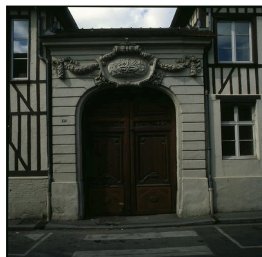
Vue du portail d'entrée.