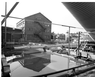
Les bassins de décantation construits dans les années 1920 avec, à l'arrière plan, le bâtiment n°4 datant des mêmes années mais non identifié.