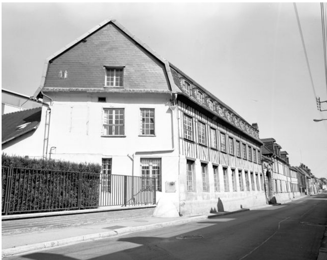
Vue latérale ouest est de la façade sud de la passementerie Gaitas.