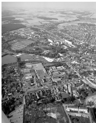
Vue aérienne de l'usine en 1994.