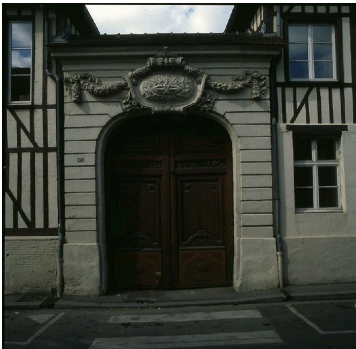
Vue du portail d'entrée.