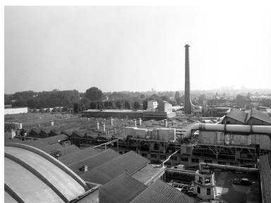
Vue plongeante sur le château d'eau et une partie des ateliers de fabrication construits après l'incendie de 1919.