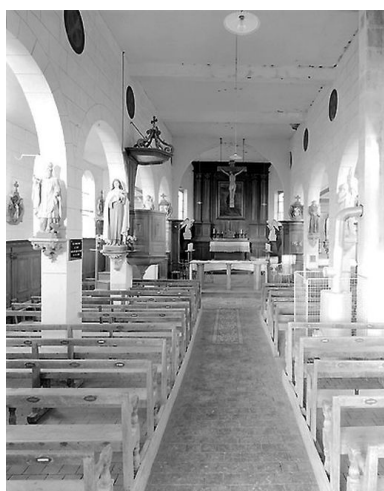
Vue intérieure de la nef vers le chœur. IVR22_19970201740V