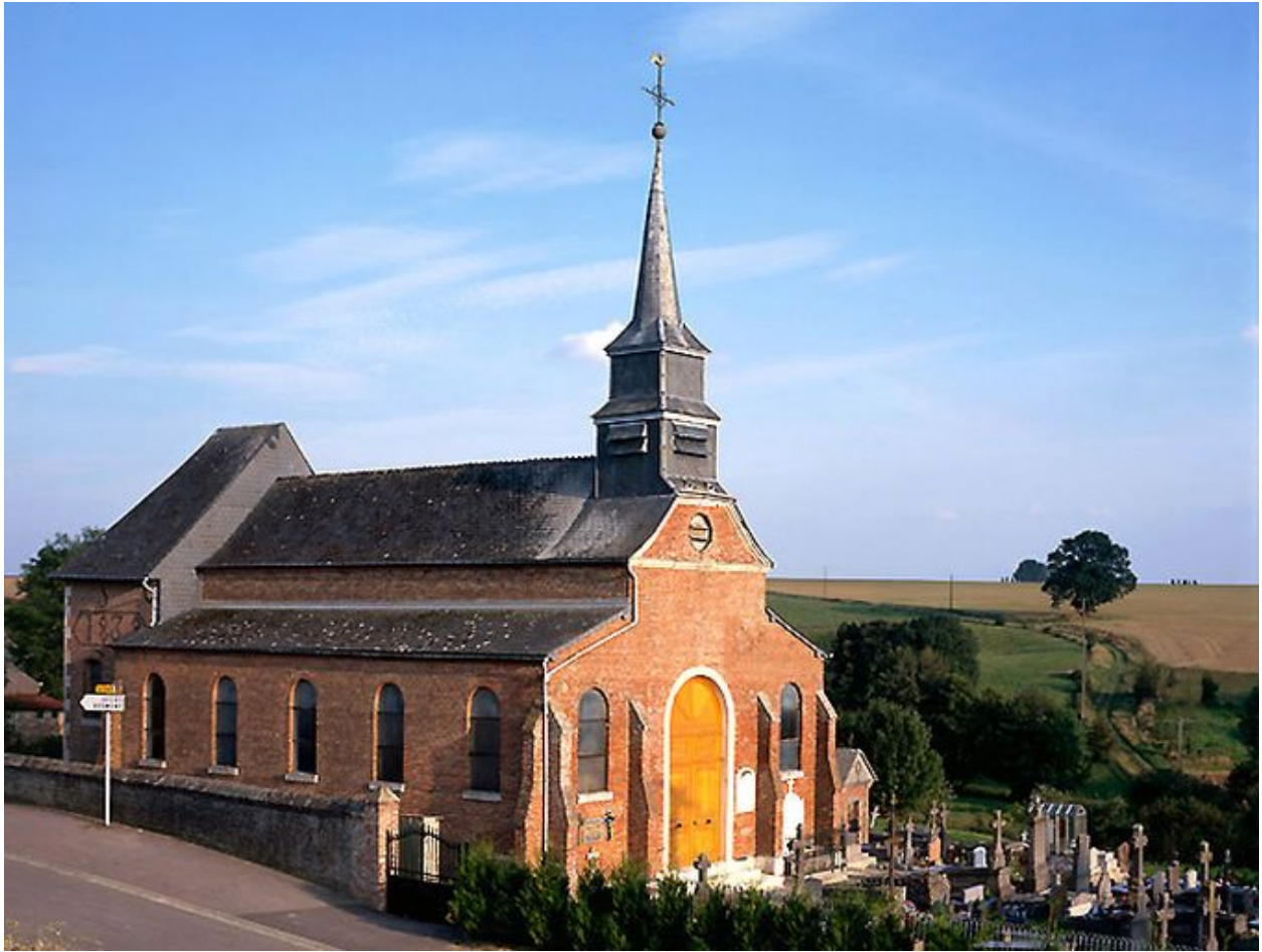
Vue générale depuis le nord-ouest.