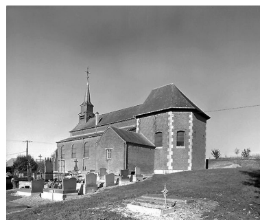
Vue depuis le sud-est. IVR22_19970201880V