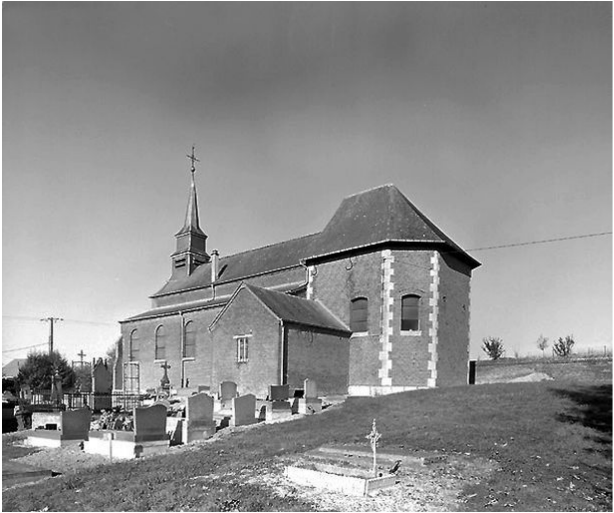
Vue depuis le sud-est.