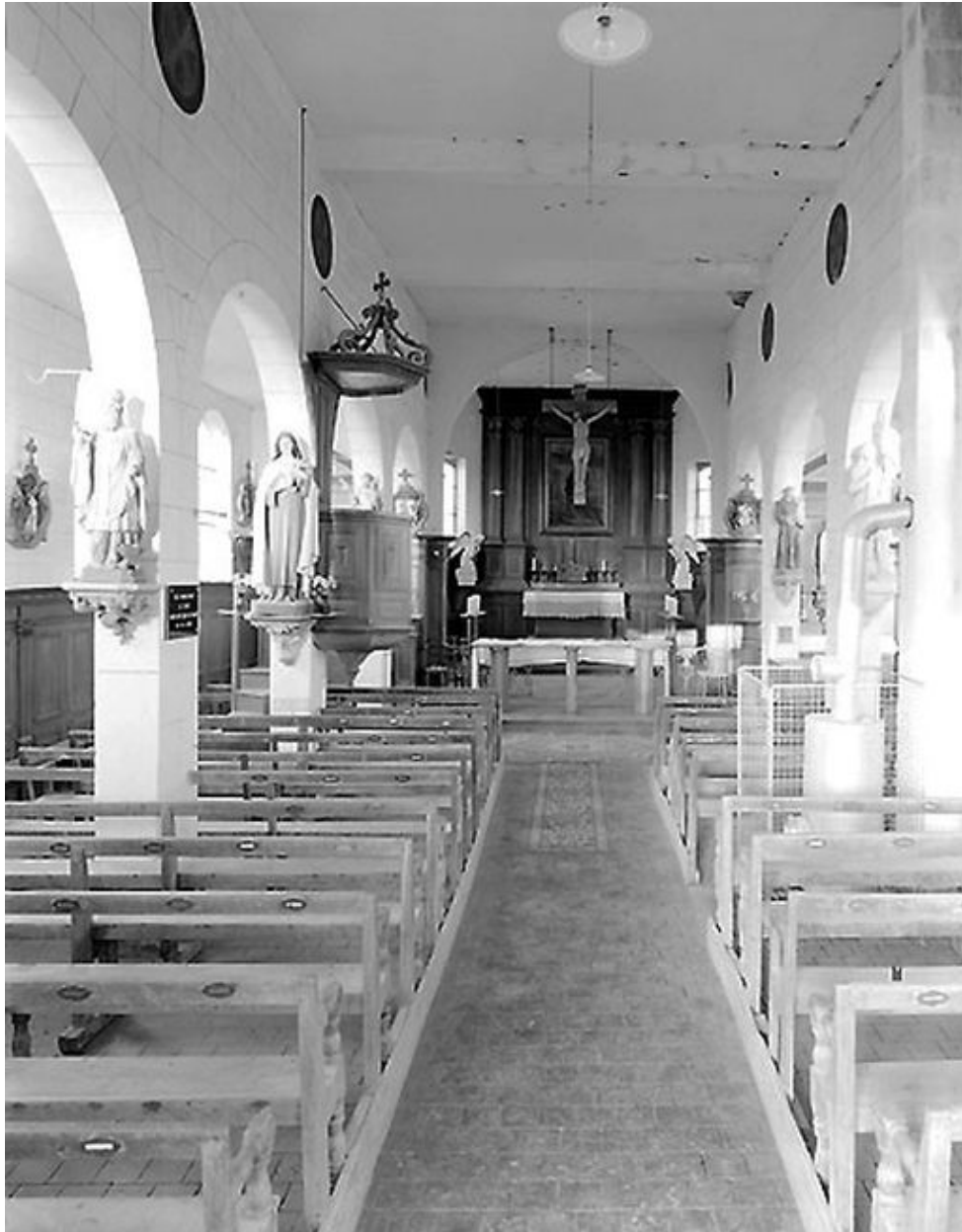
Vue intérieure de la nef vers le chœur.