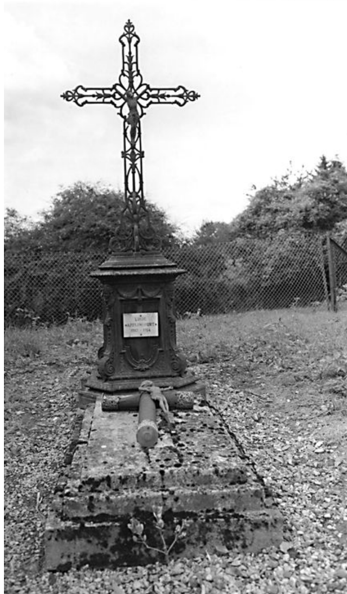
Tombeau de Lucie Applincourt, dans le cimetière. Le socle porte la marque du fabricant Alfred Corneau à Charleville.