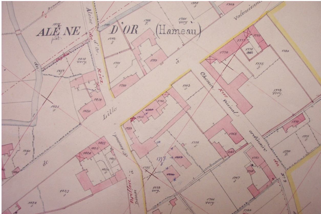
Extrait du cadastre de 1912, 9e feuille (AD Nord : P31/ 624).