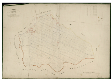
Situation sur le cadastre de 1830 (AD Nord : P31/ 624). IVR31_20055907393NUC