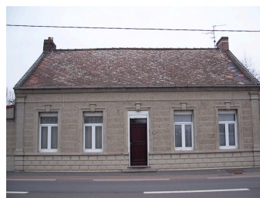
Vue générale du logis. IVR31_20055907320NUCA