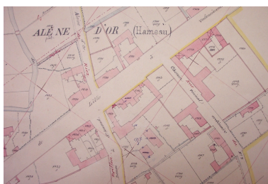
Extrait du cadastre de 1912, 9e feuille (AD Nord : P31/ 624). IVR31_20055907319NUCA