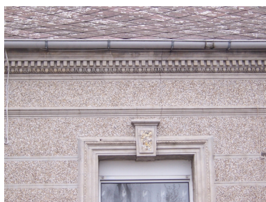
Détail de la façade en gravier roulé. IVR31_20055907321NUCA