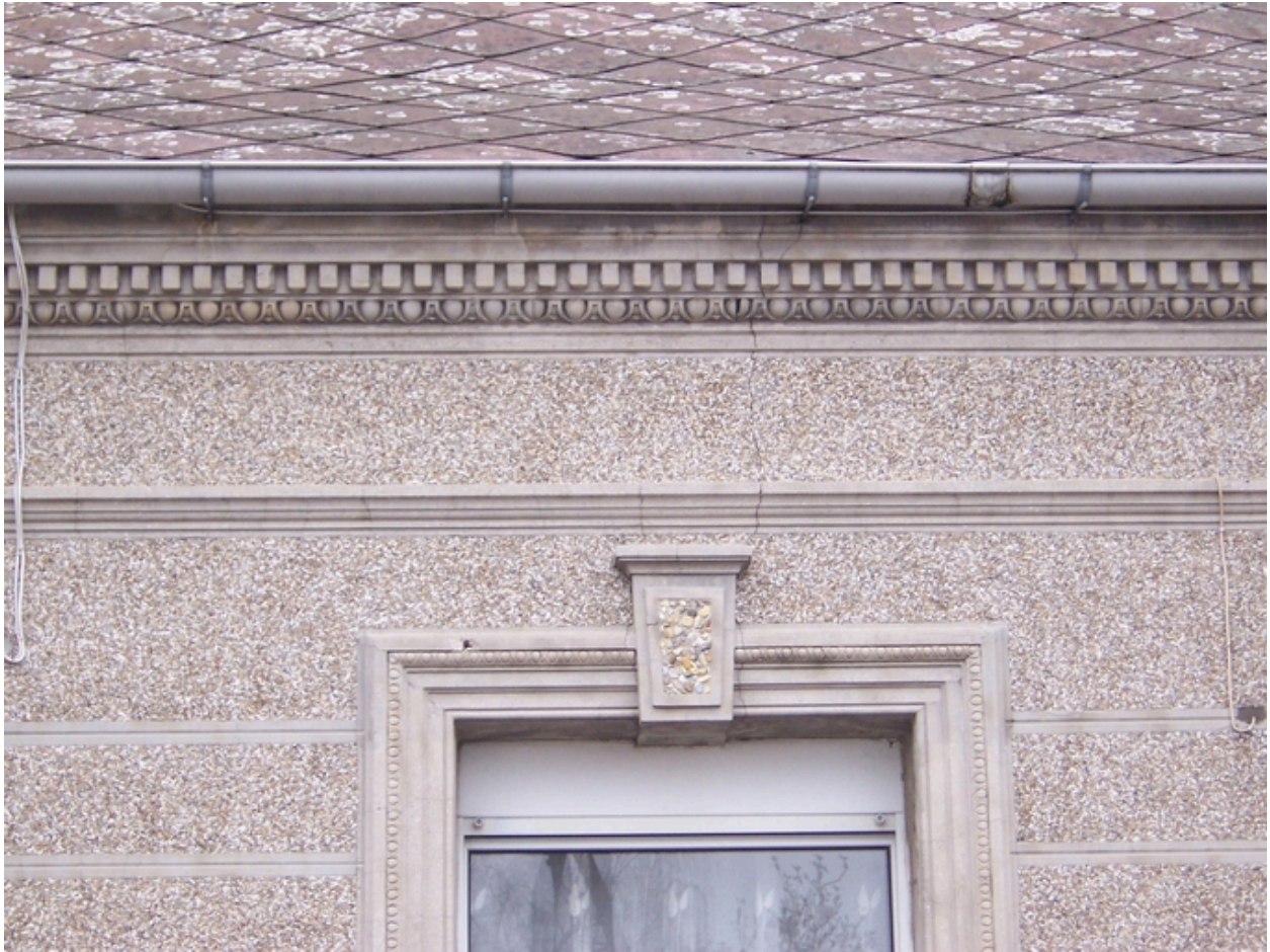
Détail de la façade en gravier roulé.