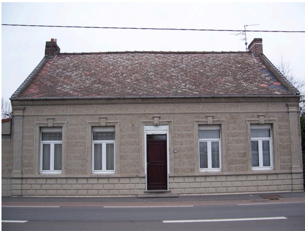
Vue générale du logis.