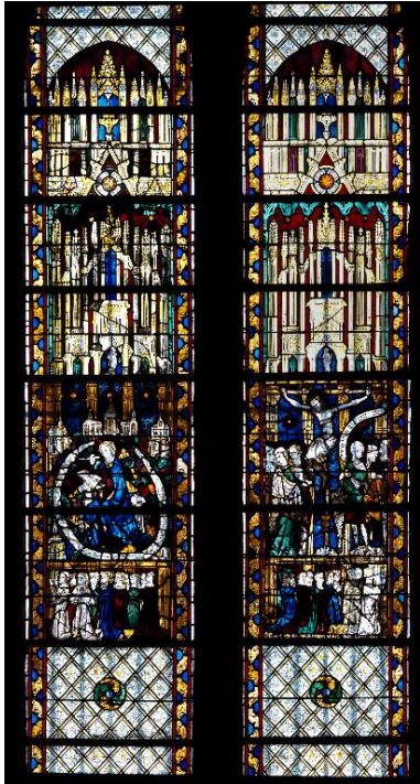
Vue d'ensemble. IVR22_19996001589VA