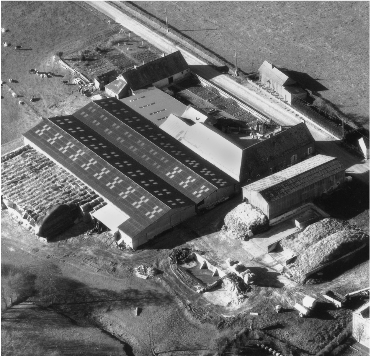
Vue aérienne de la ferme depuis l'est.