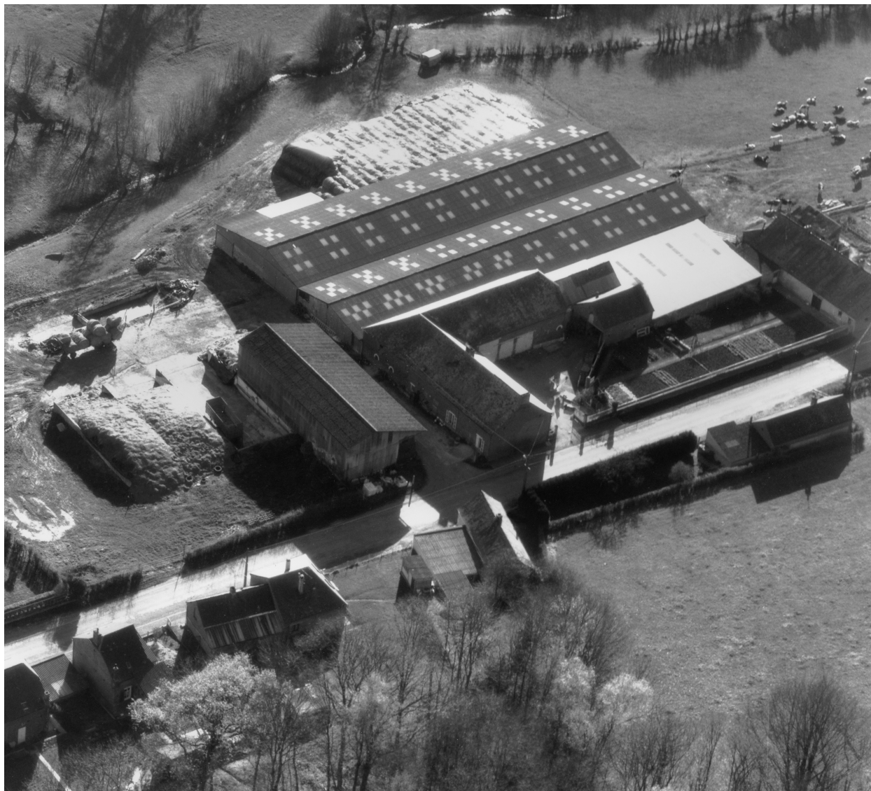
Vue aérienne de la ferme depuis le nord.