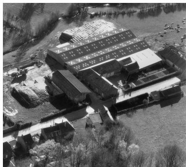
Vue aérienne de la ferme depuis le nord.