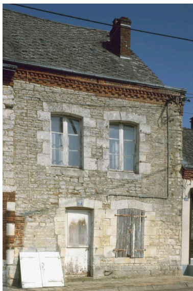
Élévation sur rue. IVR22_19990200917XA