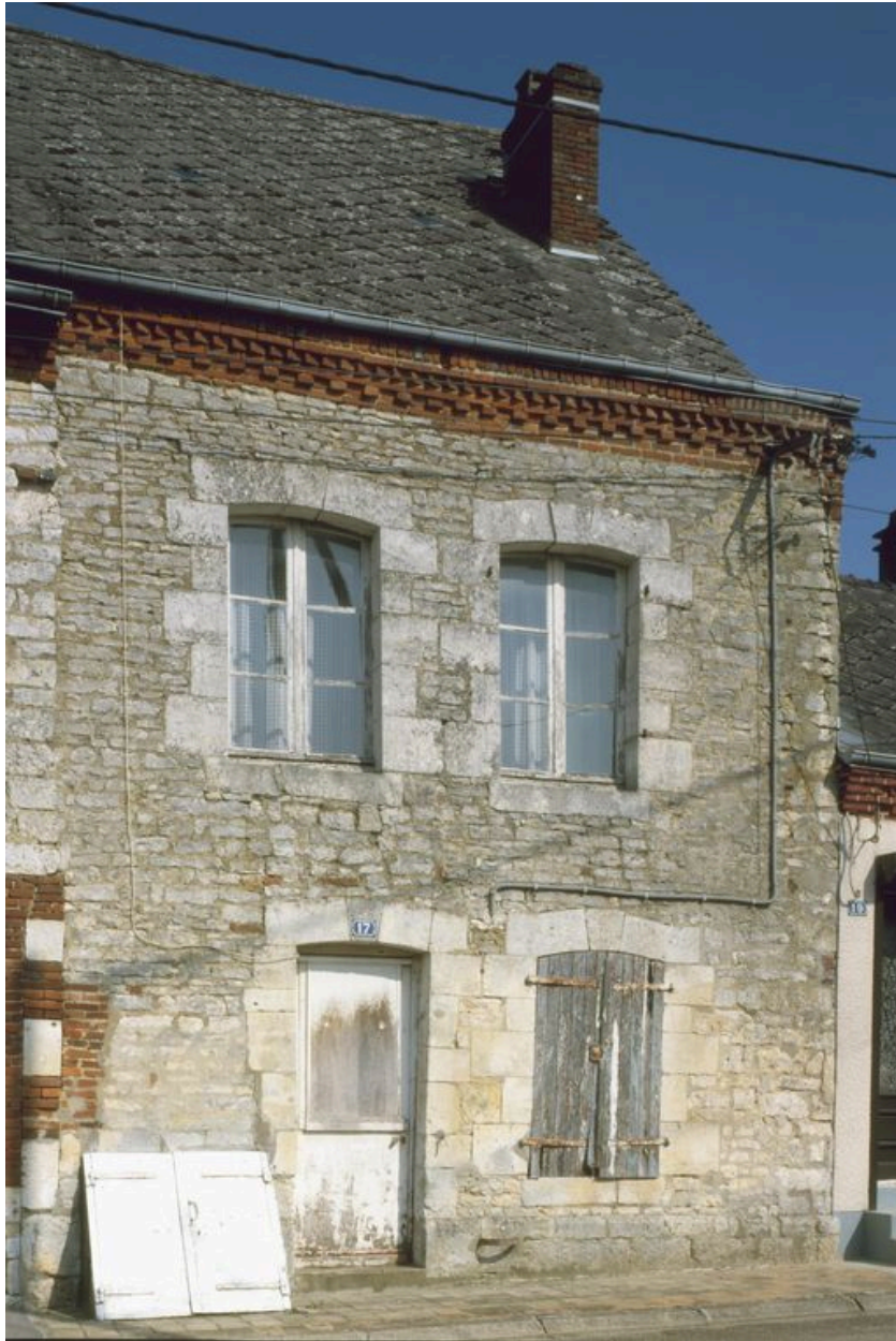
Elévation sur rue.