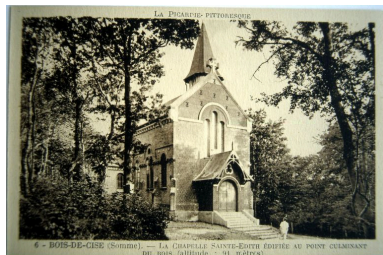
Carte postale, 1er quart 20e siècle. IVR22_20058000568XAB