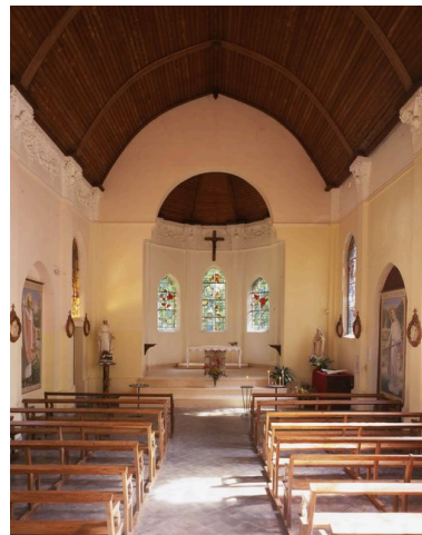
Vue de la nef. IVR22_20048000147VA