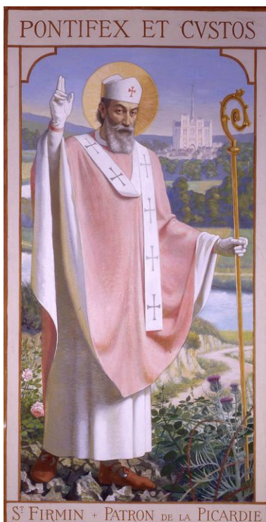
Saint Firmin, huile sur toile, par Léopold Delbeke, 1924.