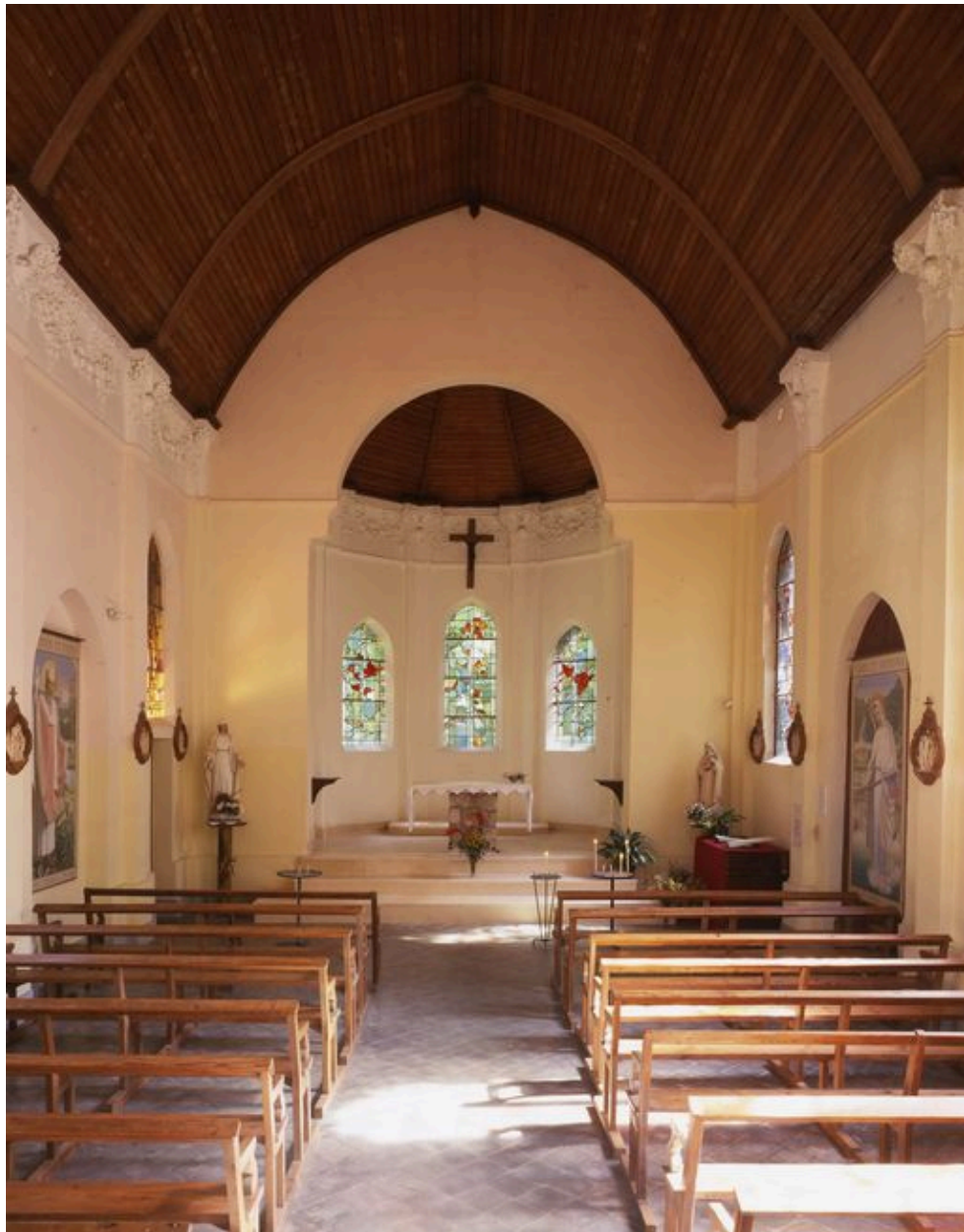
Vue de la nef.