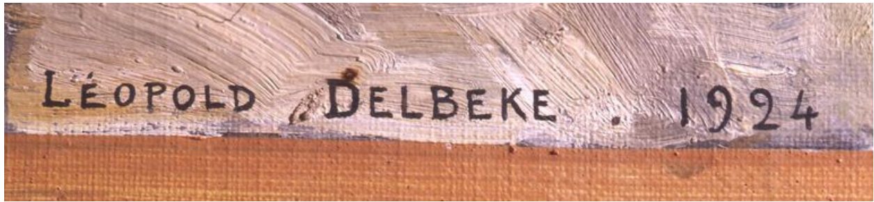
Détail de la signature portée sur la toile représentant Saint-Firmin.