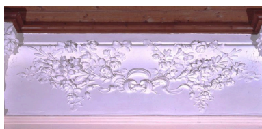
Détail du décor de la nef.