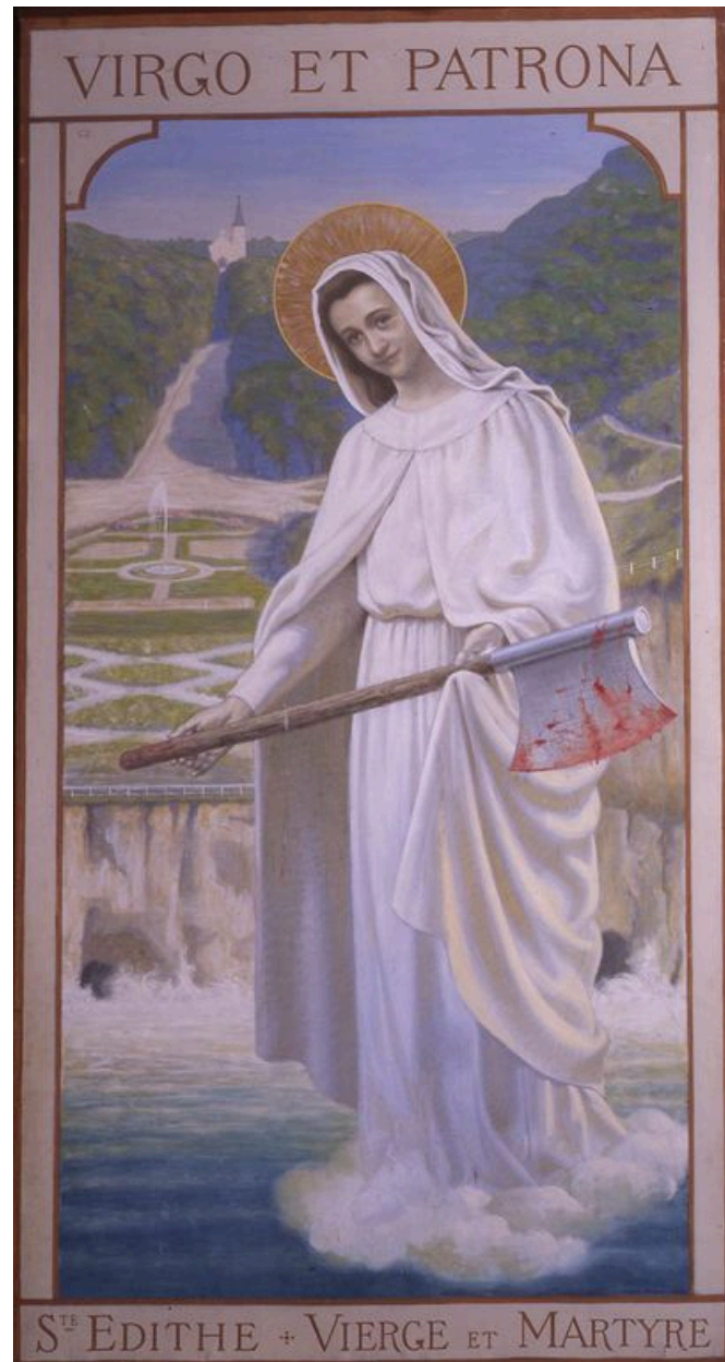
Sainte Edith, huile sur toile, par Léopold Delbeke, 1924.