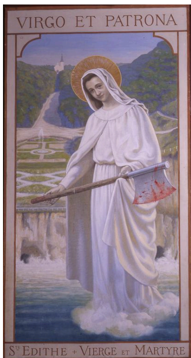
Sainte Edith, huile sur toile, par Léopold Delbeke, 1924.