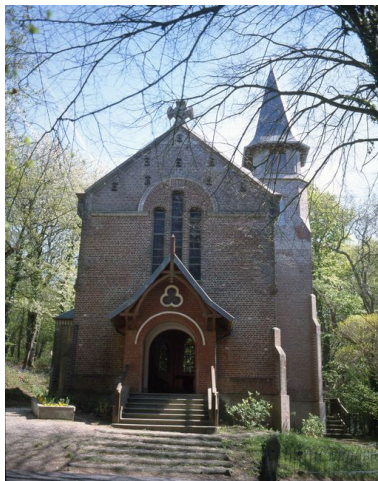
Vue d'ensemble. IVR22_20048000030XA