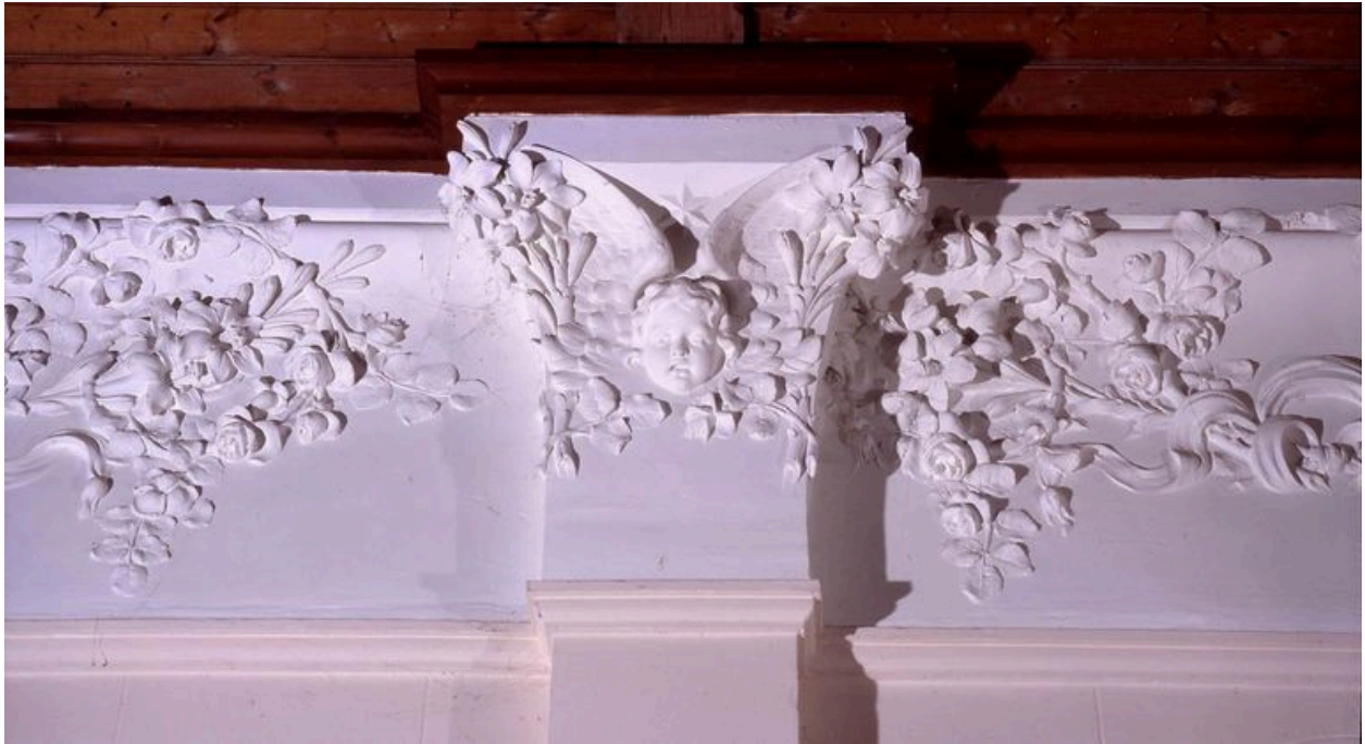
Détail du décor de la nef.