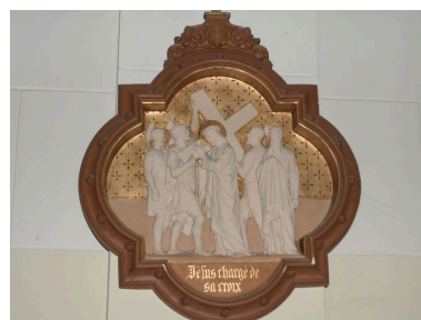
Détail d'une scène du chemin de croix.