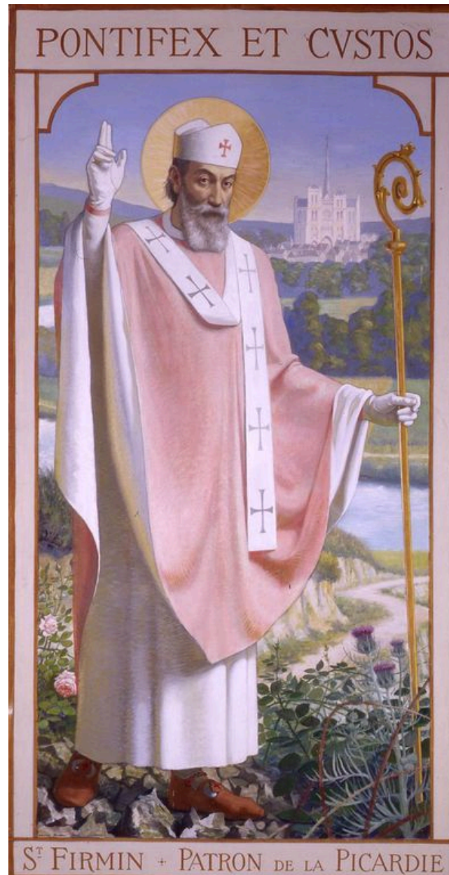
Saint Firmin, huile sur toile, par Léopold Delbeke, 1924.