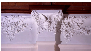
Détail du décor de la nef. IVR22_20048000151XA