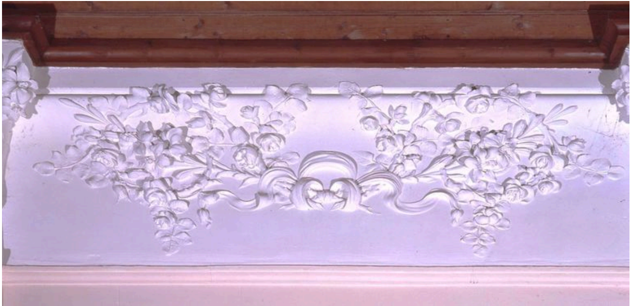
Détail du décor de la nef.