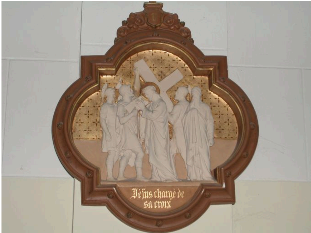
Détail d'une scène du chemin de croix.