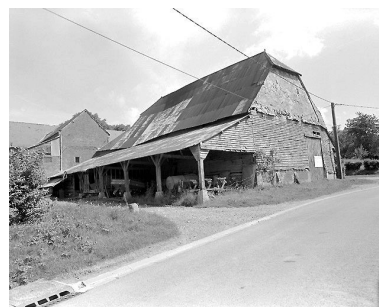
Grange depuis le sud-ouest.