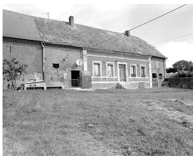
Logis de la ferme.