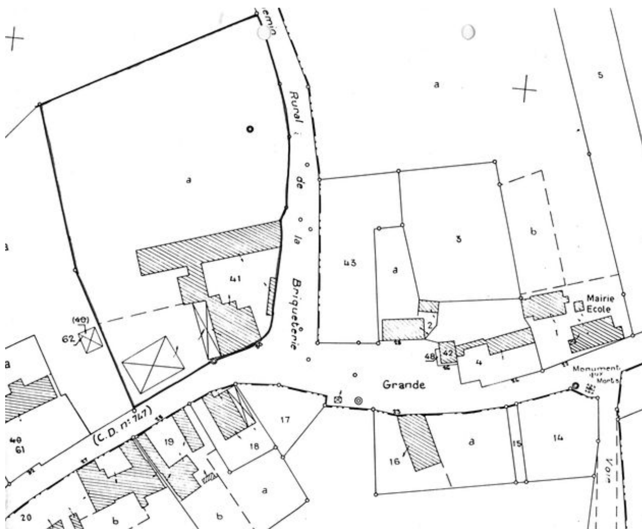
Plan de situation. Extrait du plan cadastre de 1986, section ZB.