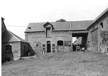
Etable à chevaux et poulailler, laiterie.