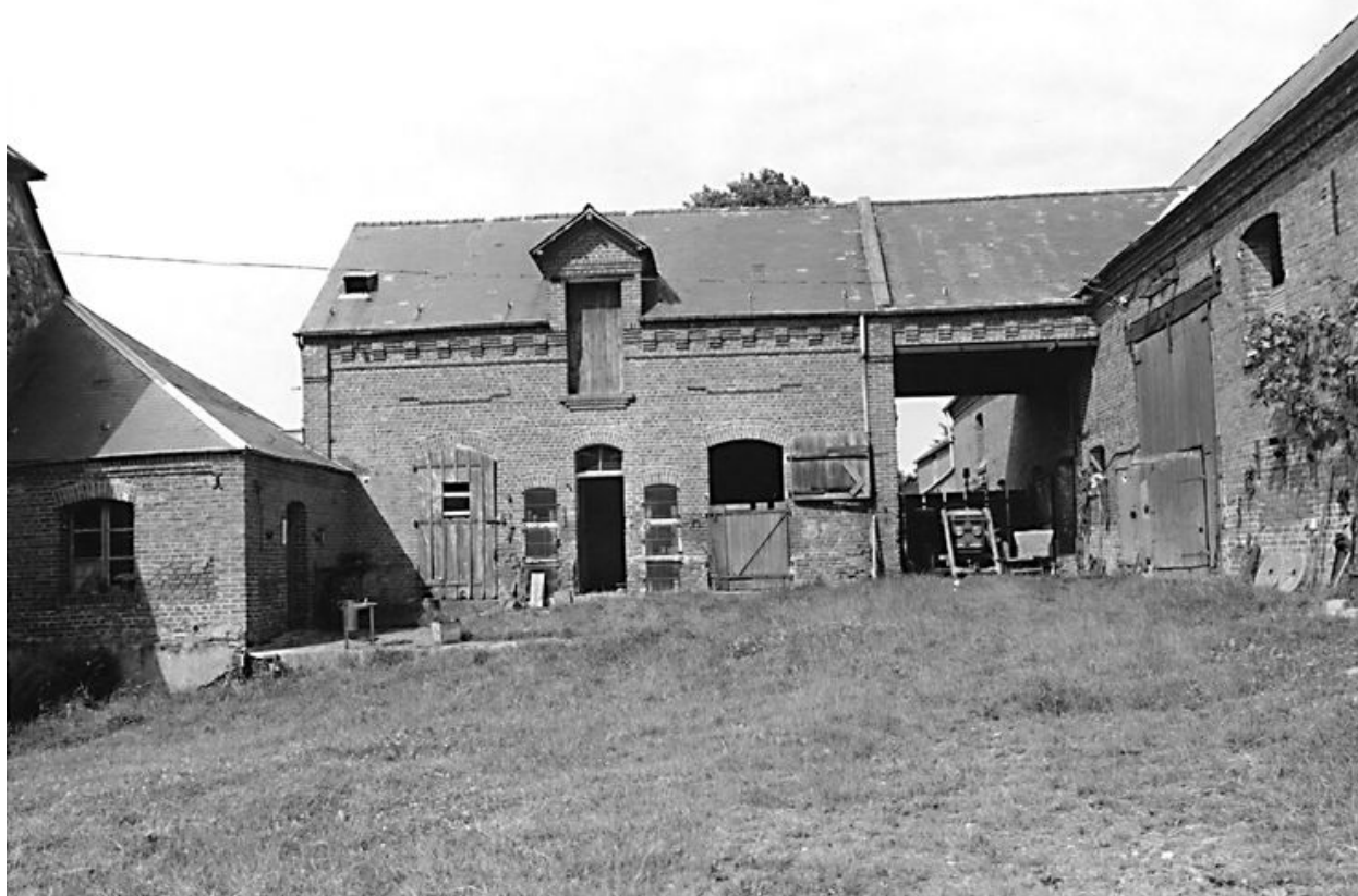
Etable à chevaux et poulailler, laiterie.