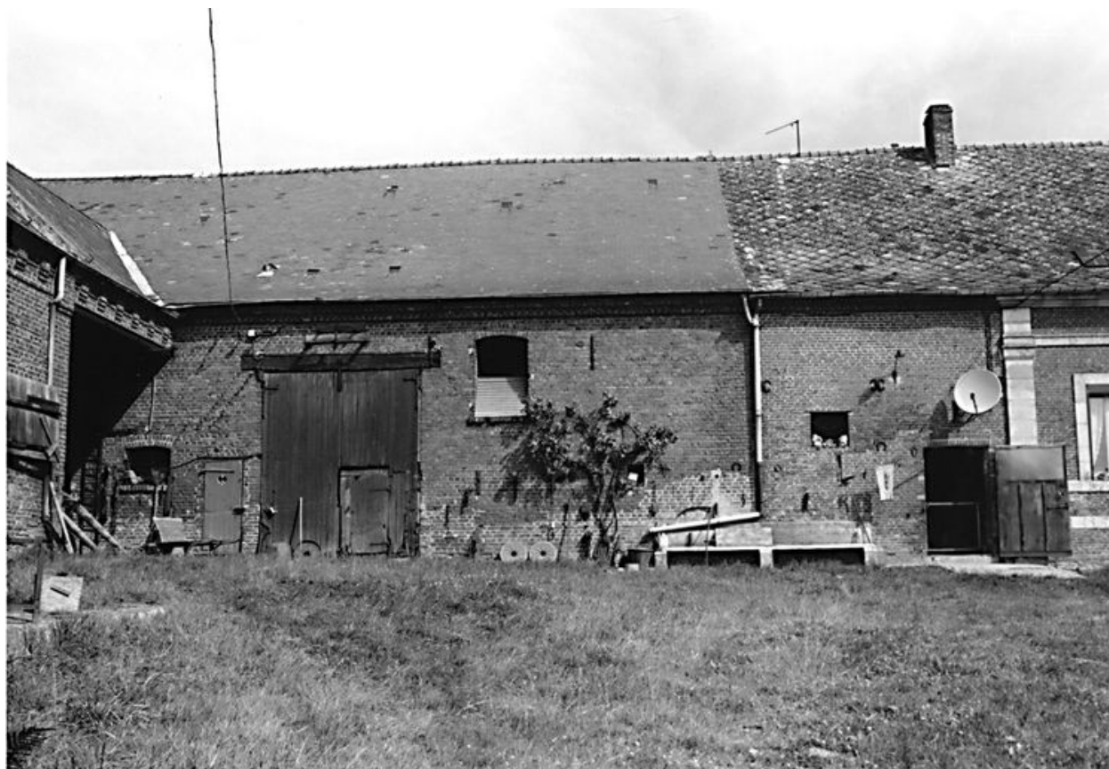
Etable à vaches et à chevaux attenante au logis.