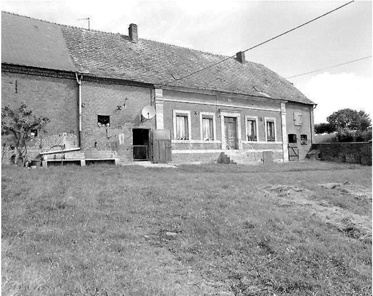
Logis de la ferme.