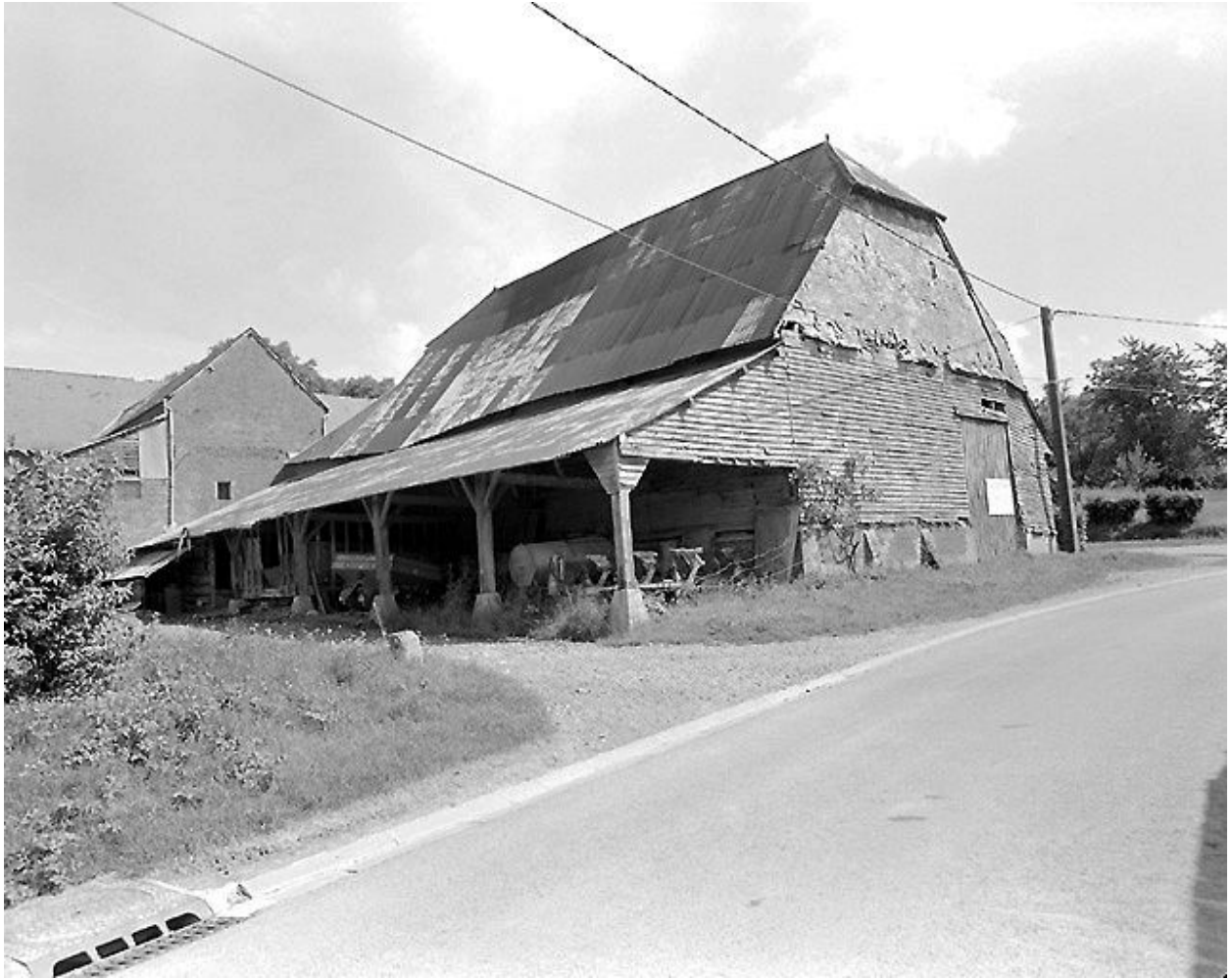
Grange depuis le sud-ouest.