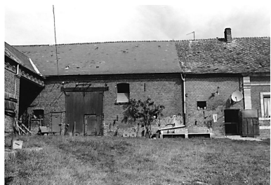
Etable à vaches et à chevaux attenante au logis.