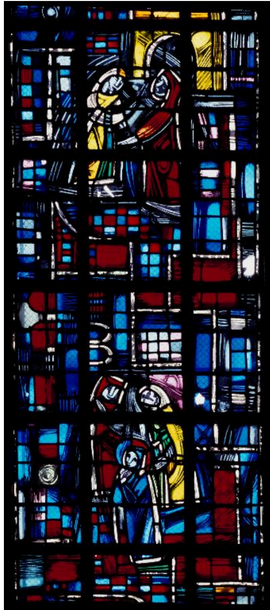
Détail de la lancette gauche de la verrière centrale (baie 5).