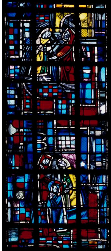
Détail de la lancette gauche de la verrière centrale (baie 5). IVR22_19996001730XA