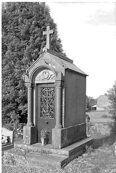
Vue générale. IVR22_19980200987X