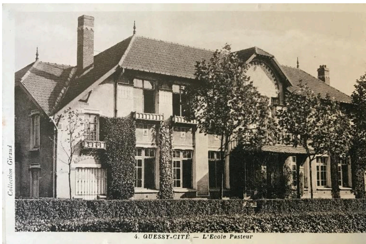
L'école Pasteur, carte postale vers 1930.