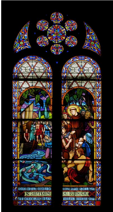
Vue générale. IVR22_20058001915NUCA