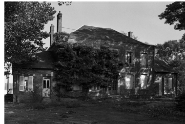
Logement patronal. IVR22_19908001083Z