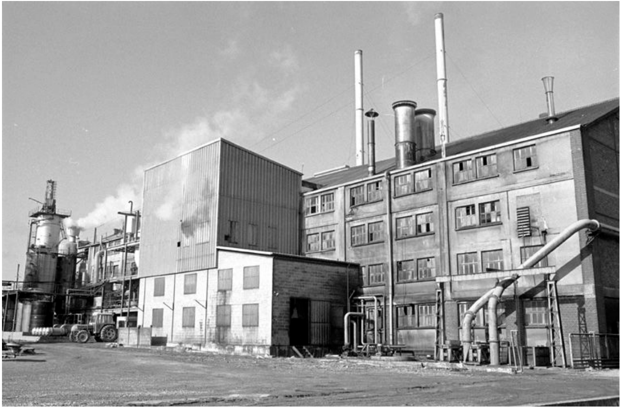
Atelier de fabrication.