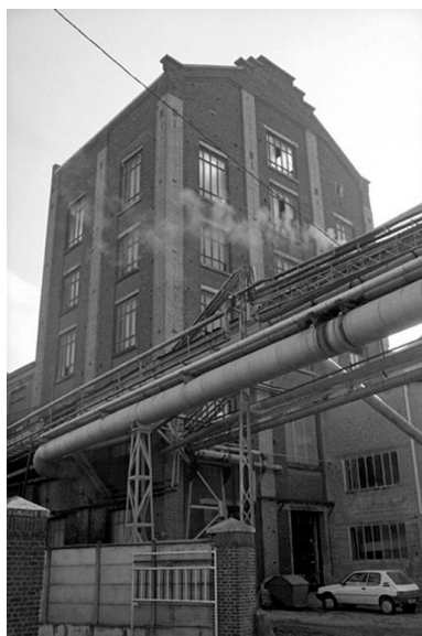
Atelier de fabrication, flanc ouest. IVR22_19908001086Z