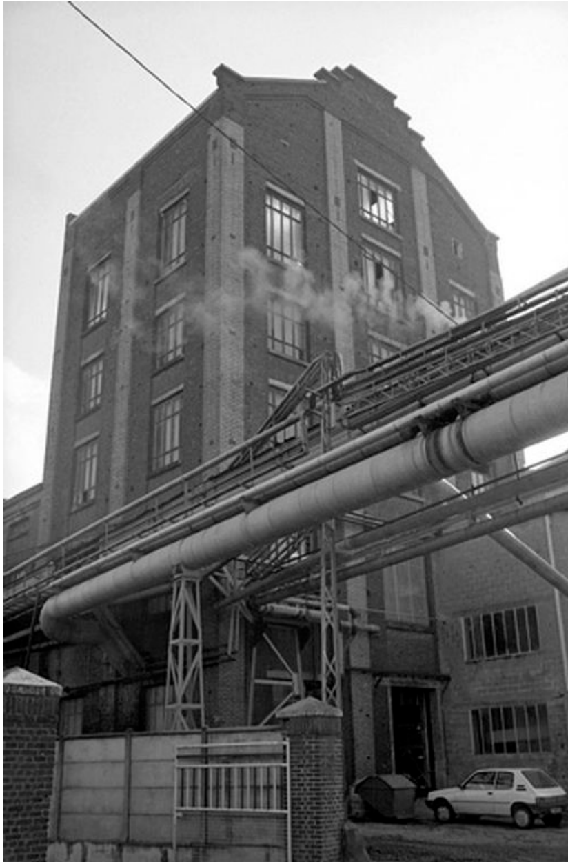
Atelier de fabrication, flanc ouest.