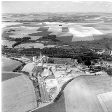
Vue aérienne, flanc sud-ouest.

Schéma de situation : A. Atelier, B. Atelier, C. Logement patronal.