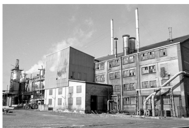
Atelier de fabrication.