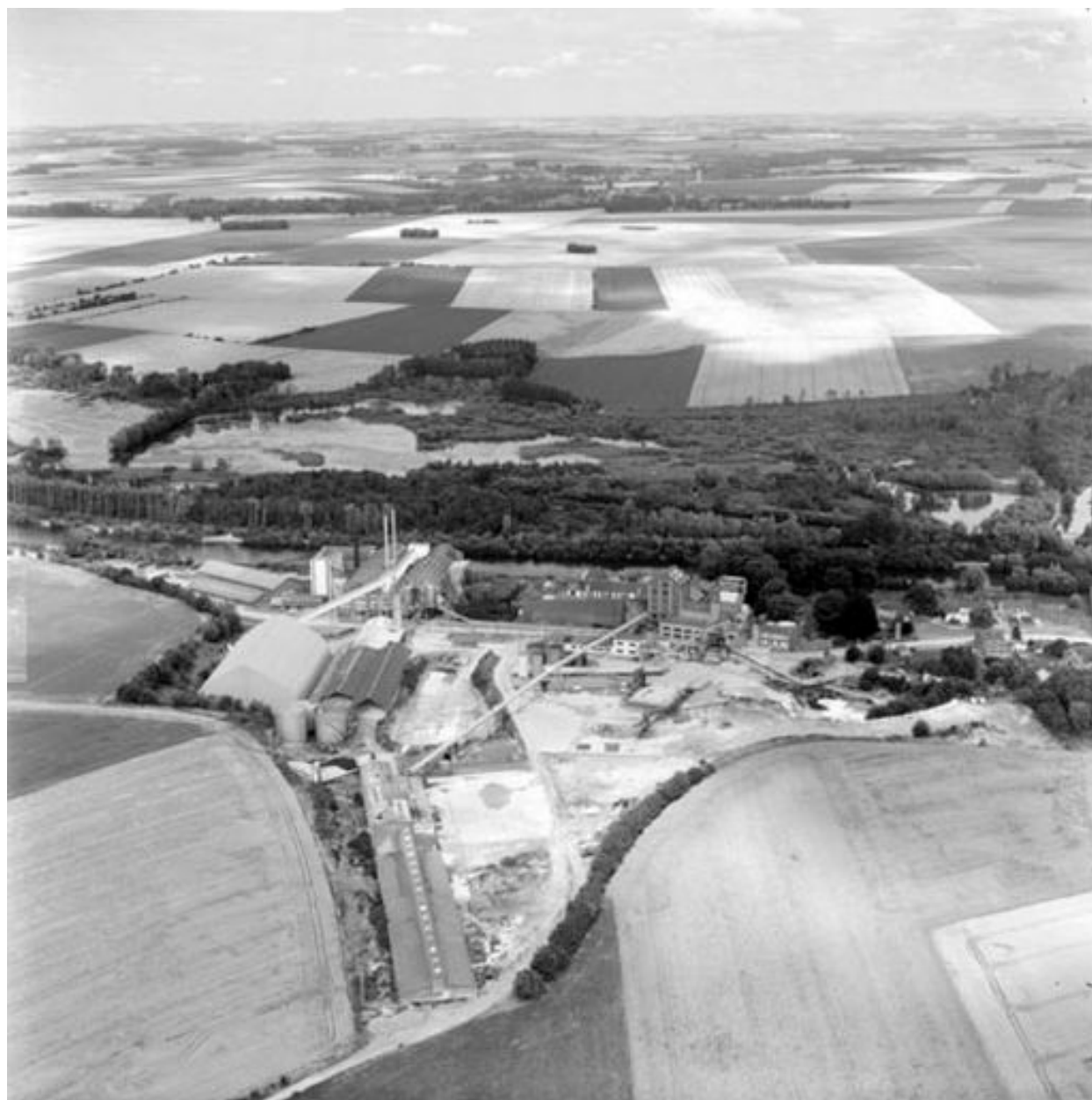
Vue aérienne, flanc sud-ouest.