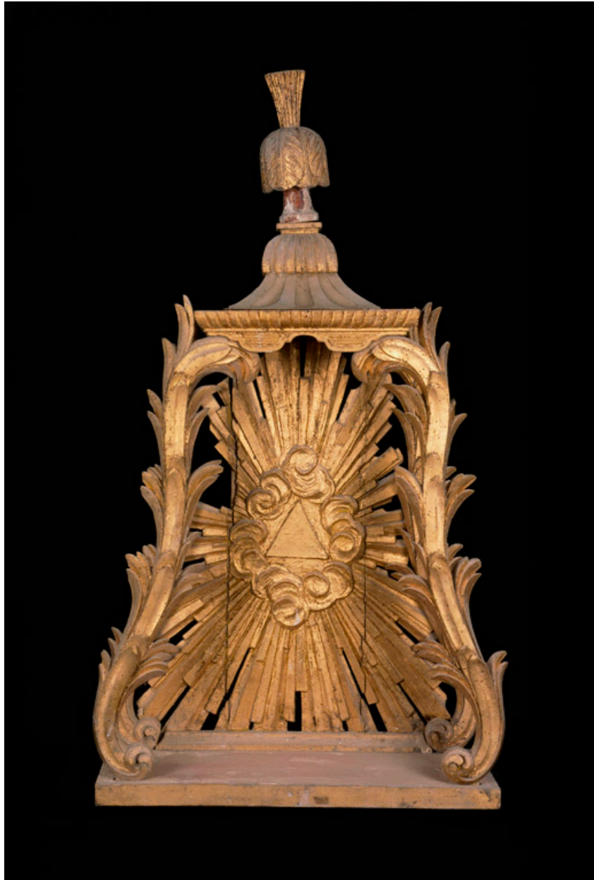
Dais d'exposition installé sur le tabernacle de la chapelle sud.