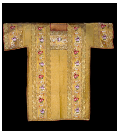
Un des deux dalmatiques en drap d'or, ornés de fleurs brochées.