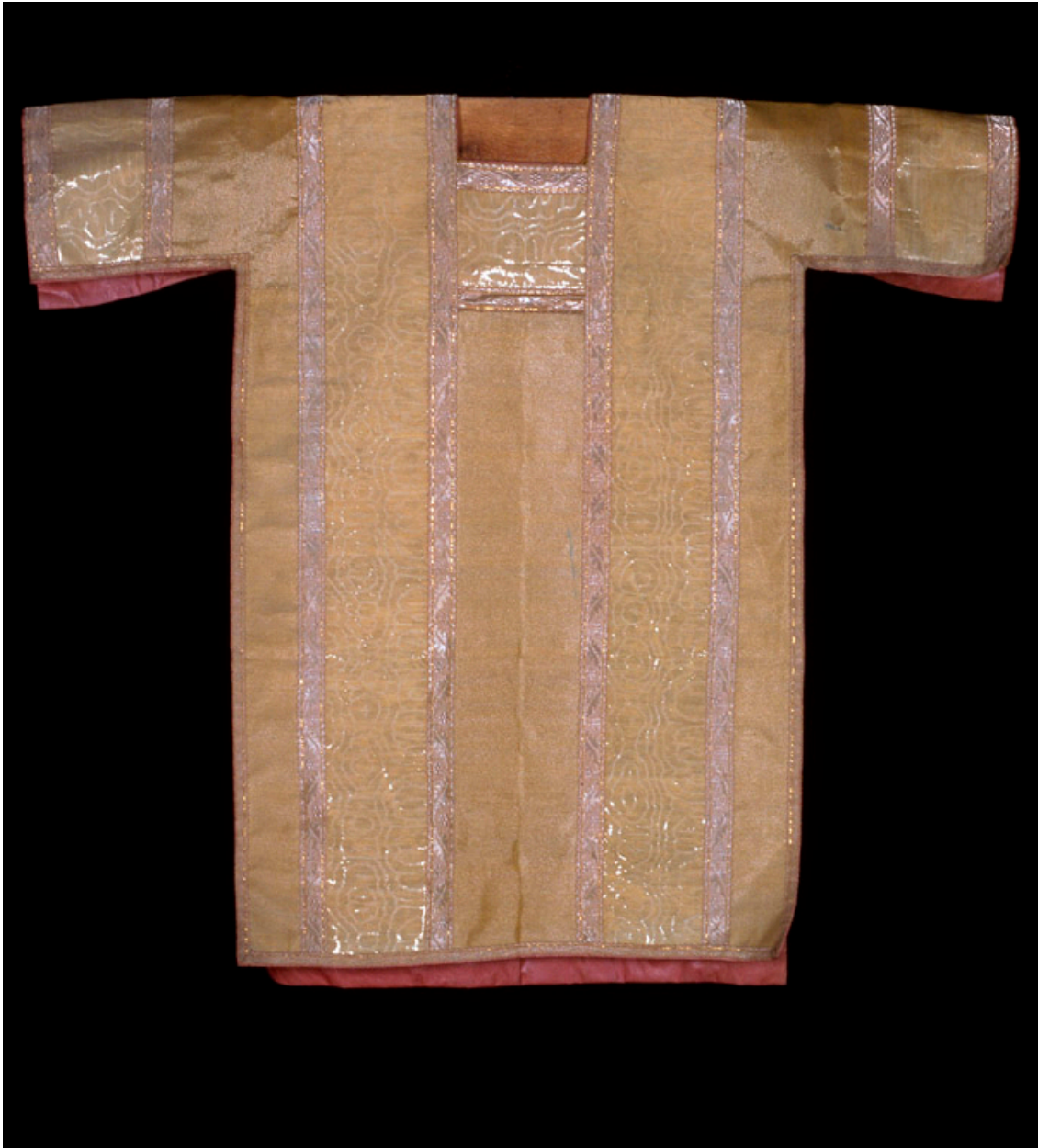
Un des deux dalmatiques en drap d'or, ornés d'un drap d'or moiré.