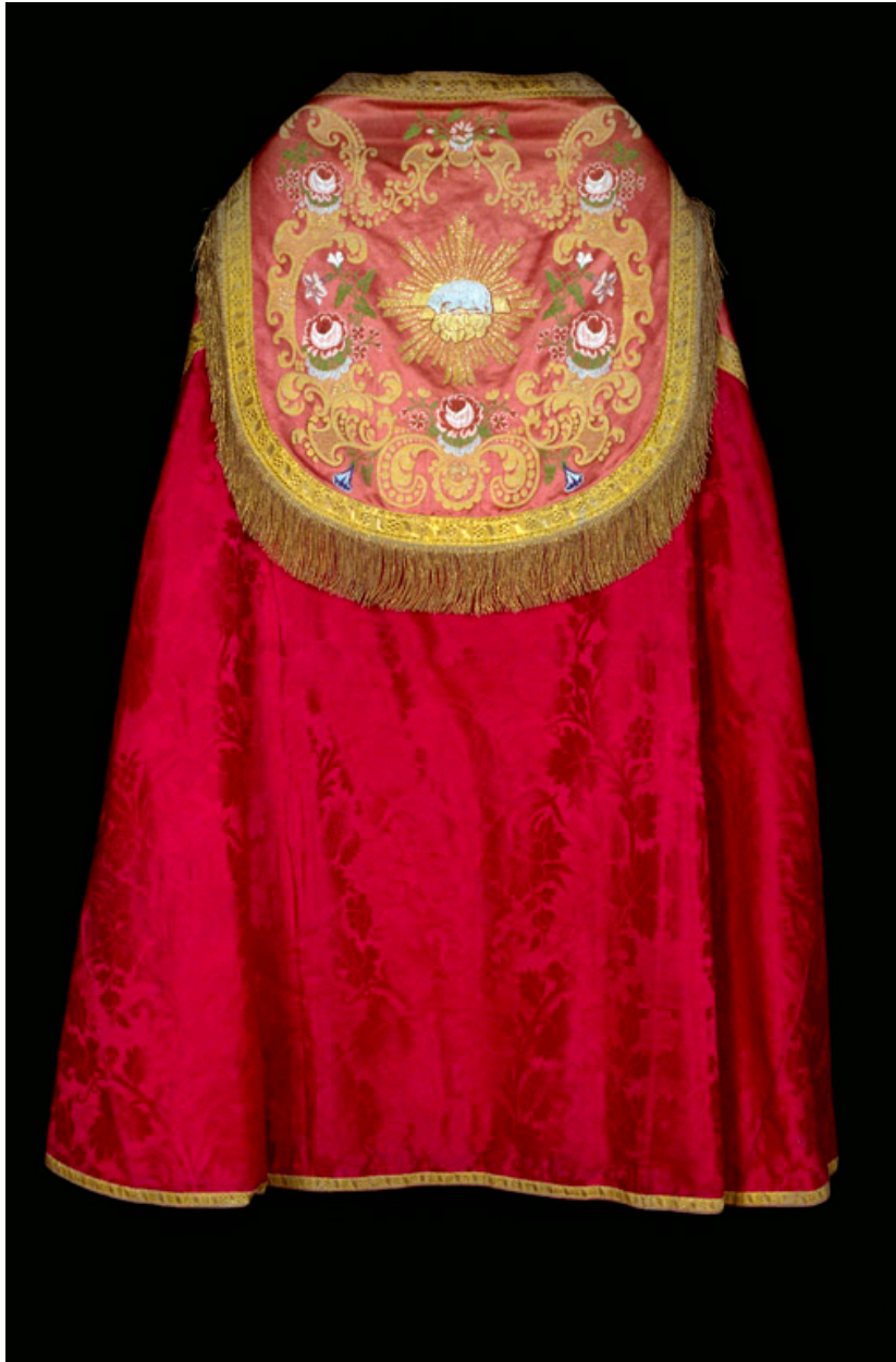
Une des chapes en damas rouge, d'un ensemble de trois.