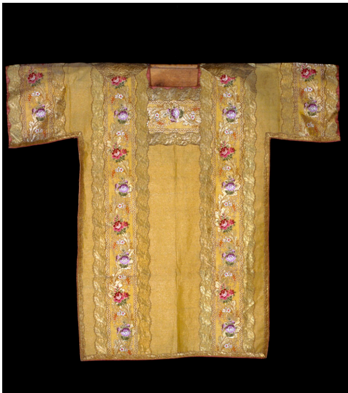
Un des deux dalmatiques en drap d'or, ornés de fleurs brochées.