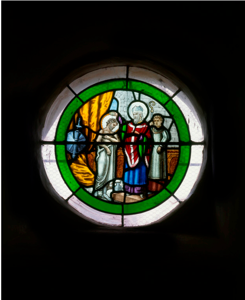
Baie 9 : Baptême de Clovis.