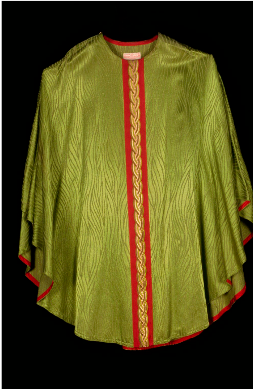
Chasuble verte de forme gothique, J. Vanpoulle à Cambrai.