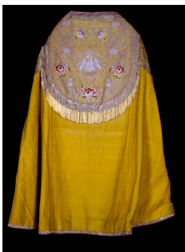
Une des chapes en drap d'or, d'un ensemble de trois.