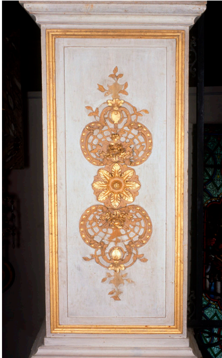
Détail d'un pilier en bois doré peint et doré à l'entrée de l'abside.