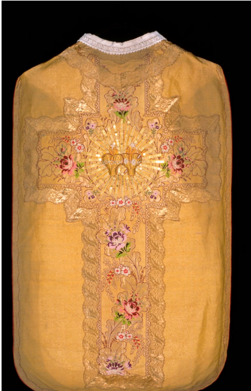
Chasuble en drap d'or, avec décor en tissu façonné à motifs floraux.