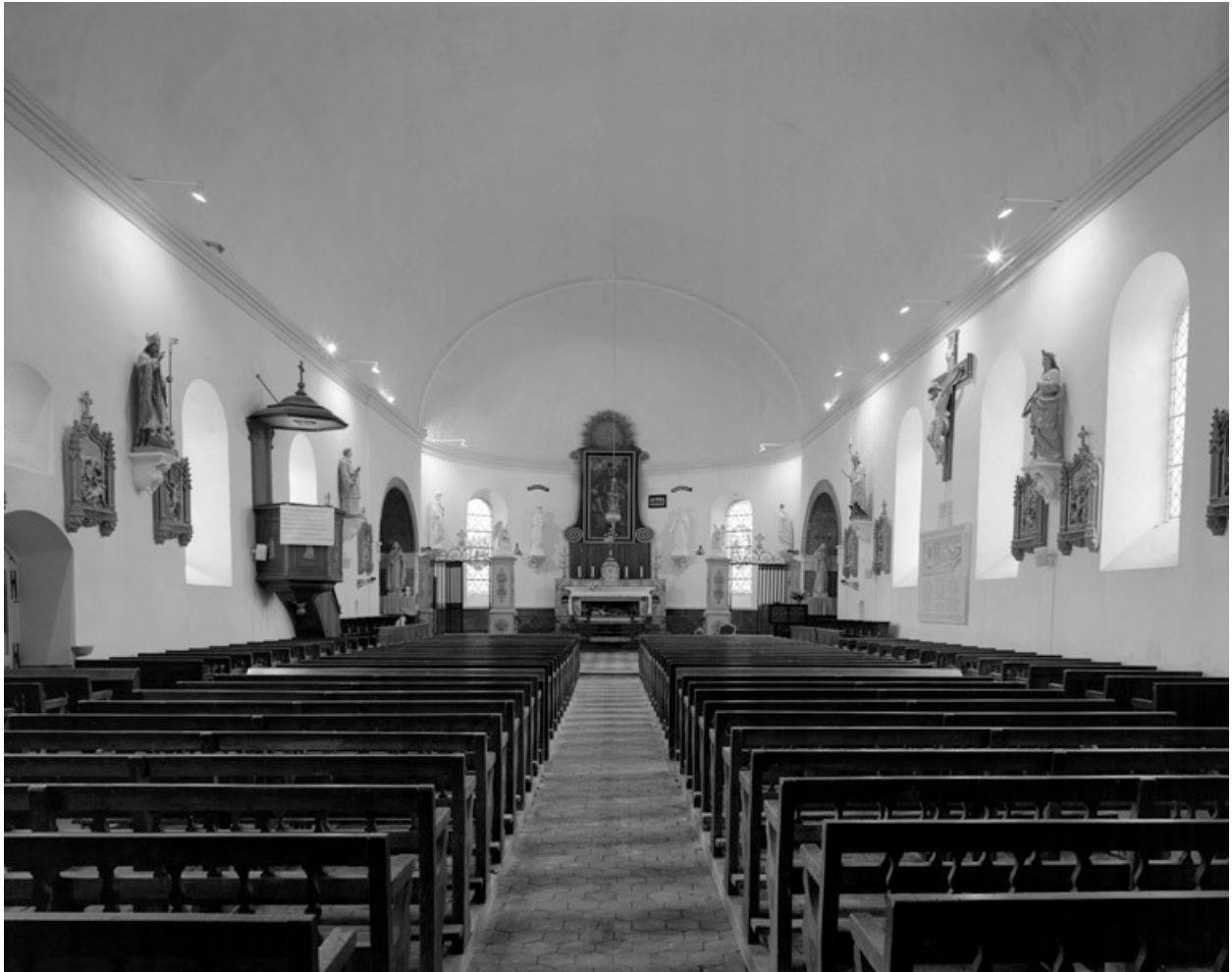
Vue intérieure, vers le chœur.