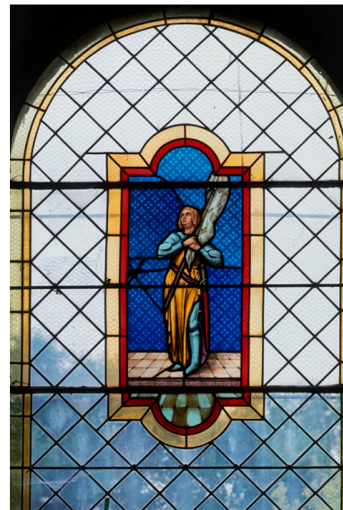
Baie 7 : Jeanne d'Arc.