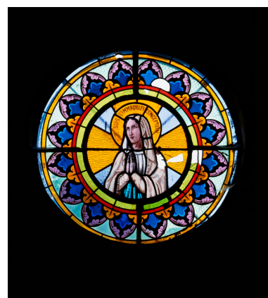
Oculus de la chapelle sud : Immaculée Conception.