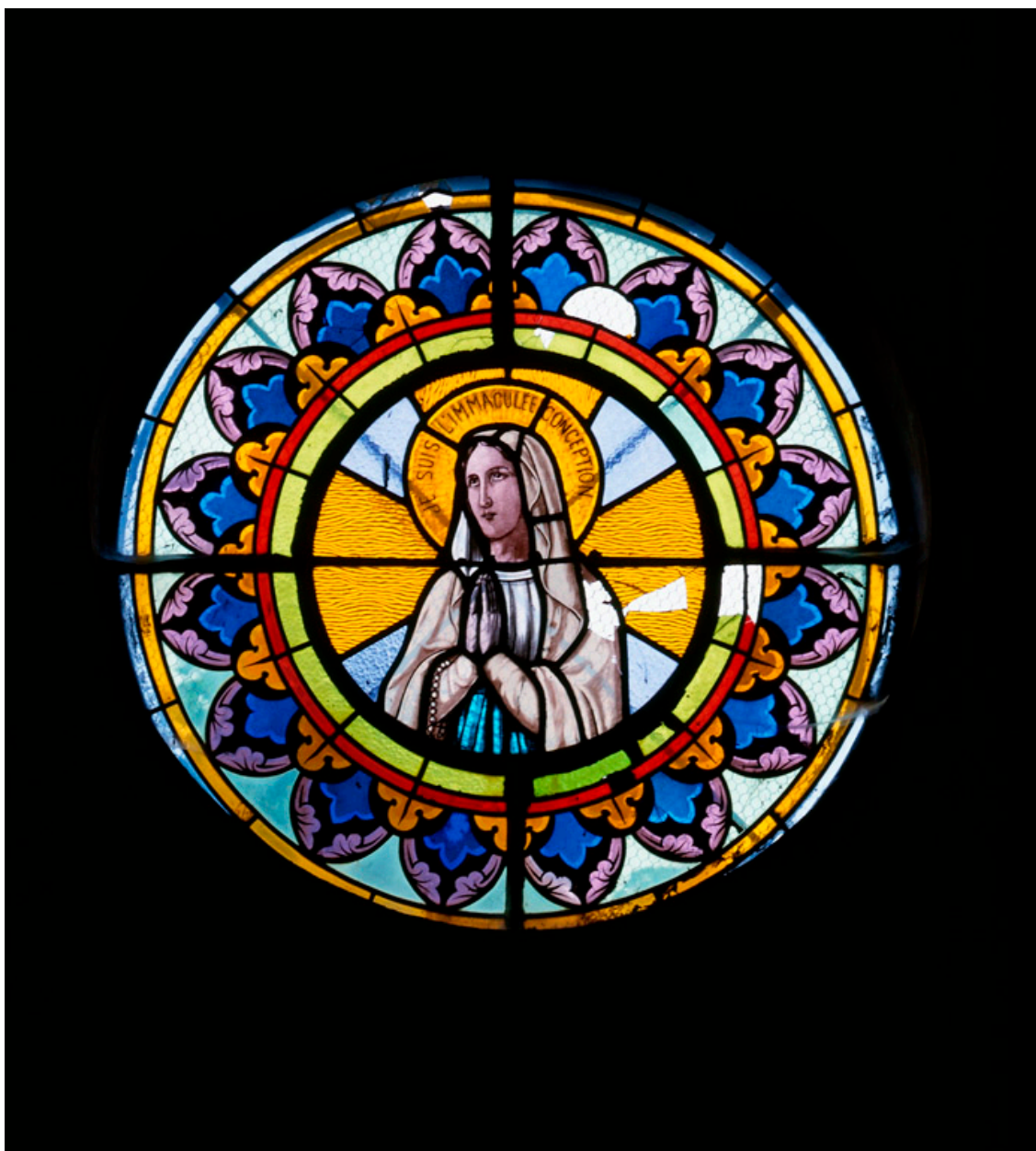
Oculus de la chapelle sud : Immaculée COncption.