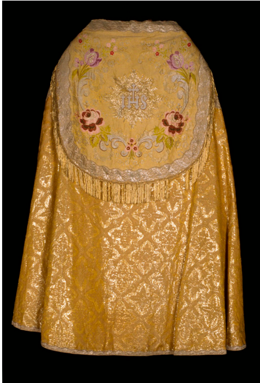
Chape en damas de fil d'or et soie jaune.