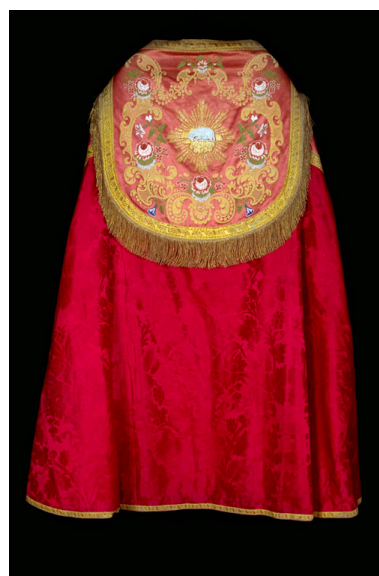
Une des chapes en damas rouge, d'un ensemble de trois. IVR22_19998001271ZA