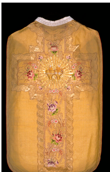
Chasuble en drap d'or, avec décor en tissu façonné à motifs floraux. IVR22_19998001212ZA