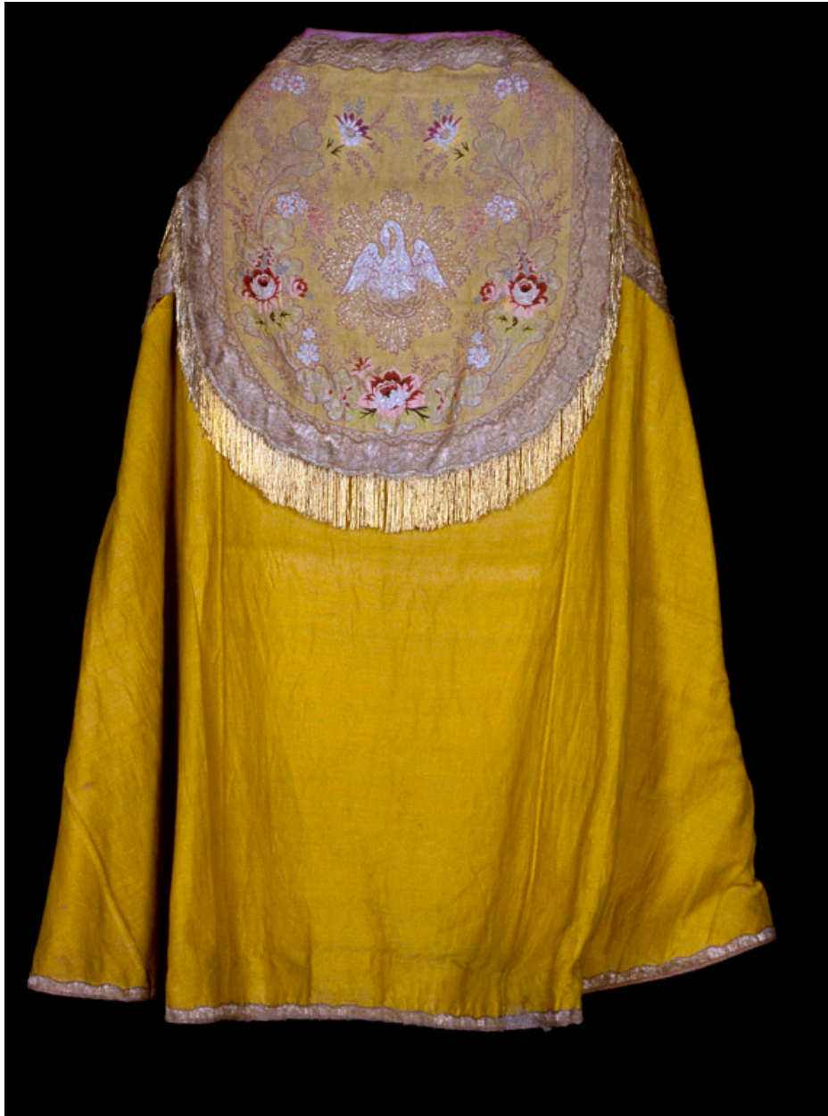
Une des chapes en drap d'or, d'un ensemble de trois.