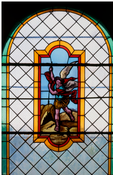
Baie 5 : saint Michel. IVR22_19998001258XA