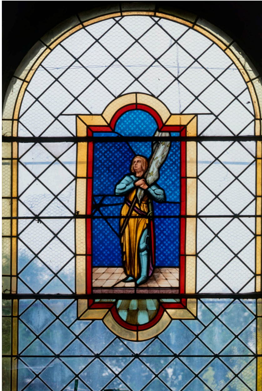
Baie 7 : Jeanne d'Arc.