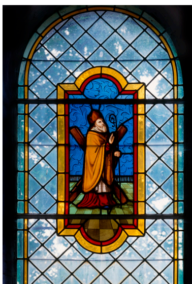
Baie 12 : saint André. IVR22_19998001257XA