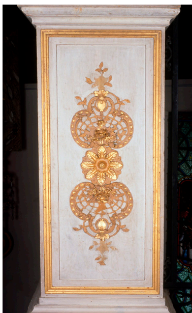
Détail d'un pilier en bois doré peint et doré à l'entrée de l'abside.