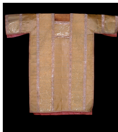
Un des deux dalmatiques en drap d'or, ornés d'un drap d'or moiré.