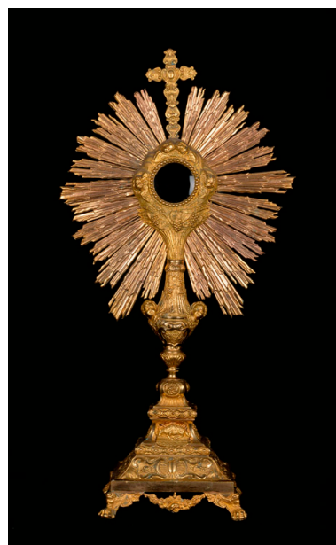
Ostensoir, par Placide Poussielgue-Rusand. IVR22_19998001264XA