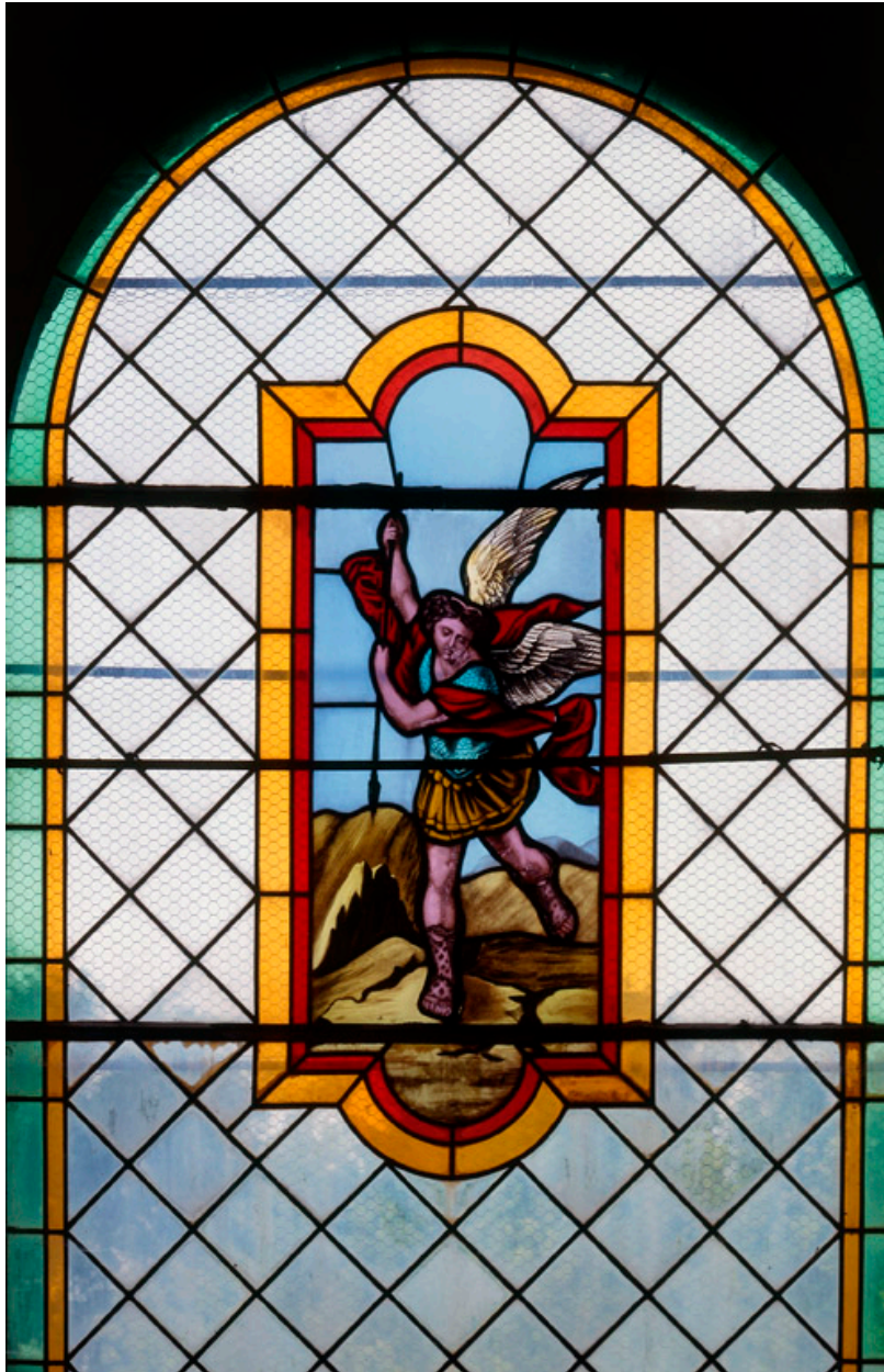
Baie 5 : saint Michel.