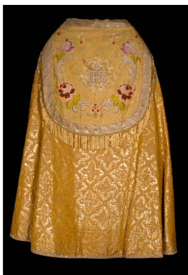
Chape en damas de fil d'or et soie jaune.