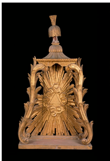
Dais d'exposition installé sur le tabernacle de la chapelle sud. IVR22_19998001265XA