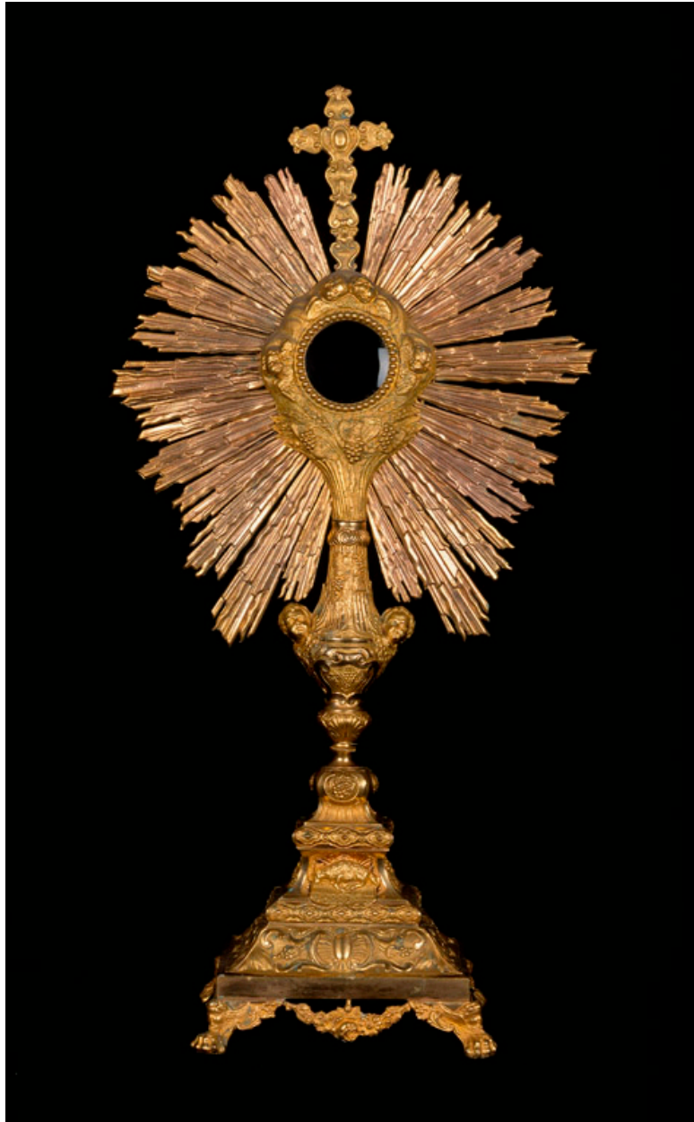
Ostensoir, par Placide Poussielgue-Rusand.