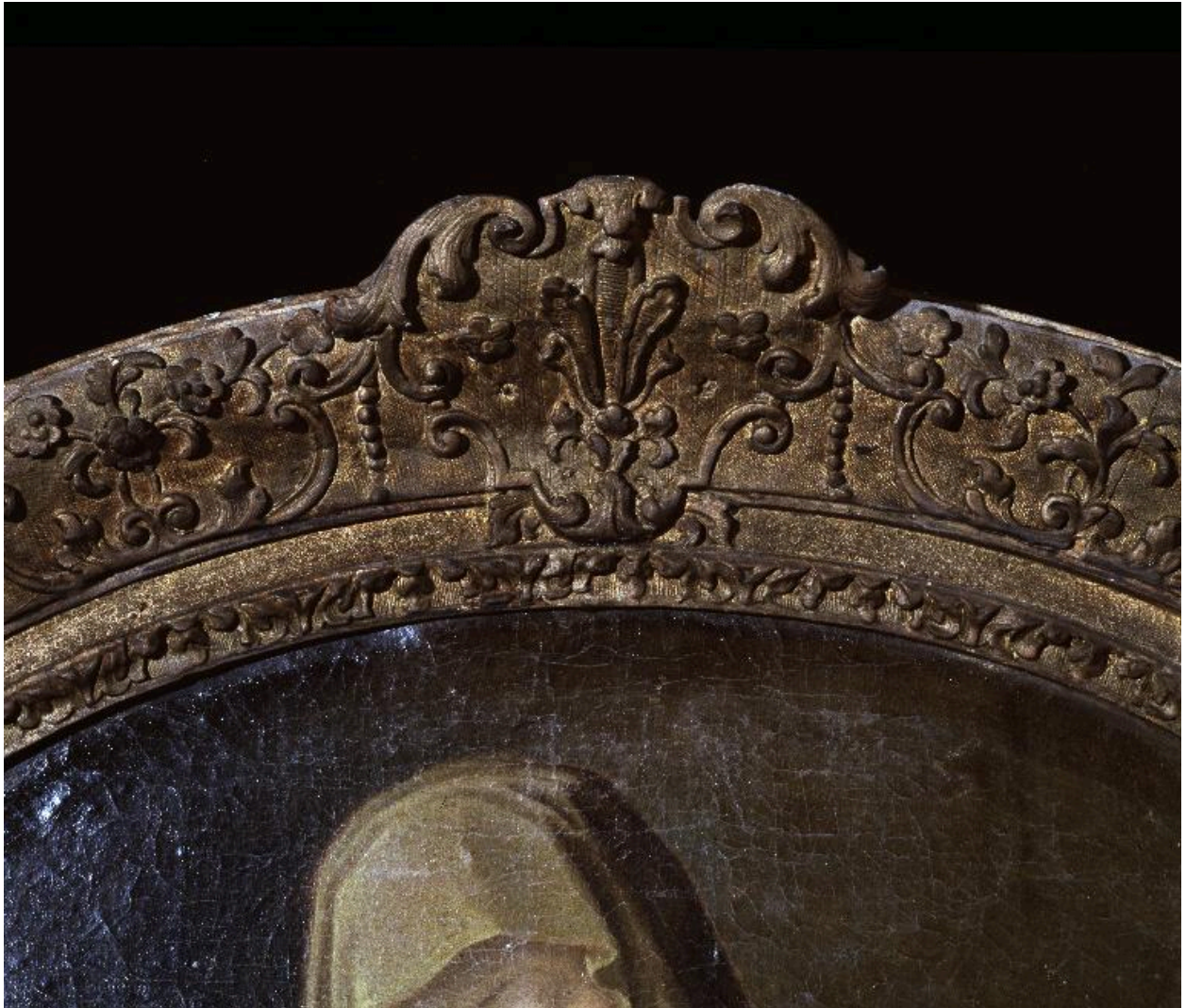
Détail du cadre.