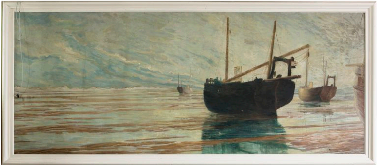
Bateaux sur la grève, toile sans signature.