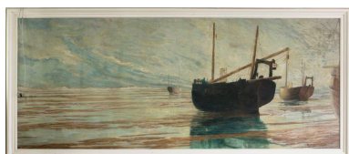
Bateaux sur la grève, toile sans signature.