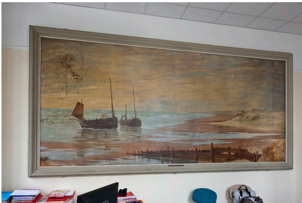
Bâteaux en mer.