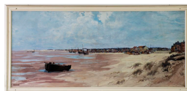
Plage de Berck. IVR31_20116200987NUCA