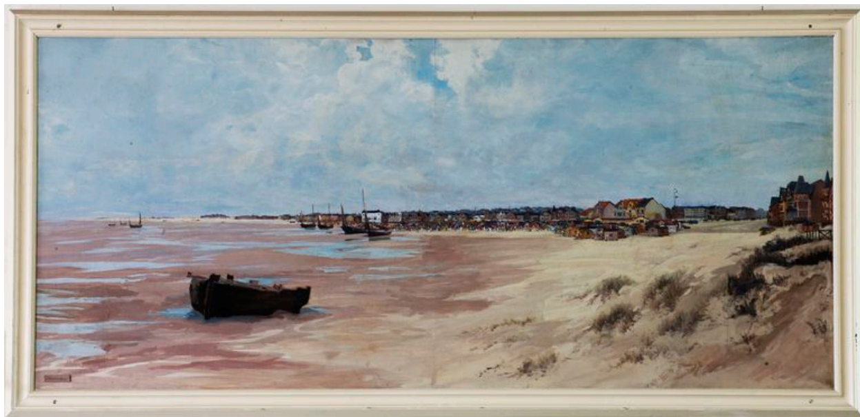
Plage de Berck.