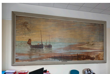
Bâteaux en mer. IVR31_20116201013NUCA