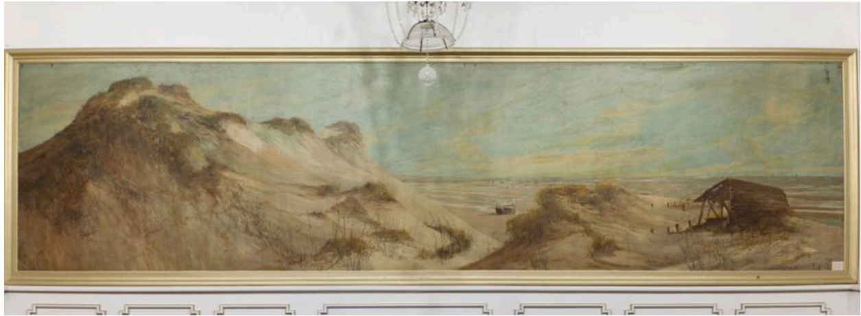
Plage de Groffliers, toile sans signature.