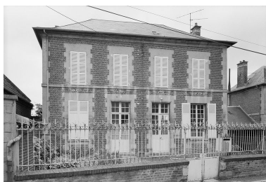
Elévation antérieure. IVR22_19846000957X