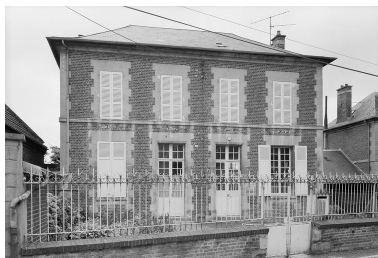
Elévation antérieure. IVR22_19846000957X