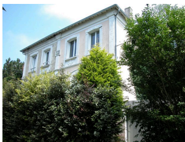
Vue de trois-quarts, façades sud et est. IVR22_20058003044NUCA