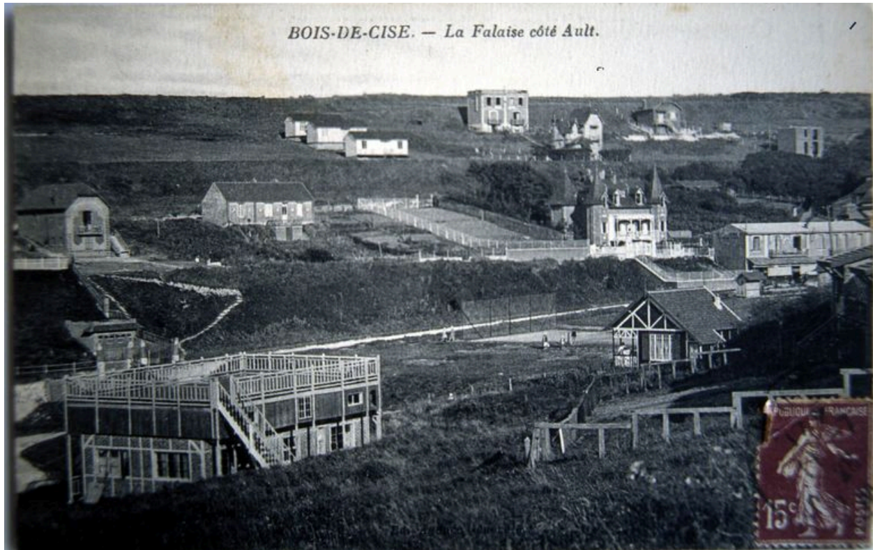
Bellevue, en haut de la carte postale, 1er quart 20e siècle.