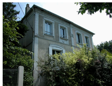
Vue de trois-quarts, façades sud et ouest. IVR22_20058003043NUCA