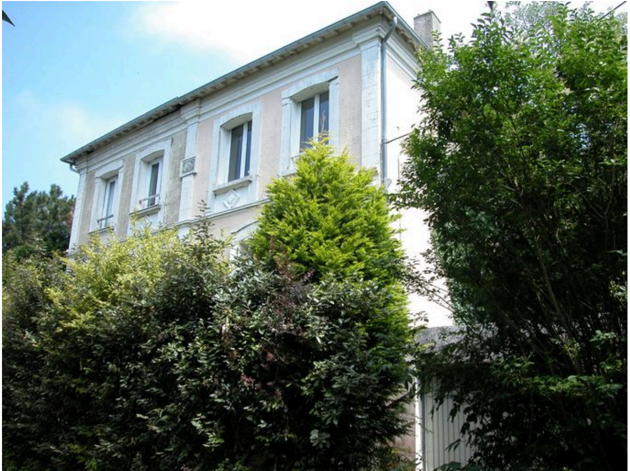
Vue de trois-quarts, façades sud et est.