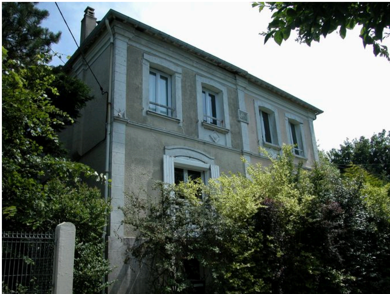
Vue de trois-quarts, façades sud et ouest.