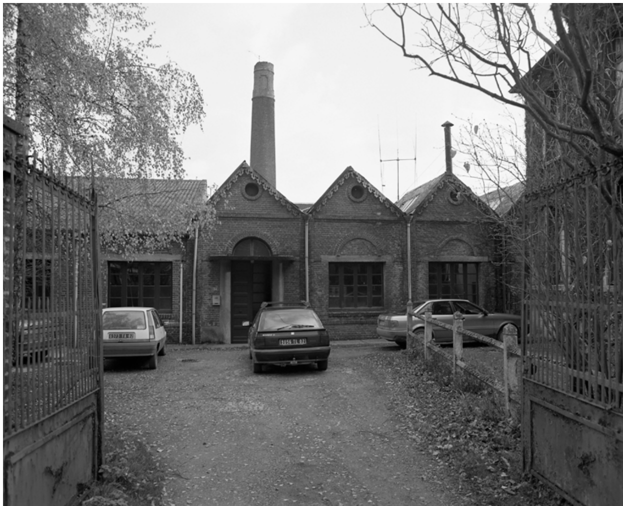
Entrée de l'usine : vue partielle de l'élévation sur rue de l'atelier de fabrication.