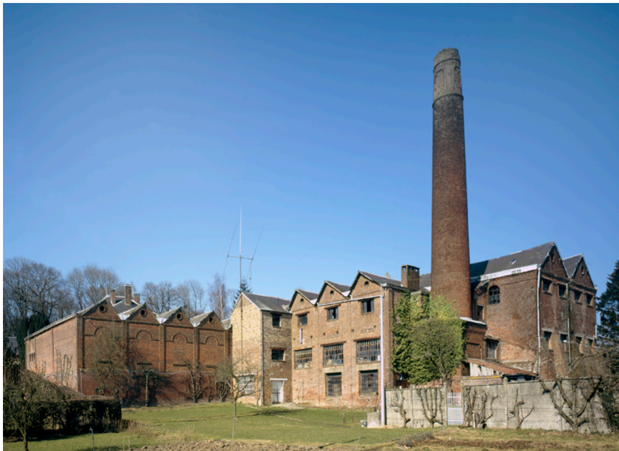
Vue générale de l'usine, depuis le sud.