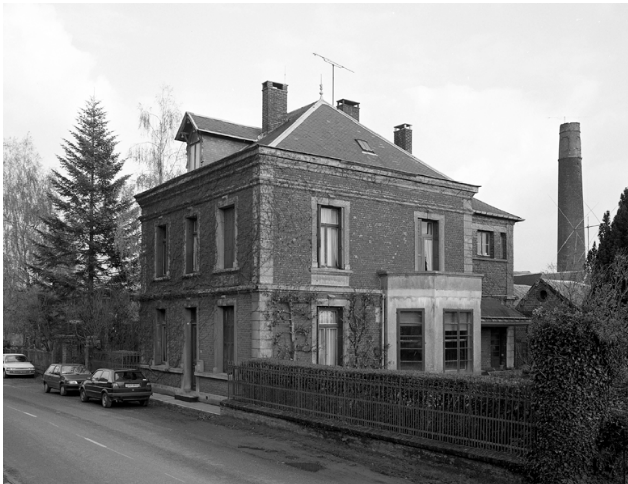
Vue générale du logement patronal.