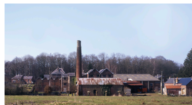
Vue générale de l'usine, depuis le sud-est. IVR22_19960200102XA