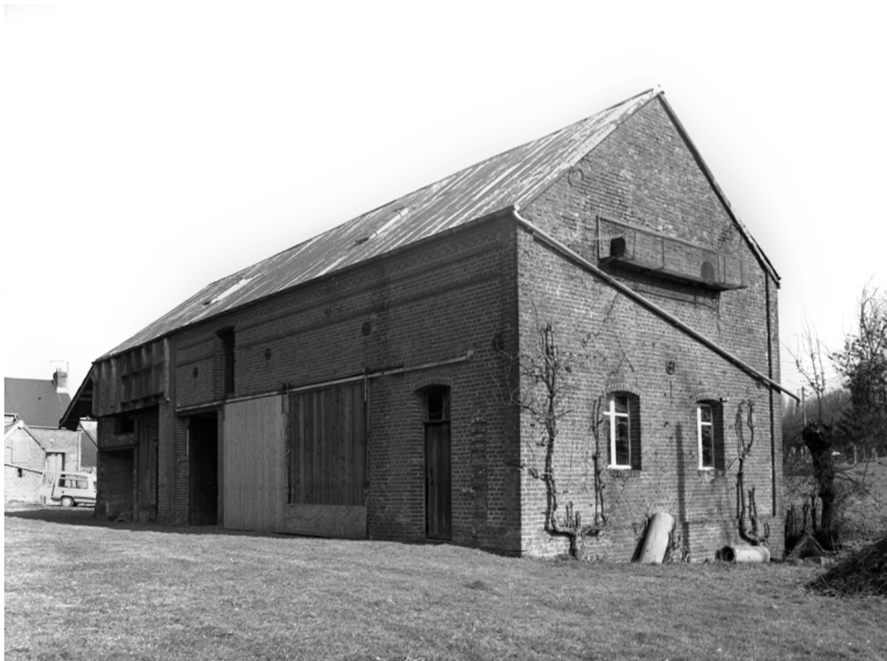
Vue des écuries et remises.