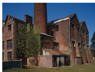
Vue sud de l'ancien bâtiment de la machine à vapeur avec la partie inférieure de la cheminée.