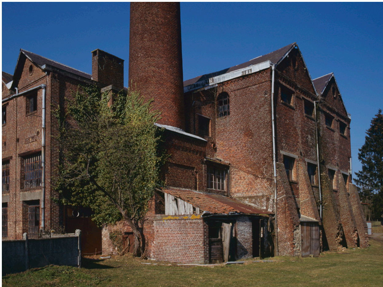
Vue sud de l'ancien bâtiment de la machine à vapeur avec la partie inférieure de la cheminée.