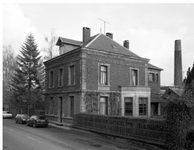
Vue générale du logement patronal. IVR22_19960200870X