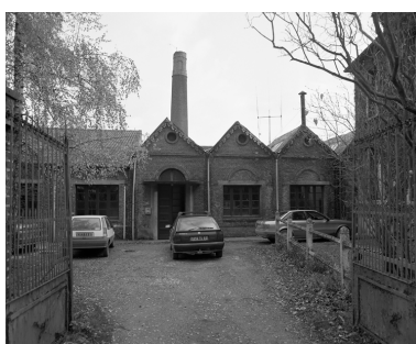
Entrée de l'usine : vue partielle de l'élévation sur rue de l'atelier de fabrication. IVR22_19960200871X