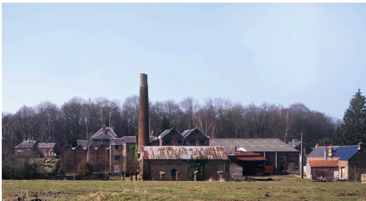
Vue générale de l'usine, depuis le sud-est.