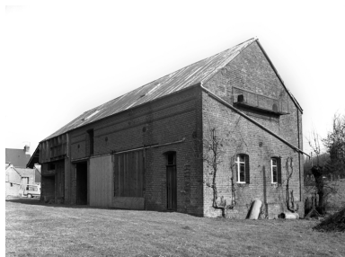
Vue des écuries et remises.