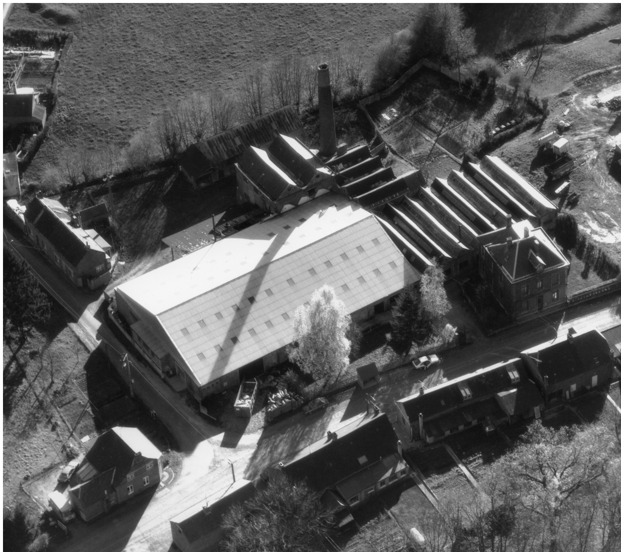
Vue aérienne de l'usine, depuis le nord.