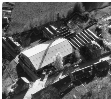
Vue aérienne de l'usine, depuis le nord.