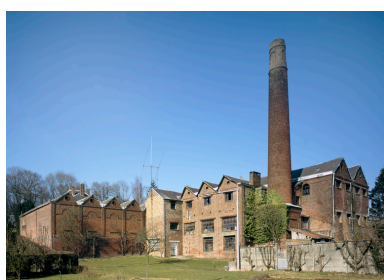
Vue générale de l'usine, depuis le sud.