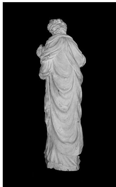
Statue Vierge à l'Enfant, noyer peint, 1ère moitié 17e siècle. Dépôt de l'église de Romeny. Vue de dos. IVR22_19930201004X