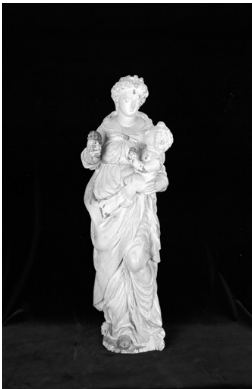
Noyer peint, 1ère moitié 17e siècle. Dépôt de l'église de Romeny, vue de face.