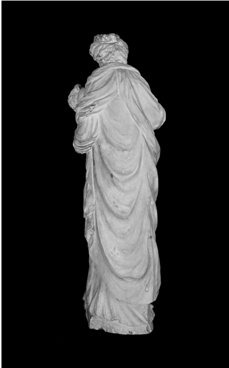
Statue Vierge à l'Enfant, noyer peint, 1ère moitié 17e siècle. Dépôt de l'église de Romeny. Vue de dos.