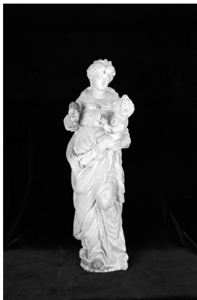
Noyer peint, 1ère moitié 17e siècle. Dépôt de l'église de Romeny, vue de face.