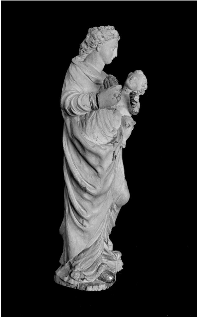
Noyer peint, 1ère moitié 17e siècle. Dépôt de l'église de Romeny. Vue de trois quarts.