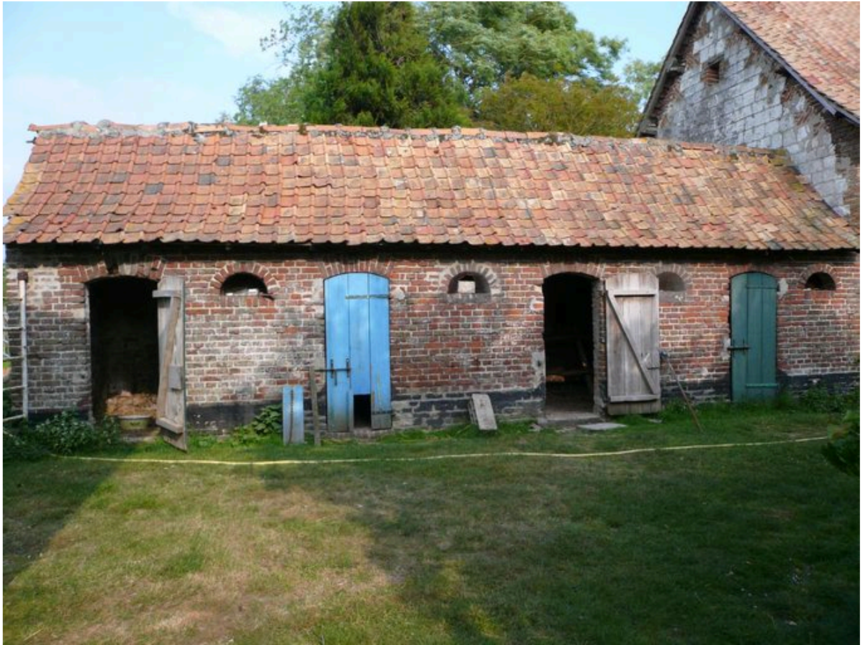
Vue des étables à cochons dans le prolongement nord des écuries.