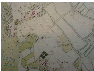
Plan de la ferme au 18e siècle extrait d'une carte du Marquenterre.