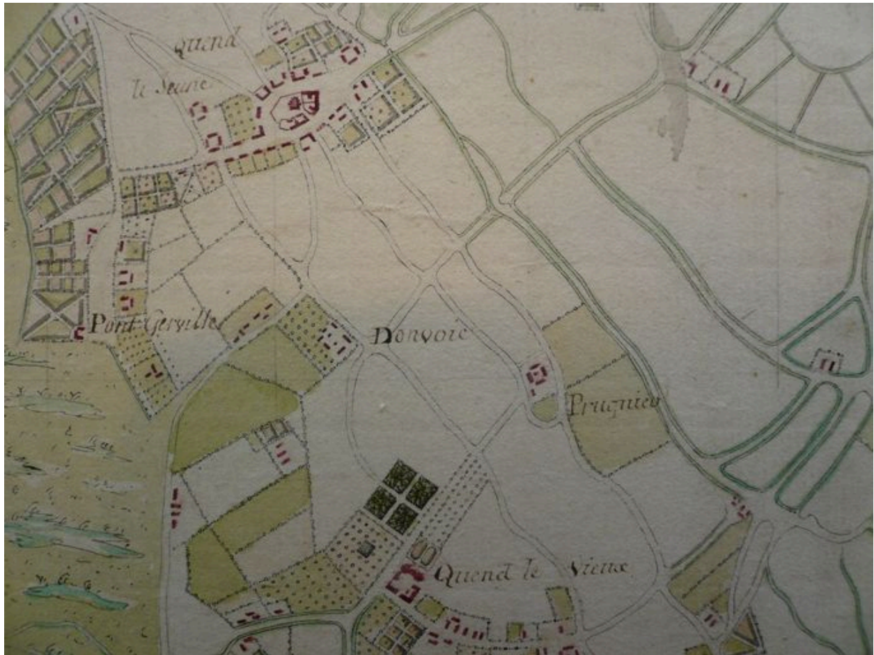
Plan de la ferme au 18e siècle extrait d'une carte du Marquenterre.