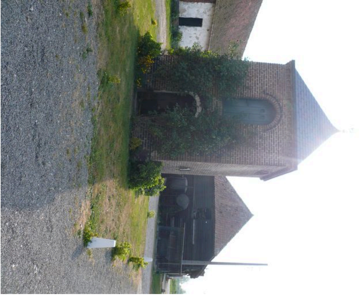
Vue du pigeonnier au coeur de la cour.