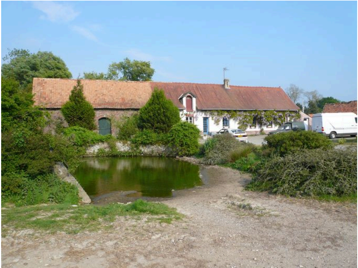
Vue du logis à l'est.