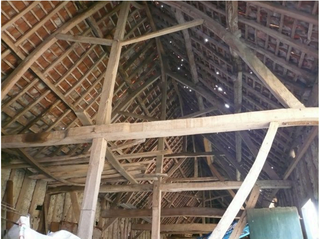
Vue intérieure de la grange, détail de la charpente.