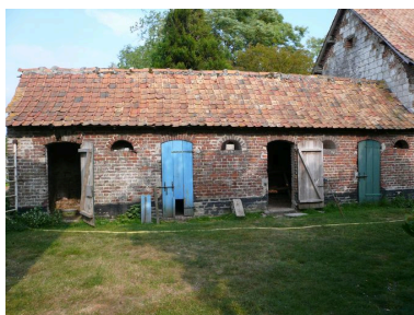
Vue des étables à cochons dans le prolongement nord des écuries.