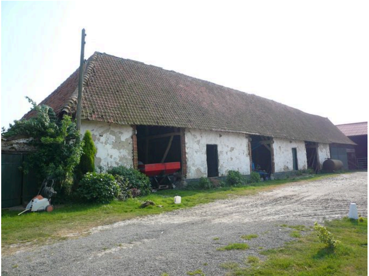
Vue de la grange dans le prolongement des étables à cochons vers l'ouest.