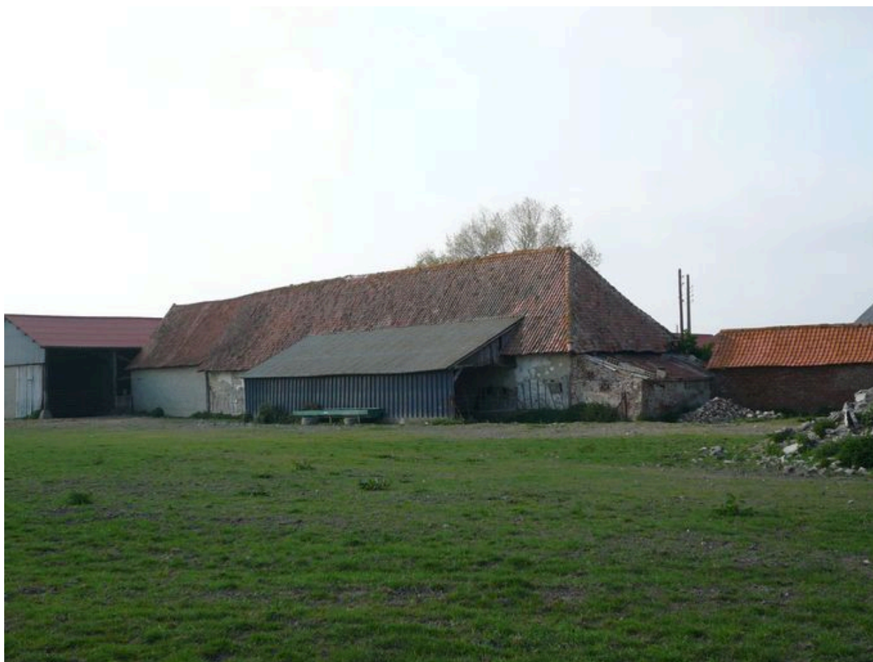
Vue postérieure de la grange.