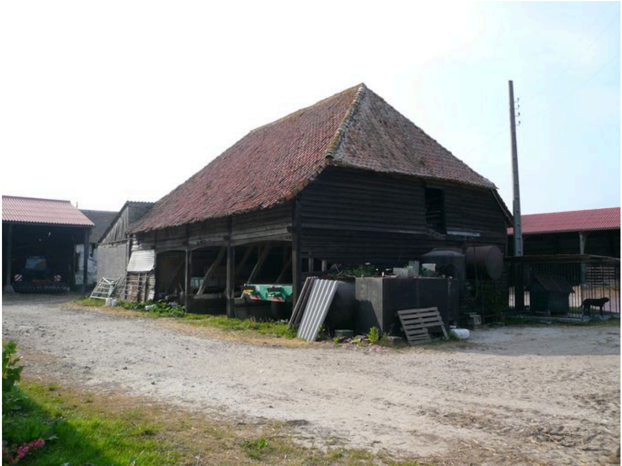
Vue de la charretterie et du grenier sous les combles.