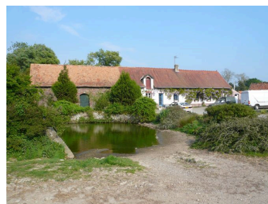
Vue du logis à l'est. IVR22_20078005850NUCA