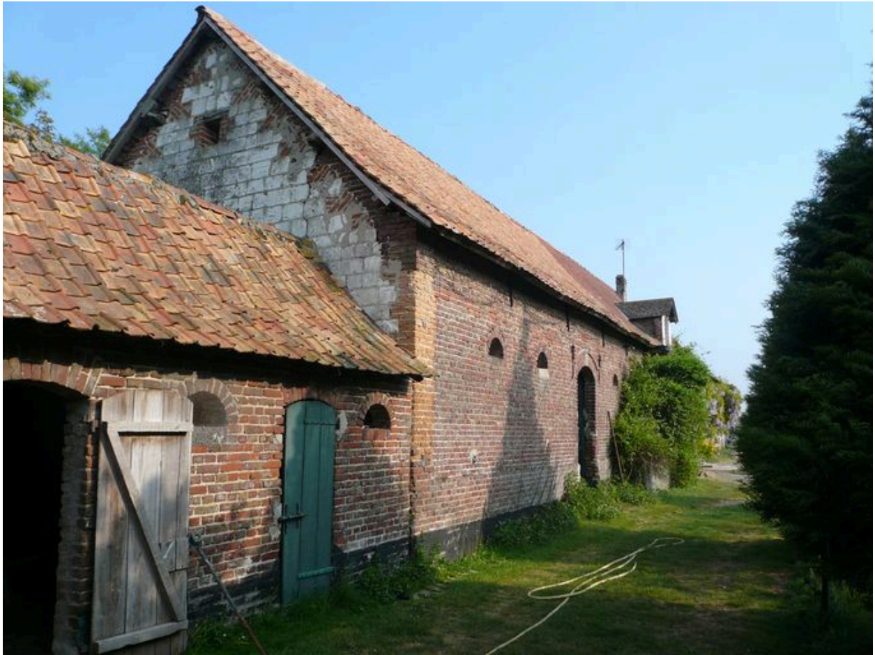
Vue des écuries dans le prolongement du logis au nord, placées à côté de la chambre du propriétaire.