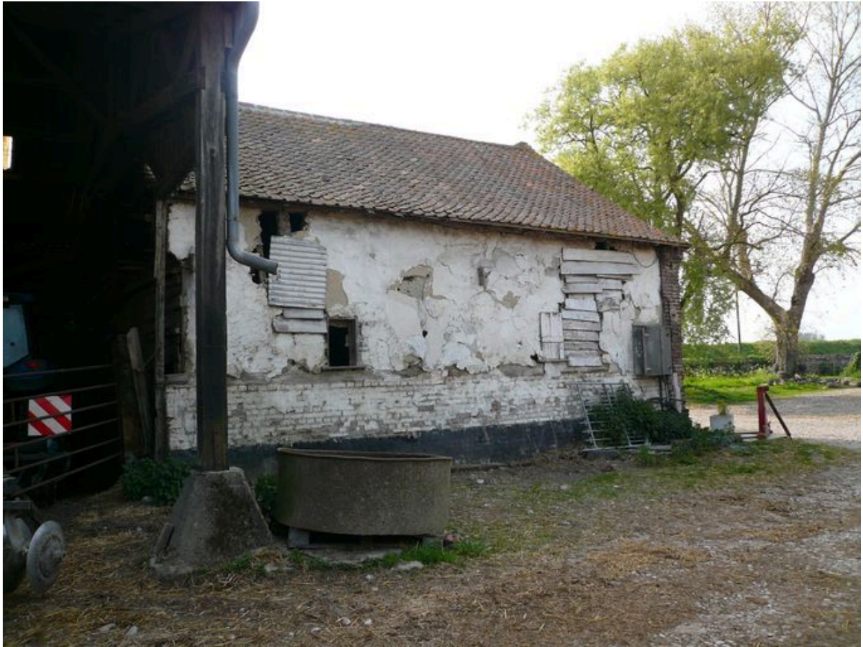
Vue depuis la cour des étables à l'entrée de la propriété.