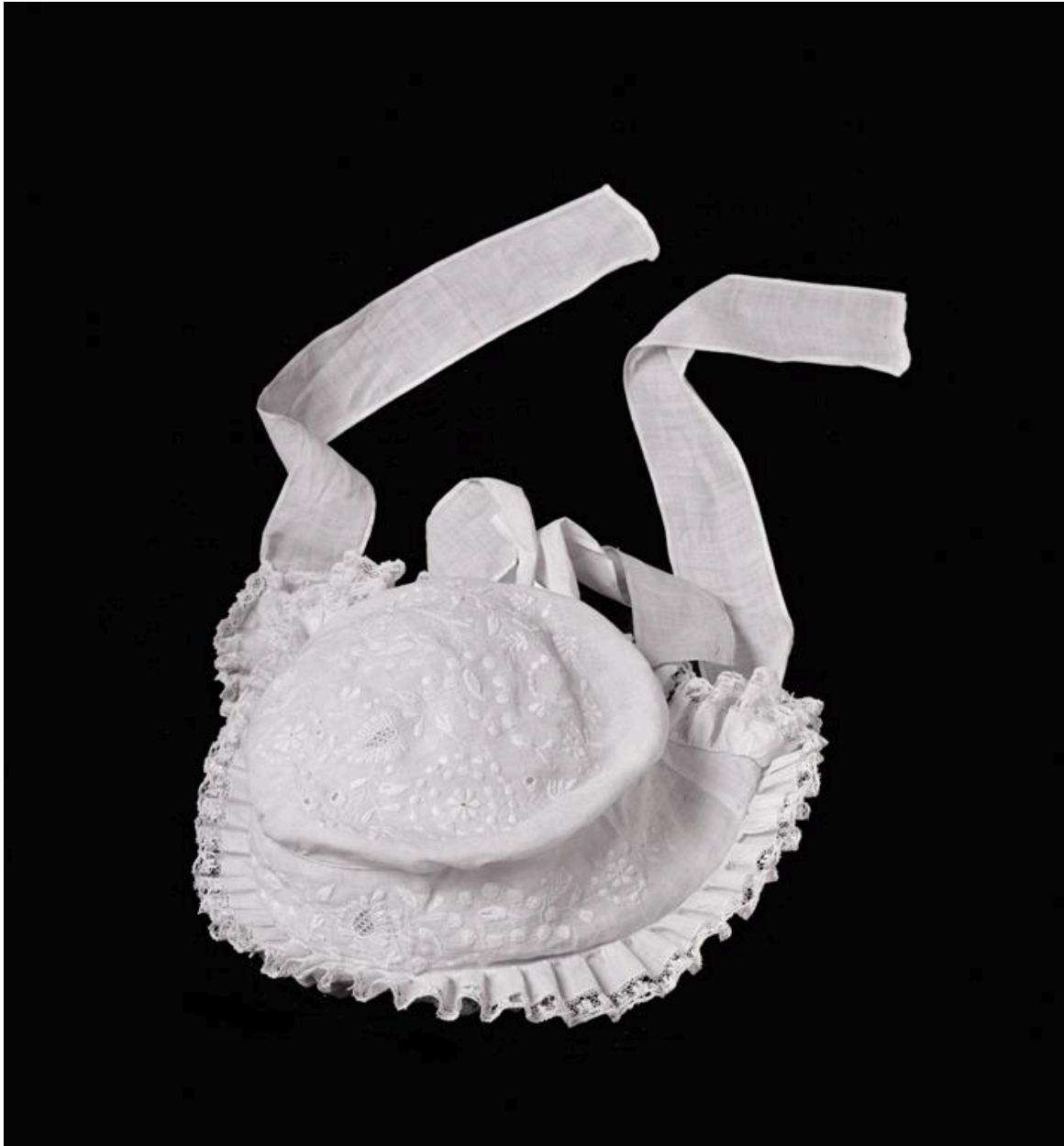
Vue de la seconde coiffe.