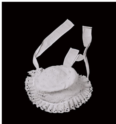
Vue de la première coiffe. IVR22_20010201919X