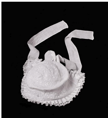
Vue de la seconde coiffe.