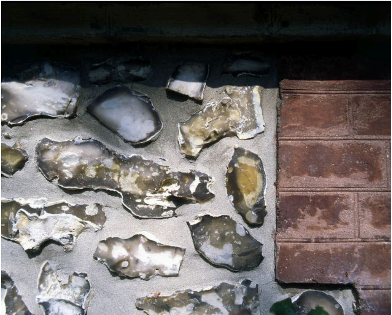
Détail de la maçonnerie du soubassement.