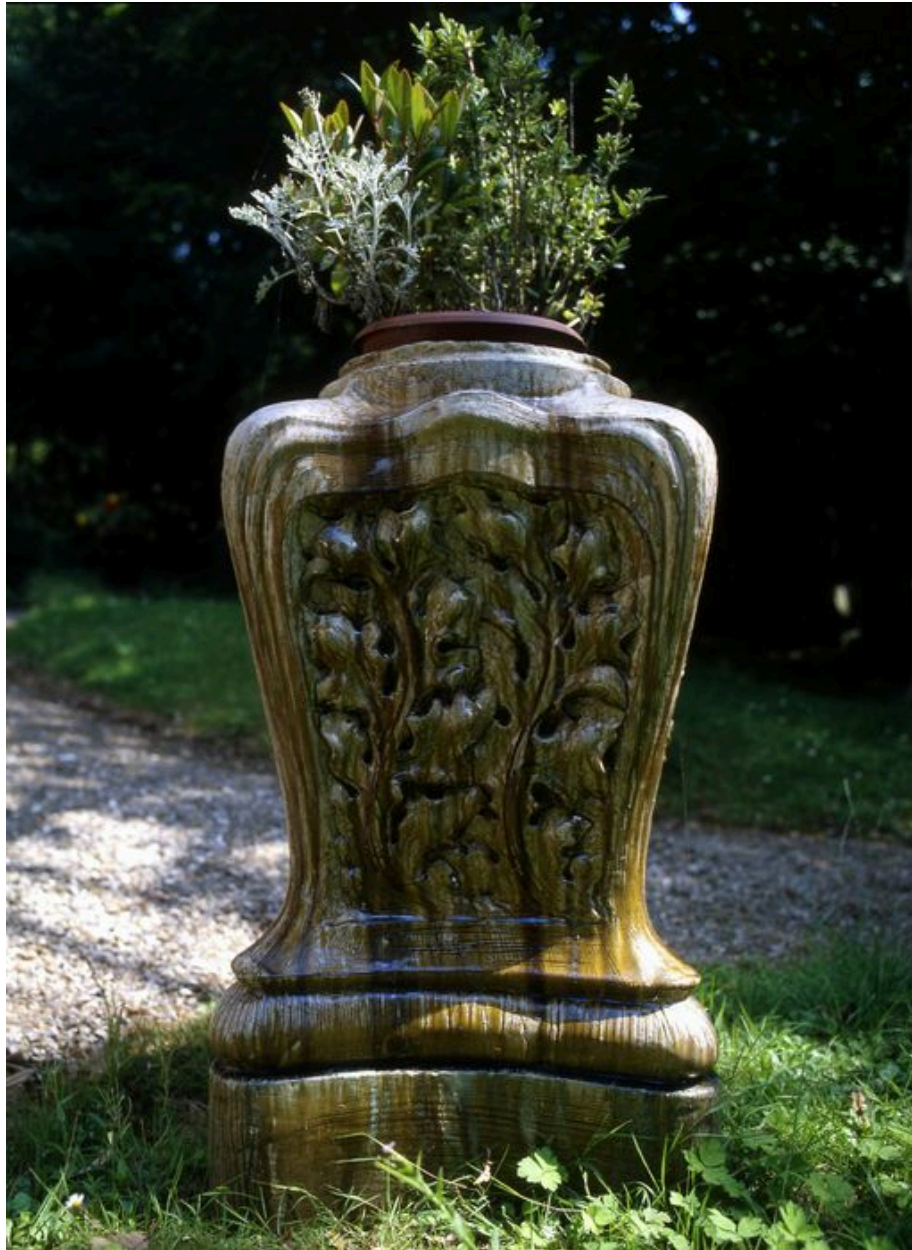
Détail d'un décor de jardin en grès émaillé.