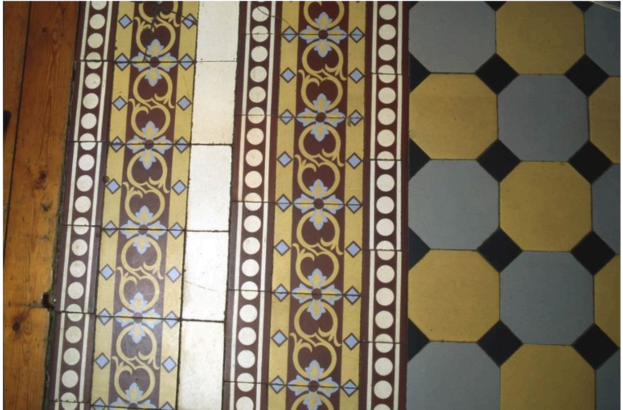
Détail du pavage de sol du vestibule d'entrée.