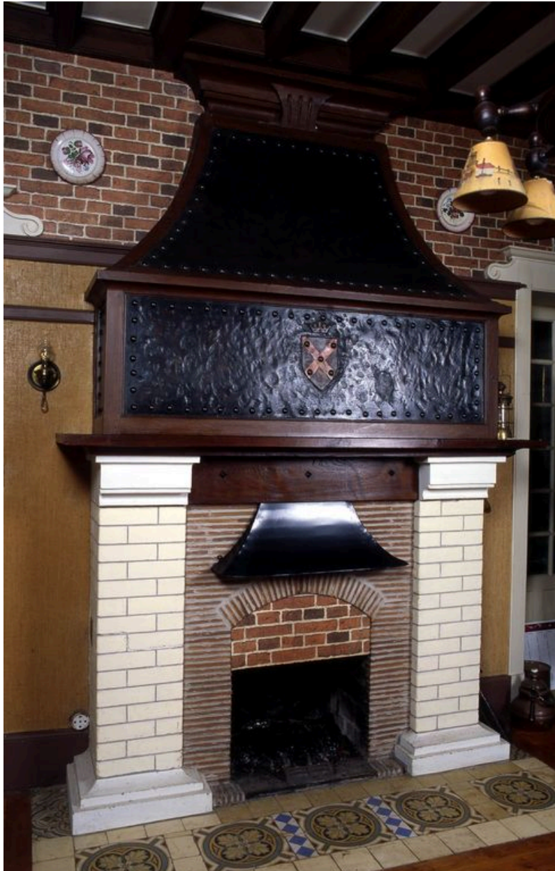
Cheminée de la pièce de réception.