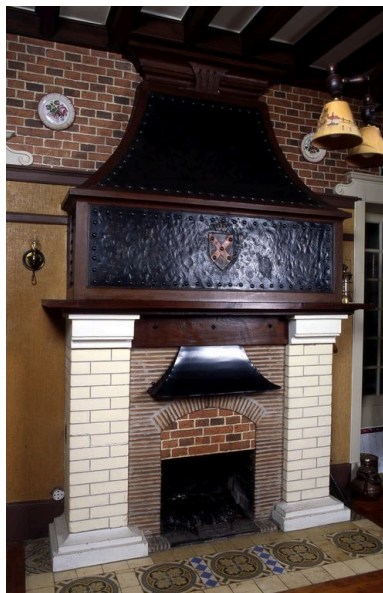
Cheminée de la pièce de réception. IVR22_20058001735XA

IVR22_20058001695XA