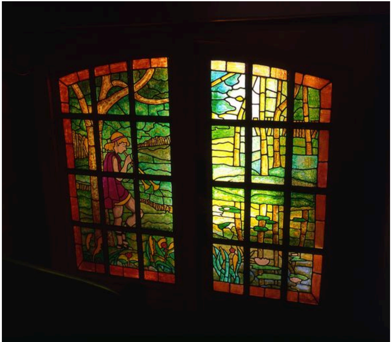
Faux vitrail situé au repos de l'escalier, éclairant les water-closet.