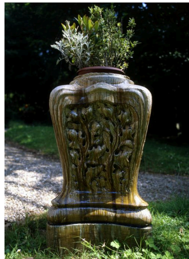
Détail d'un décor de jardin en grès émaillé.

IVR22_20058001696XA