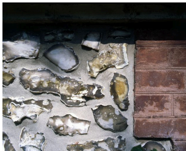
Détail de la maçonnerie du soubassement.

Phot. Marie-Laure Monnehay-Vulliet IVR22_20058001693XA