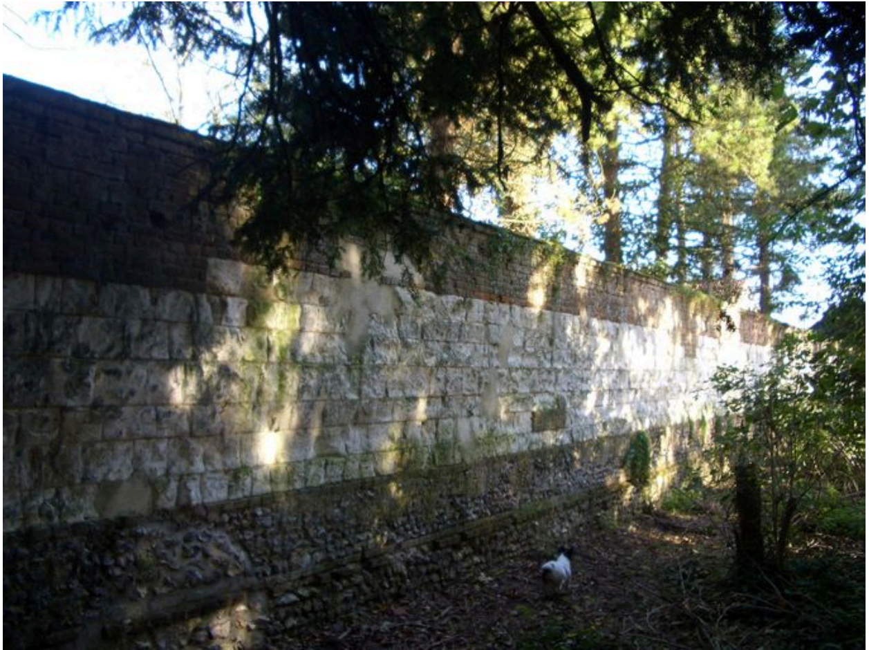
Vue du mur de clôture au nord de la propriété.