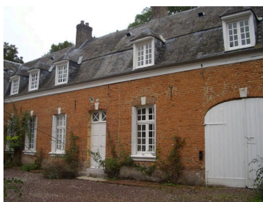
Vue latérale de ces dépendances.