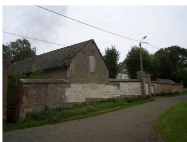
Vue générale depuis la rue du presbytère.