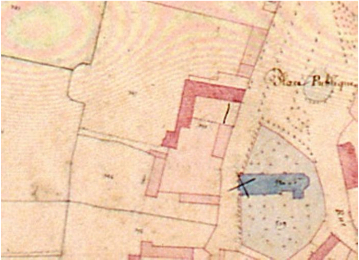
Vue détaillée du plan de la ferme en 1832 sur le cadastre napoléonien.