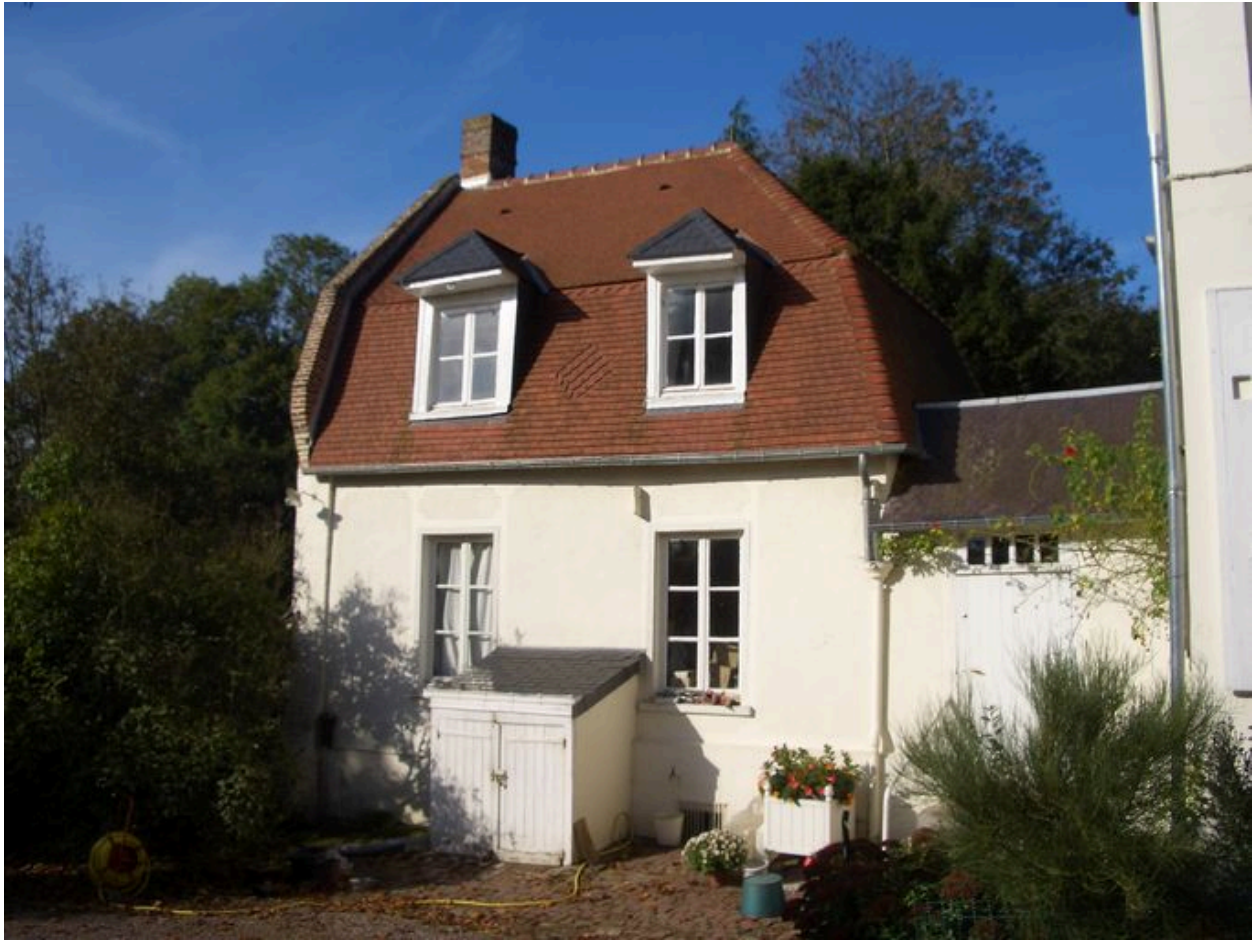
Vue du petit logis au sud.