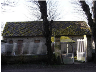
Vue de la grange à l'entrée de la cour.