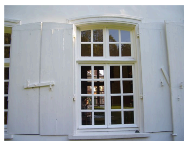
Vue détaillée des contrevents. IVR22_20068005538NUCA