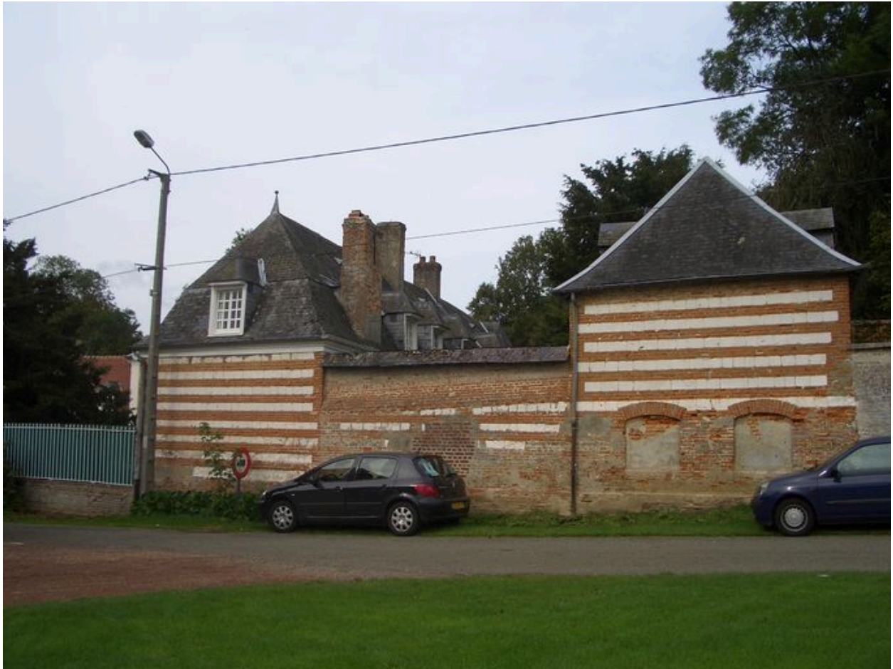
Vue des bâtiments 18e siècle depuis la place publique.