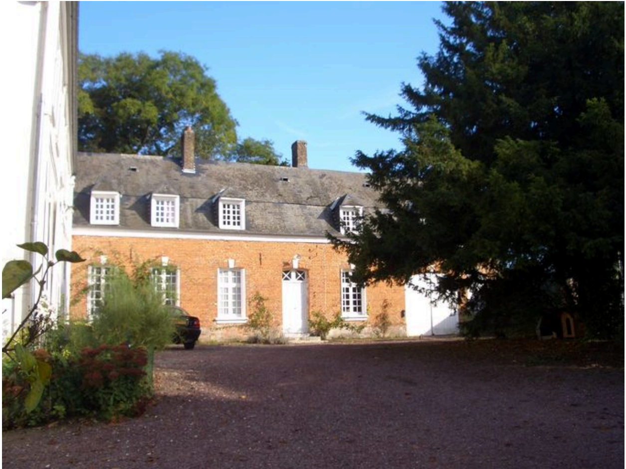
Vue des dépendances du 18e siècle au nord de la cour.