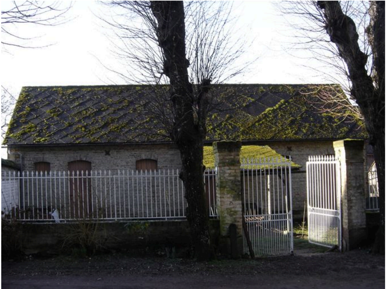
Vue de la grange à l'entrée de la cour.