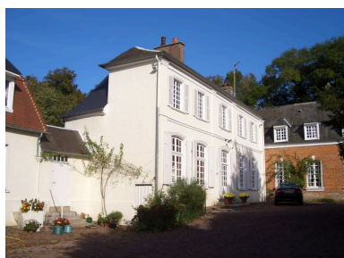
Vue du logis. IVR22_20068005536NUCA