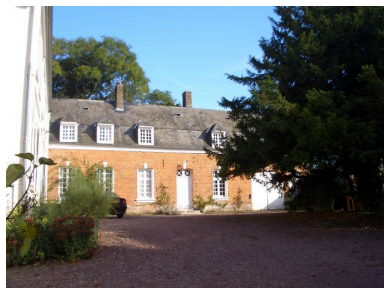
Vue des dépendances du 18e siècle au nord de la cour. IVR22_20068005531NUCA