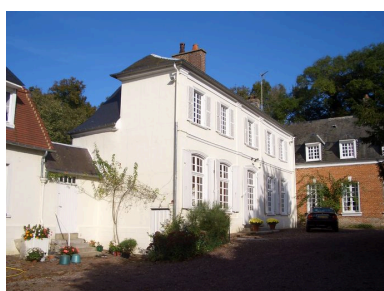
Vue du logis. IVR22_20068005536NUCA