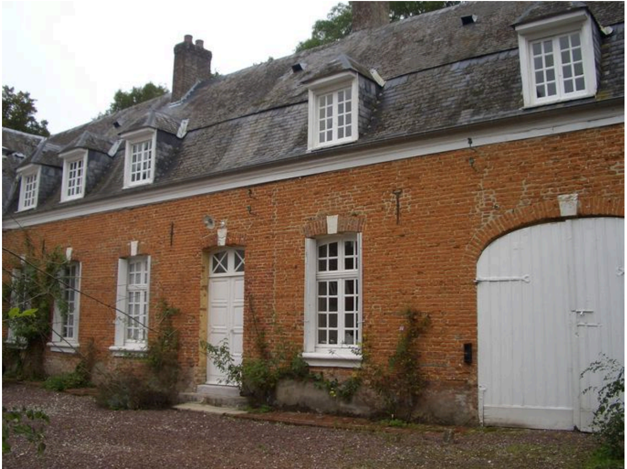
Vue latérale de ces dépendances.