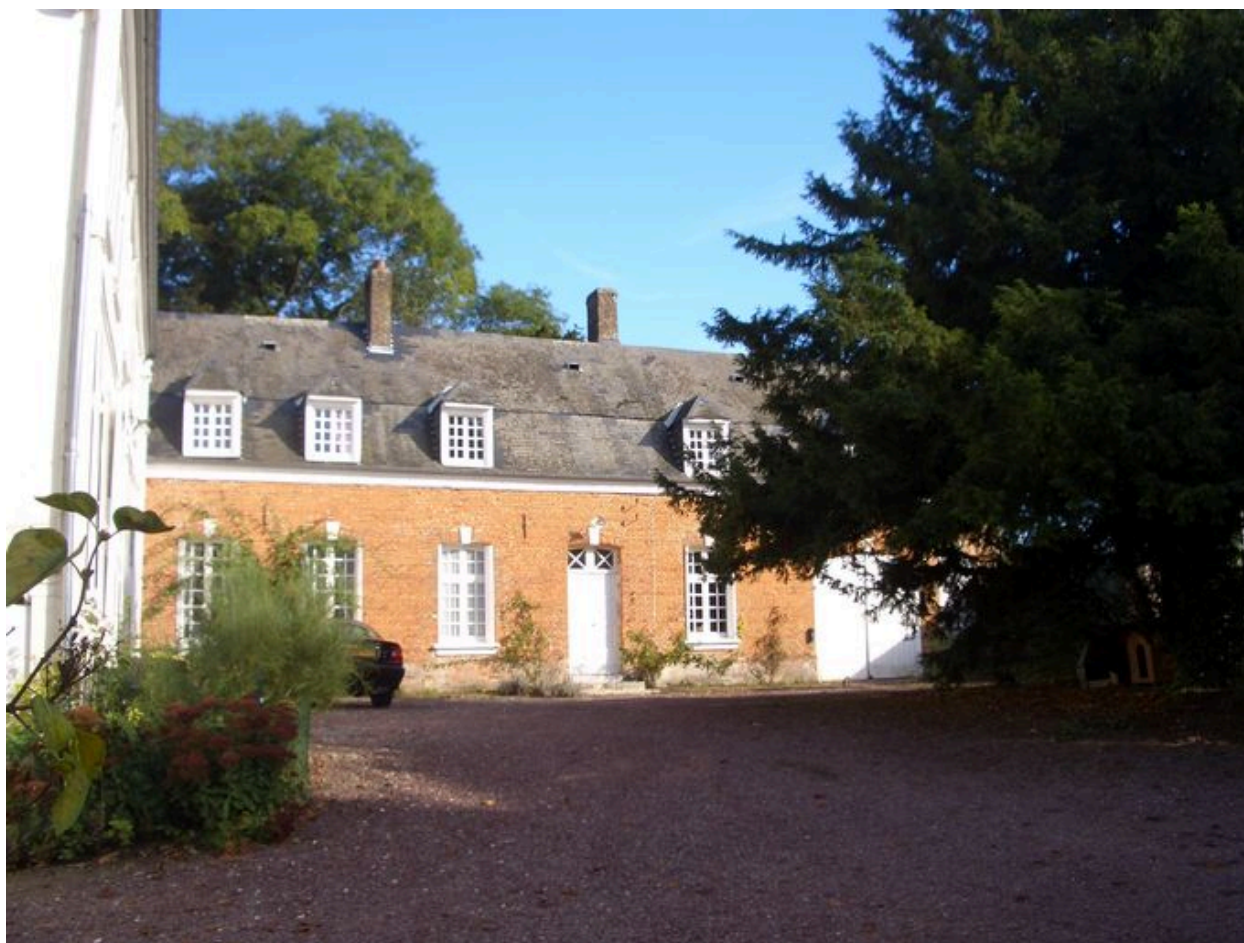
Vue des dépendances du 18e siècle au nord de la cour.