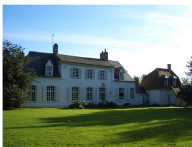
Vue postérieure. IVR22_20068005537NUCA