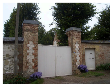
Vue de l'entrée sud.