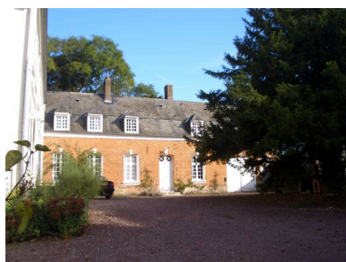
Vue des dépendances du 18e siècle au nord de la cour.