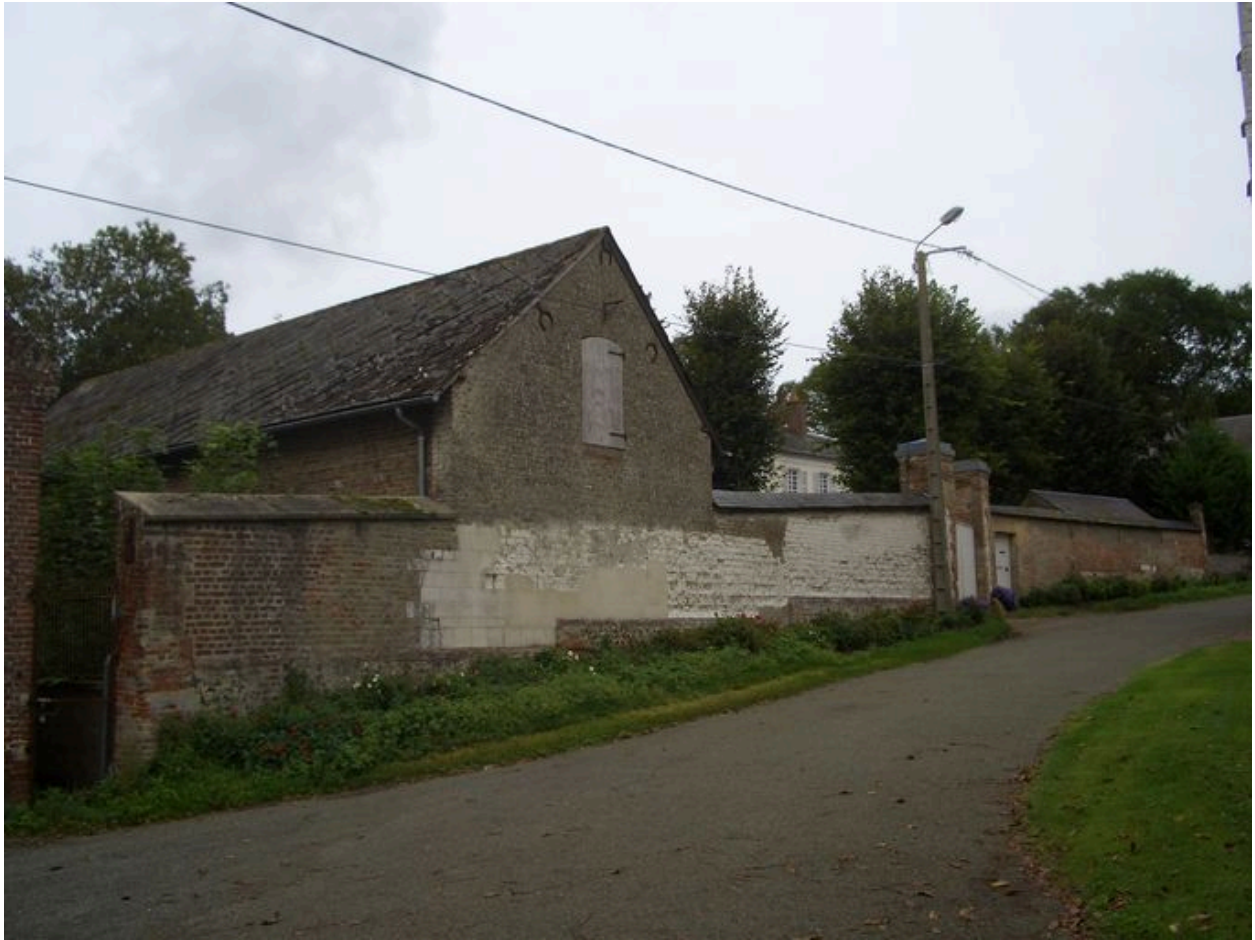
Vue générale depuis la rue du presbytère.