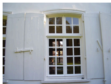
Vue détaillée des contrevents. IVR22_20068005538NUCA