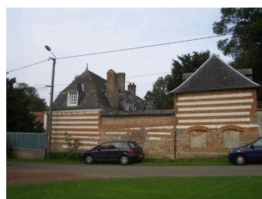
Vue des bâtiments 18e siècle depuis la place publique.