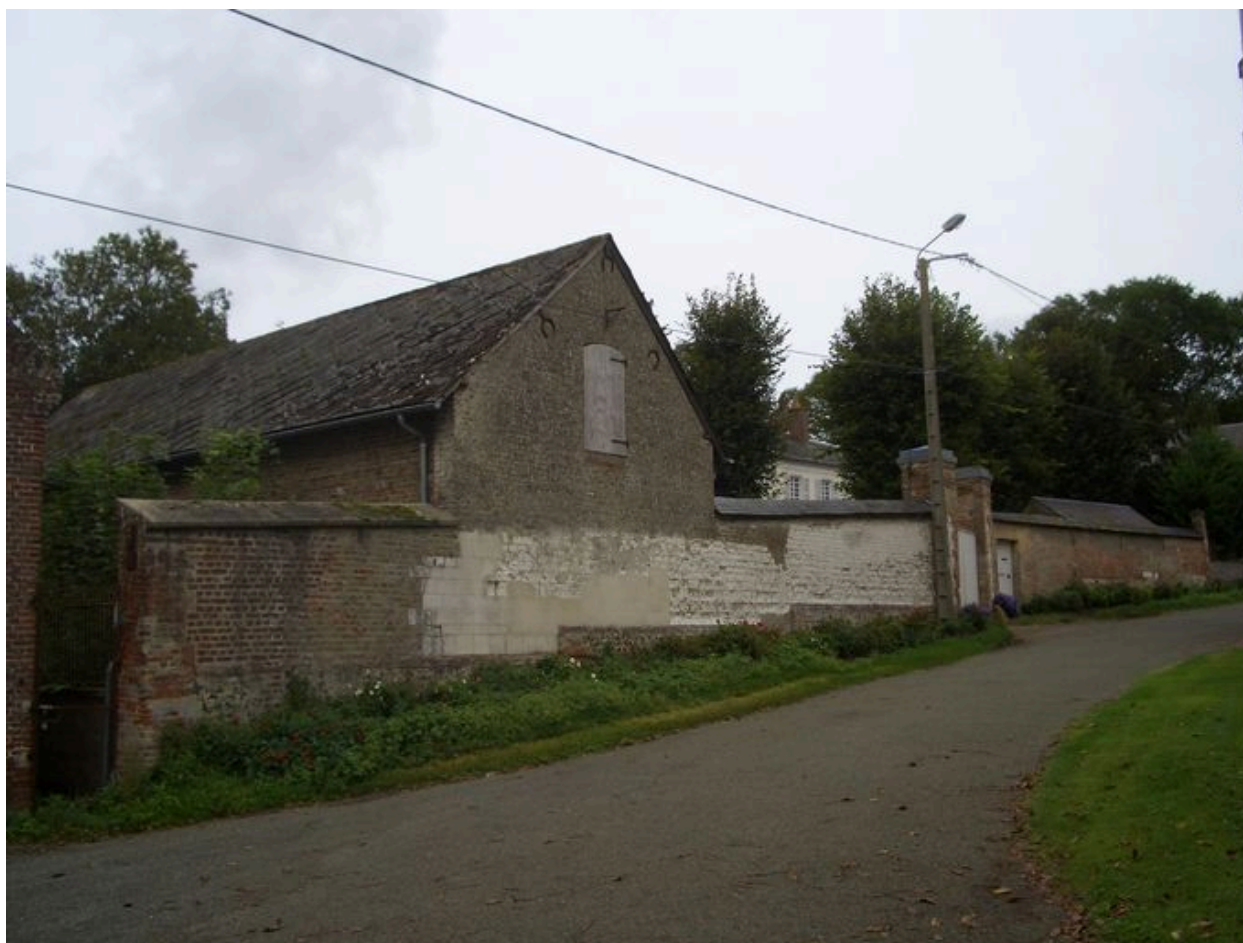
Vue générale depuis la rue du presbytère.