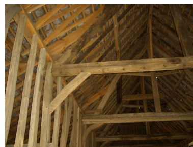
Vue partielle de sa charpente. IVR22_20068005542NUCA