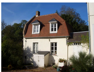
Vue du petit logis au sud.