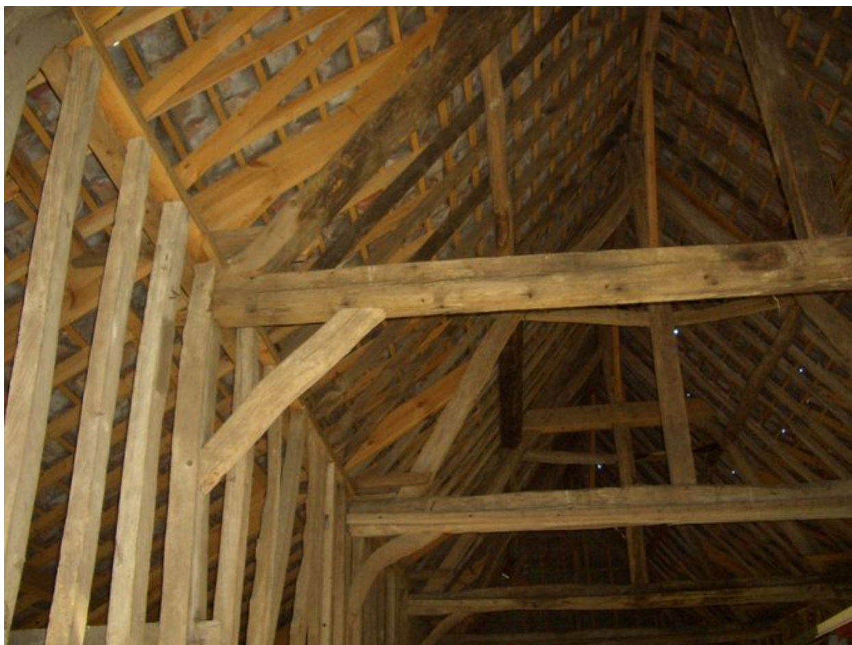
Vue partielle de sa charpente.