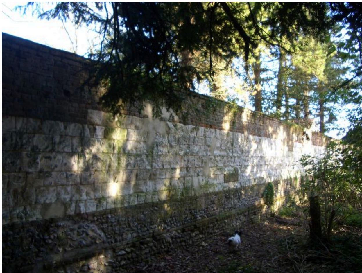
Vue du mur de clôture au nord de la propriété.