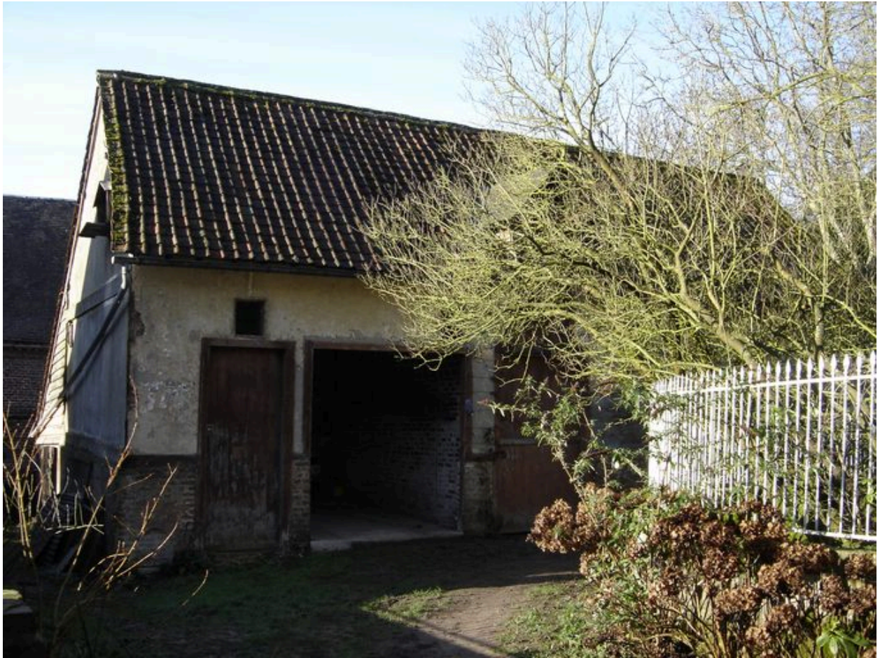
Vue des étables à l'entrée de la propriété.