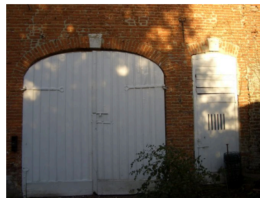
Vue détaillée des portes de la remise dans les dépendances 18e siècle.