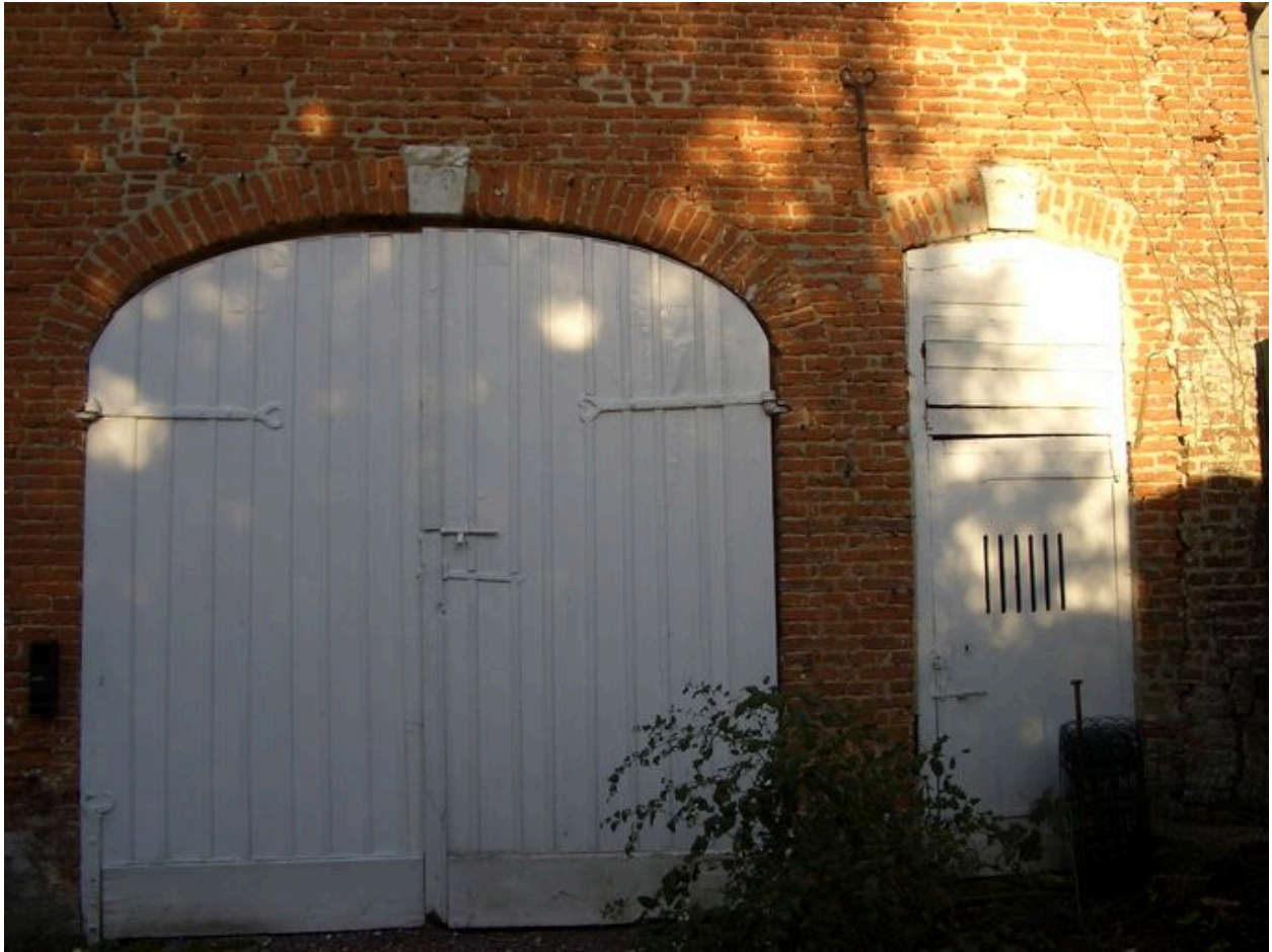
Vue détaillée des portes de la remise dans les dépendances 18e siècle.