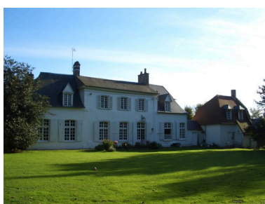
Vue postérieure.