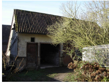
Vue des étables à l'entrée de la propriété. IVR22_20078005376NUCA