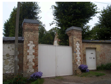
Vue de l'entrée sud. IVR22_20068005530NUCA