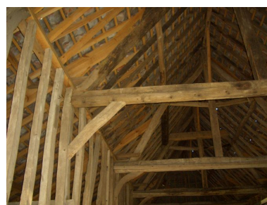
Vue partielle de sa charpente.