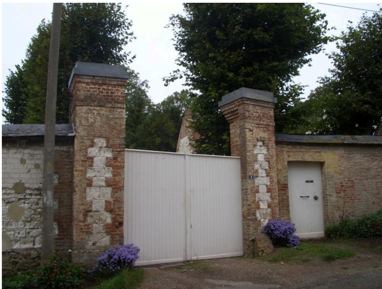
Vue de l'entrée sud.