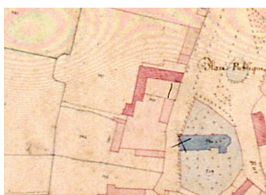
Vue détaillée du plan de la ferme en 1832 sur le cadastre napoléonien. IVR22_20068005672XAB