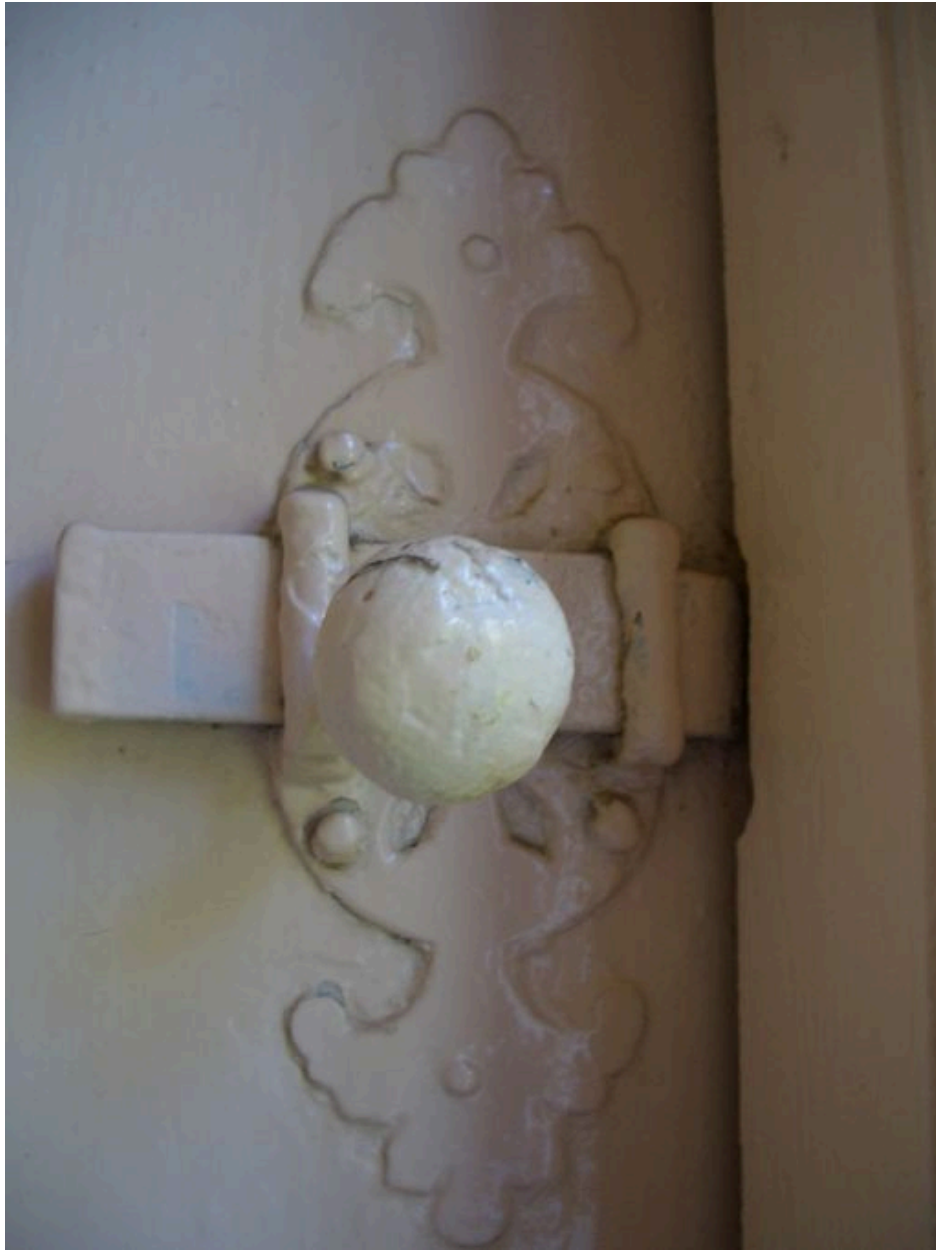
Vue détaillée d'un loquet du logis.