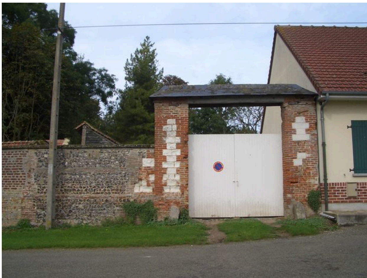
Vue de l'entrée située au nord.