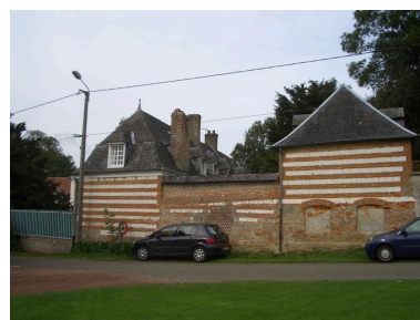
Vue des bâtiments 18e siècle depuis la place publique.