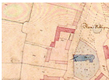
Vue détaillée du plan de la ferme en 1832 sur le cadastre napoléonien.