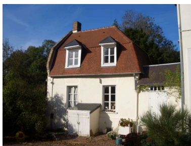
Vue du petit logis au sud. IVR22_20068005540NUCA