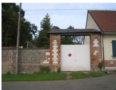
Vue de l'entrée située au nord.