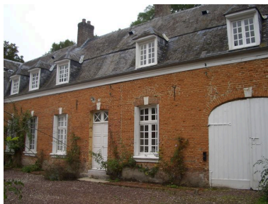
Vue latérale de ces dépendances.