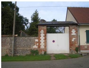
Vue de l'entrée située au nord.