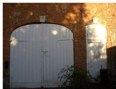
Vue détaillée des portes de la remise dans les dépendances 18e siècle.