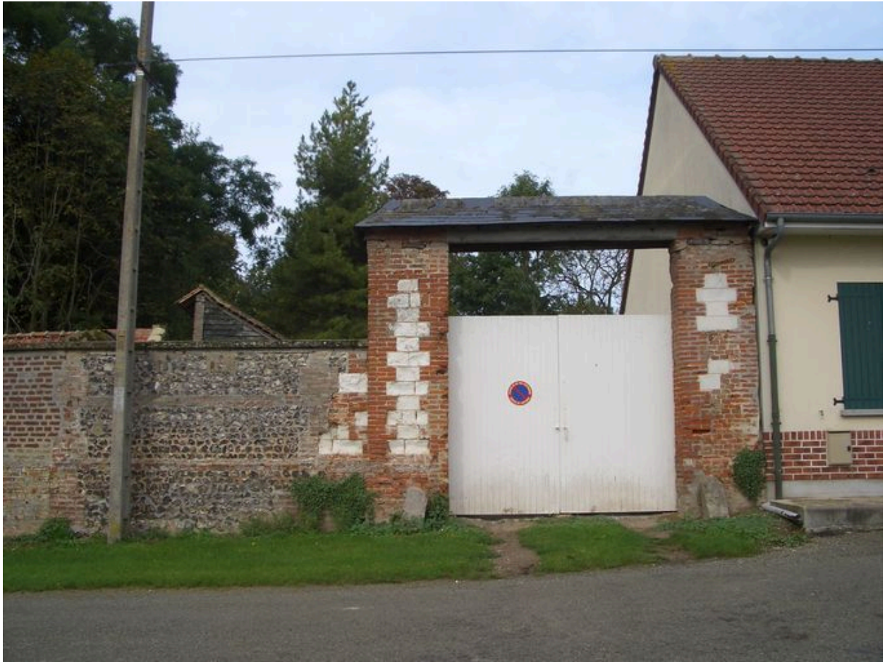
Vue de l'entrée située au nord.