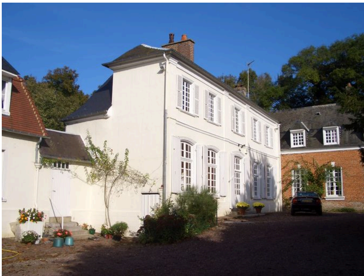
Vue du logis.