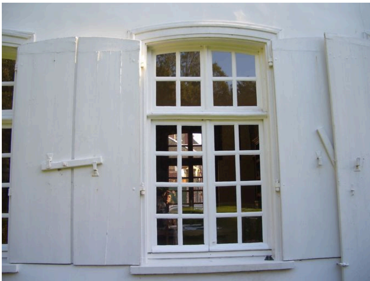
Vue détaillée des contrevents.