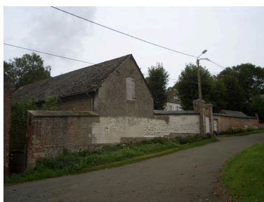
Vue générale depuis la rue du presbytère.