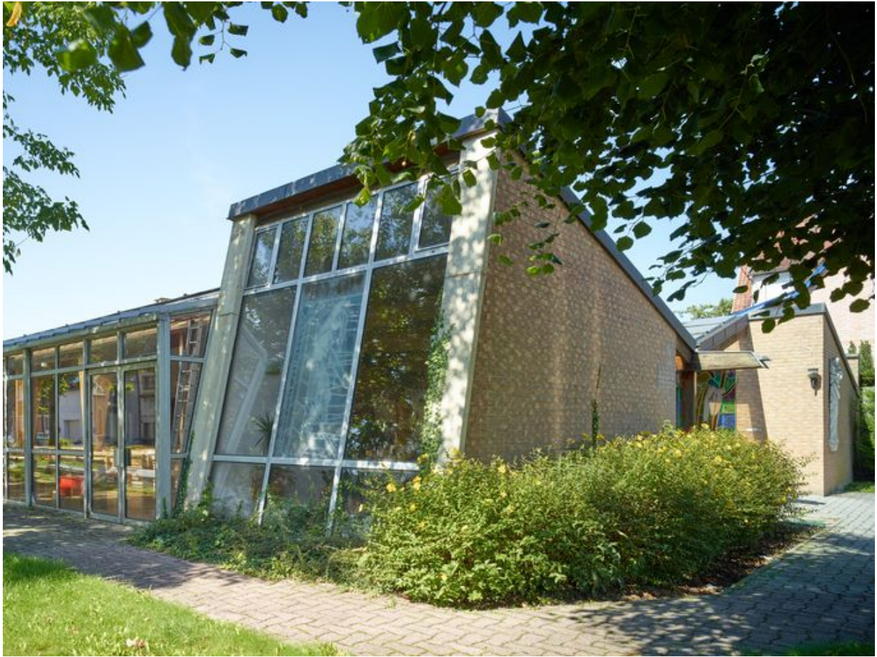
Élévation de trois quart, côté sud et est.