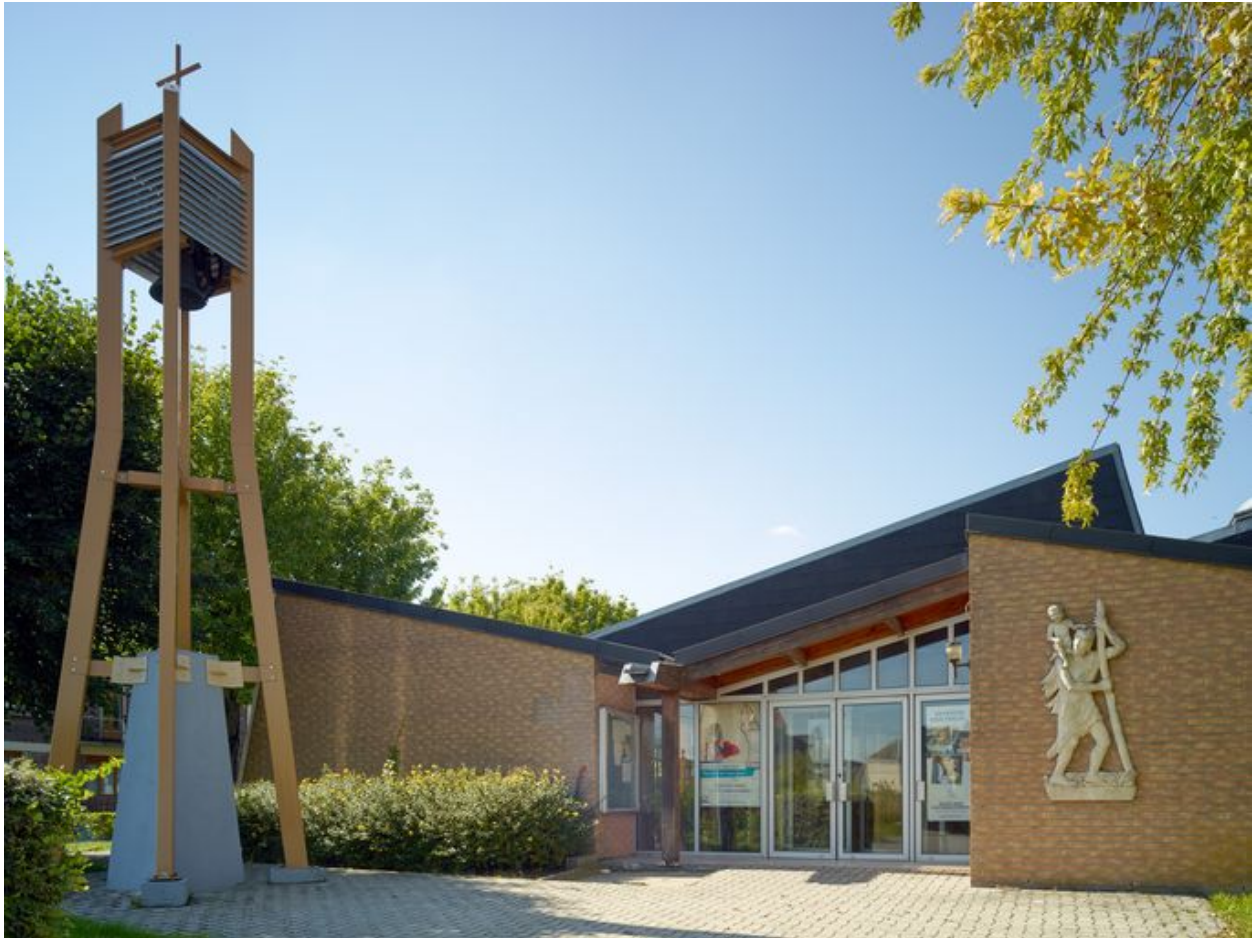
Élévation principale côté est, parvis avec son clocher.