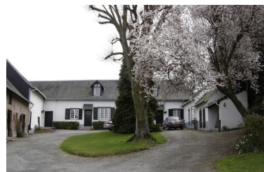
Vue depuis l'intérieur de la cour avec le logis dans le fond.