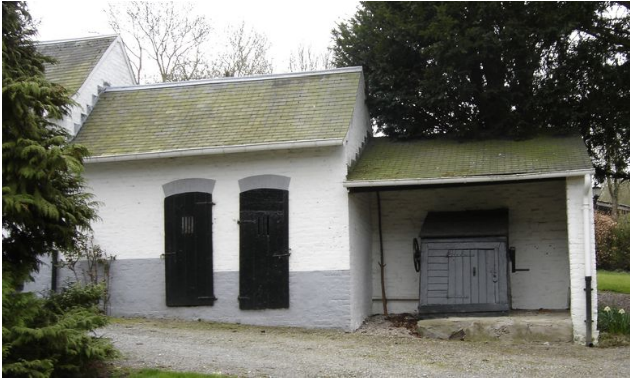
Vue des étables à cochons et du puits.