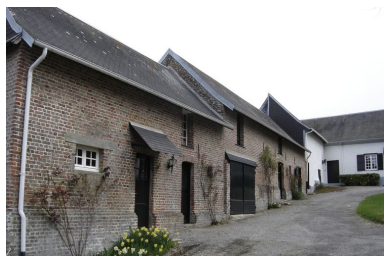
Vue de l'ensemble des bâtiments situés au nord-est de la cour avec le logement de l'employé de ferme au premier plan.