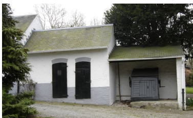
Vue des étables à cochons et du puits.