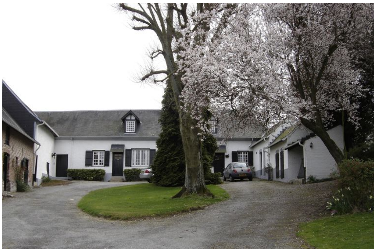
Vue depuis l'intérieur de la cour avec le logis dans le fond.