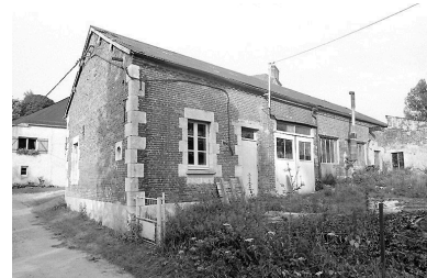
Ancienne laiterie transformée en porcherie. IVR22_19980202995Z