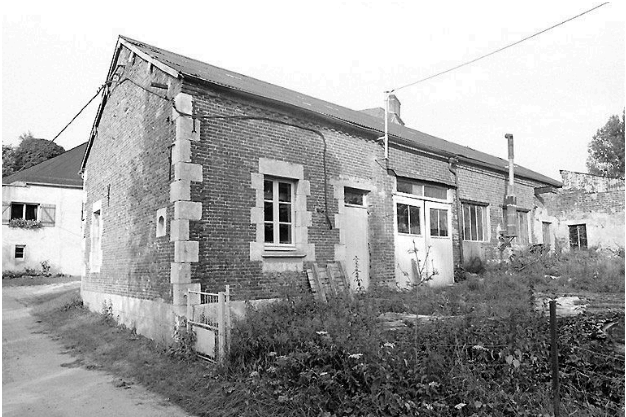
Ancienne laiterie transformée en porcherie.