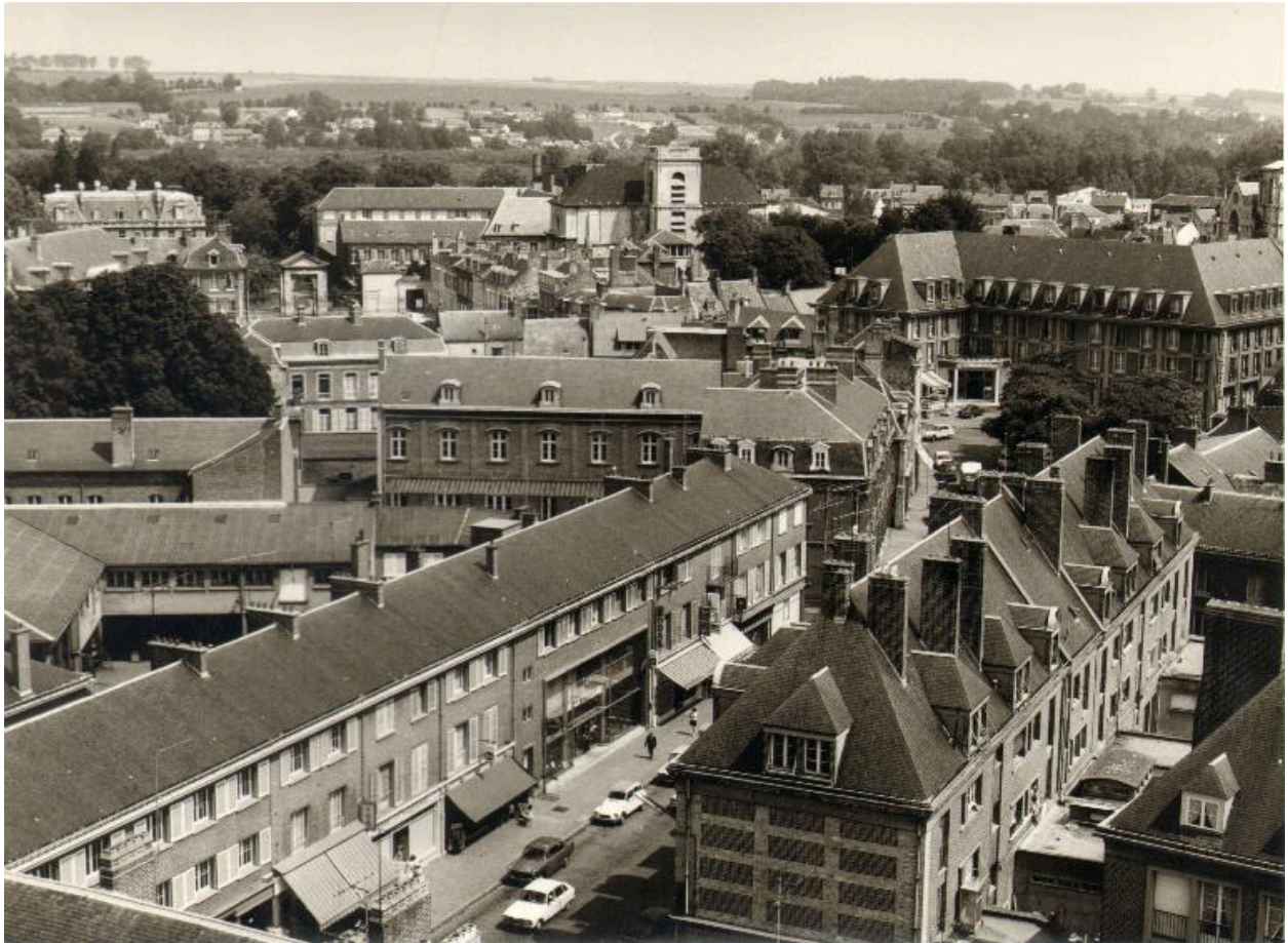
Le centre reconstruit depuis l'hôtel de ville vers le nord dans les années 1960 (AC Abbeville ; PHNB 1361).