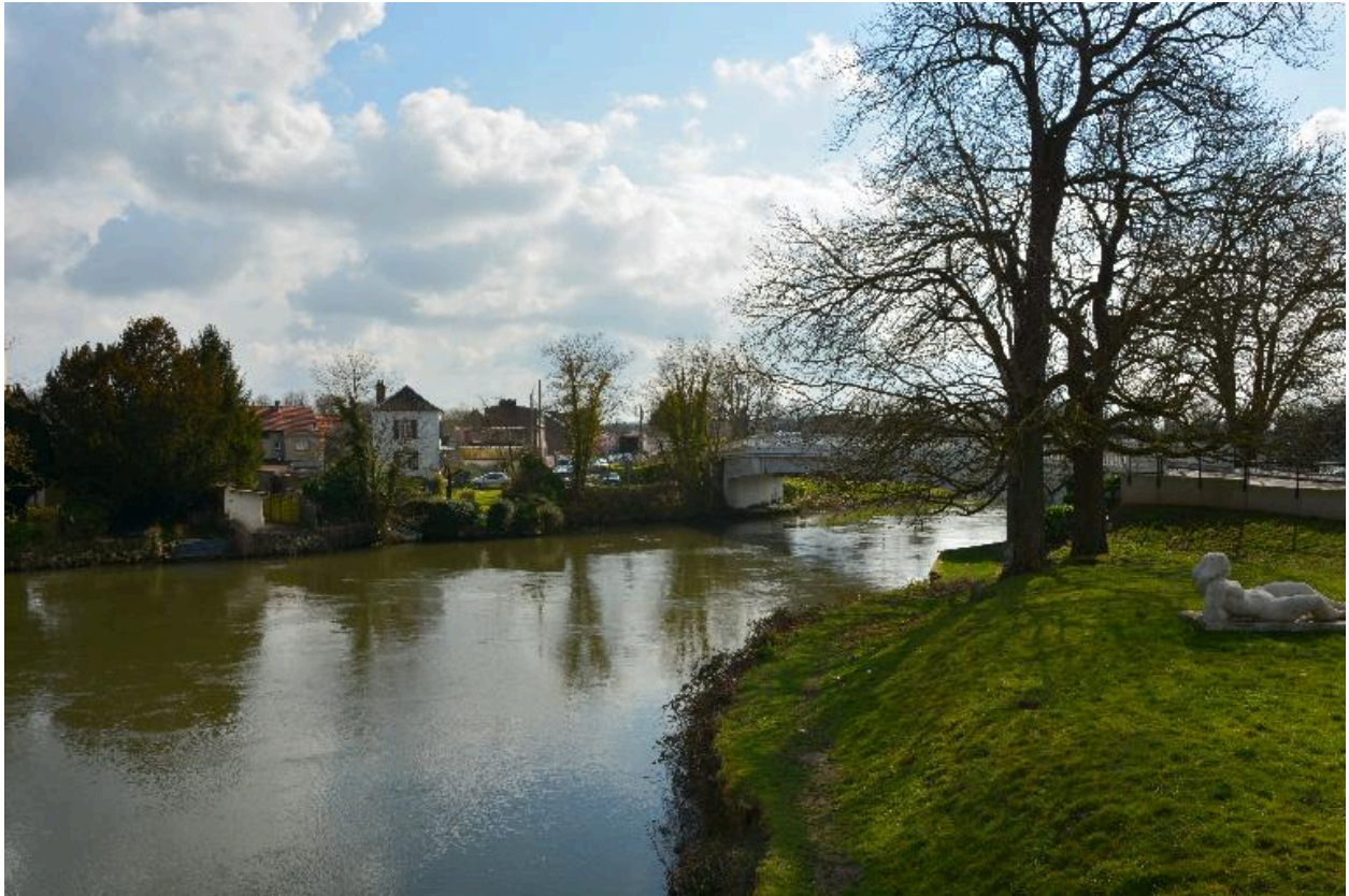
Séparation de la Somme et du canal de transit.