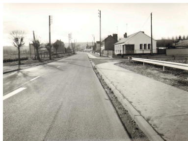
Faubourg des planches dans les années 1970.