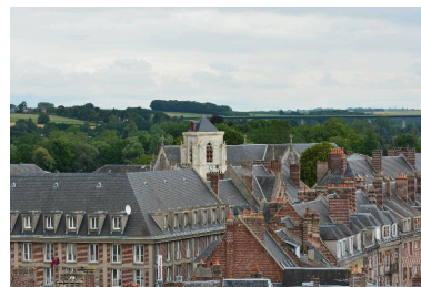
Le centre reconstruit et l'église du Saint-Sépulcre depuis l'hôtel de ville vers le nord-est.