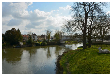
Séparation de la Somme et du canal de transit.