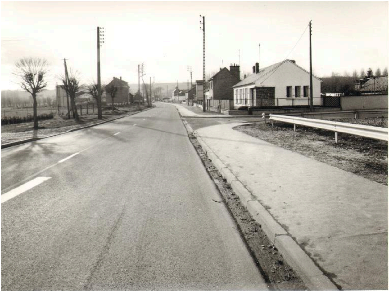
Faubourg des planches dans les années 1970 (AC Abbeville ; PHNB 1389).