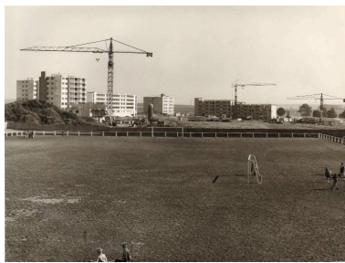
ZAC sud-est en construction depuis le centre aéré Robert Viarre en 1973.