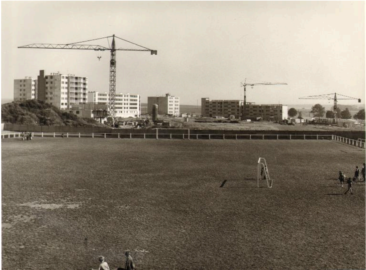
ZAC sud-est en construction depuis le centre aéré Robert Viarre en 1973 (AC Abbeville ; PHNB 1351).