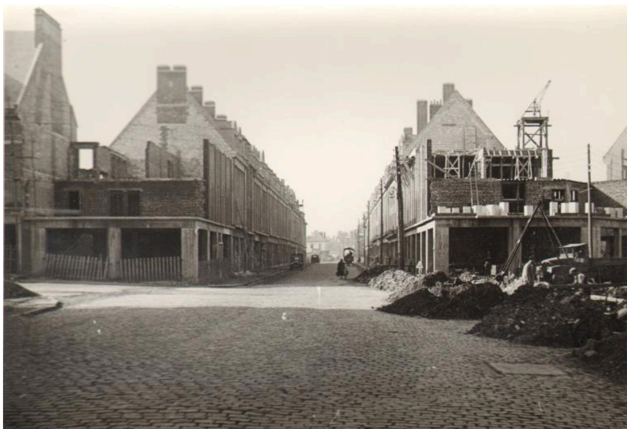
Reconstruction de la rue Saint-Vulfran depuis le parvis de la collégiale en 1951 (AC Abbeville ; PHNB 1291).