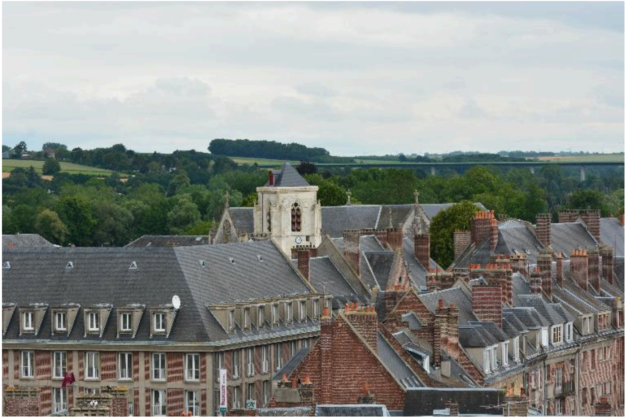
Le centre reconstruit et l'église du Saint-Sépulchre depuis l'hôtel de ville vers le nord-est.