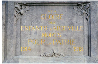
Détail de l'inscription avec décor de feuilles de chêne. IVR22_19948000395ZA