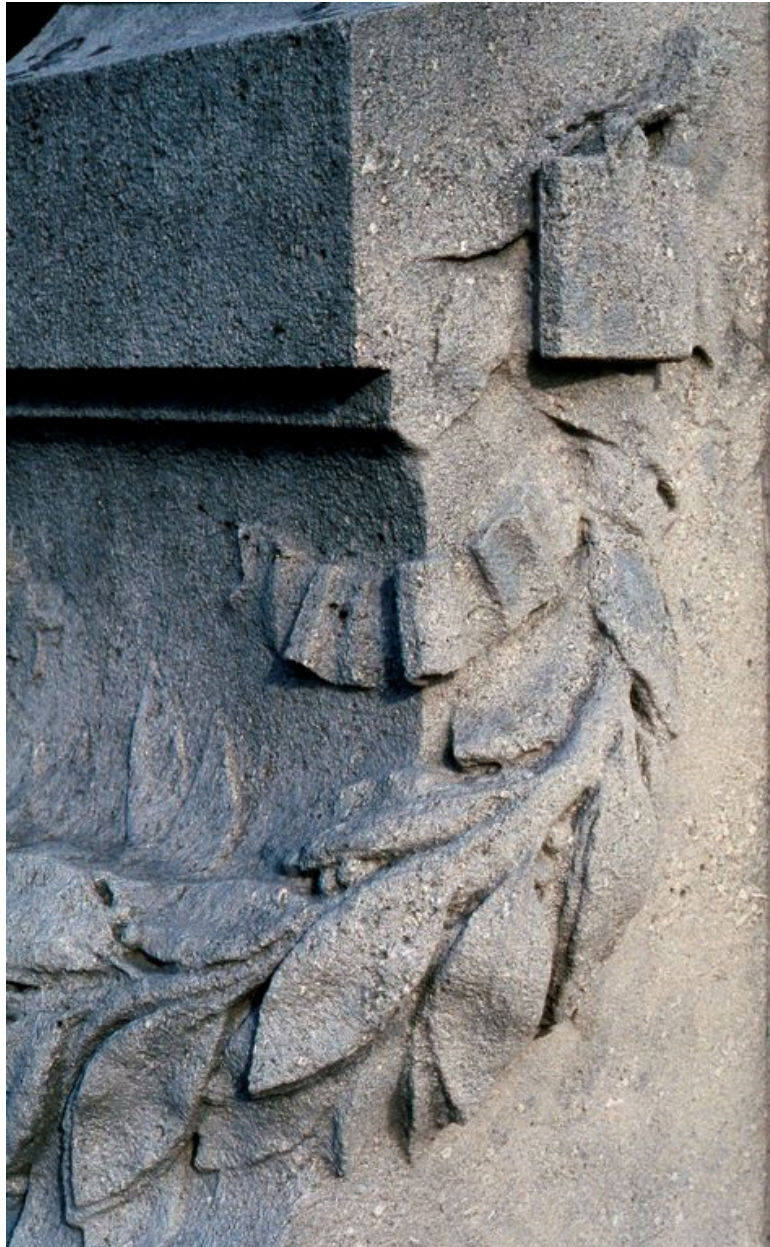
Détail du décor du socle : guirlande de laurier.