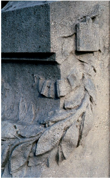
Détail du décor du socle : guirlande de laurier. IVR22_19948000396ZA