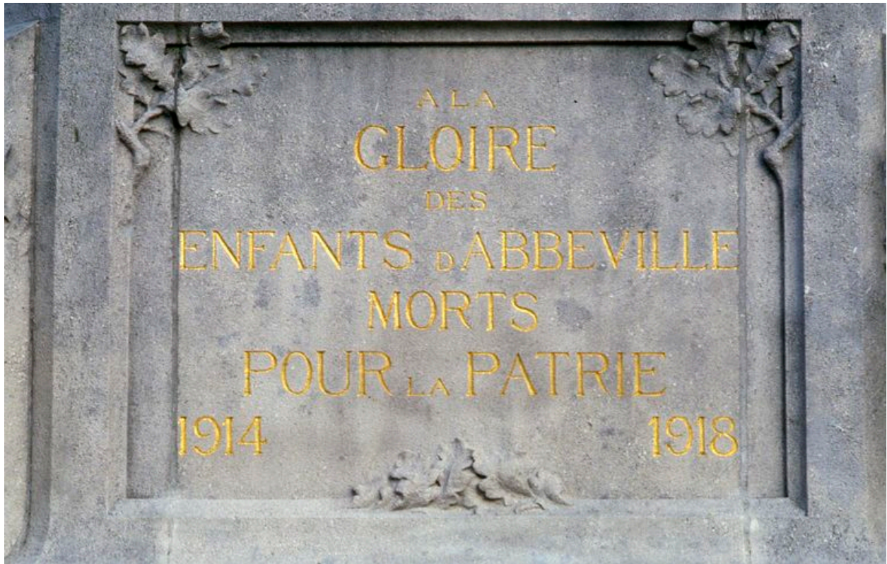
Détail de l'inscription avec décor de feuilles de chêne.