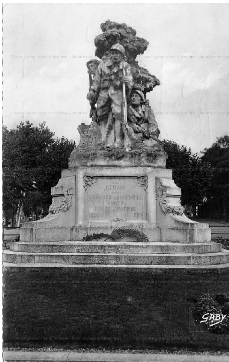
Vue du monument, avant 1939 (AD Somme ; 8Fi 5888).