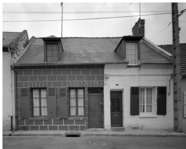
Elévation antérieure. IVR22_19856001423V