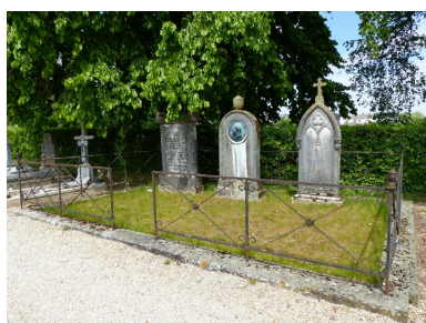
Vue générale. IVR32_20228005020NUCA