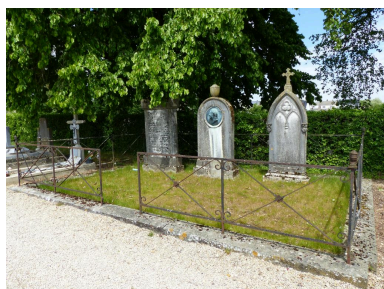
Vue générale. IVR32_20228005020NUCA