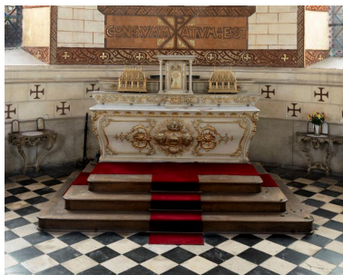
Vue générale du maître-autel.