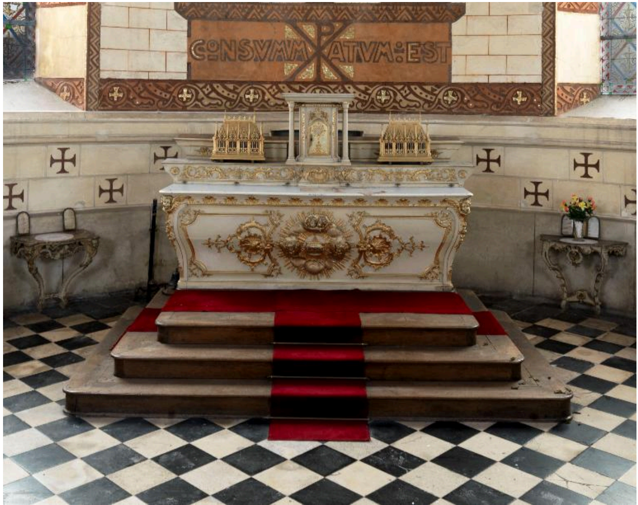
Vue générale du maître-autel.