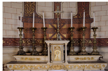
Vue du gradin et du tabernacle accompagnés de la croix et des chandeliers d'autel.