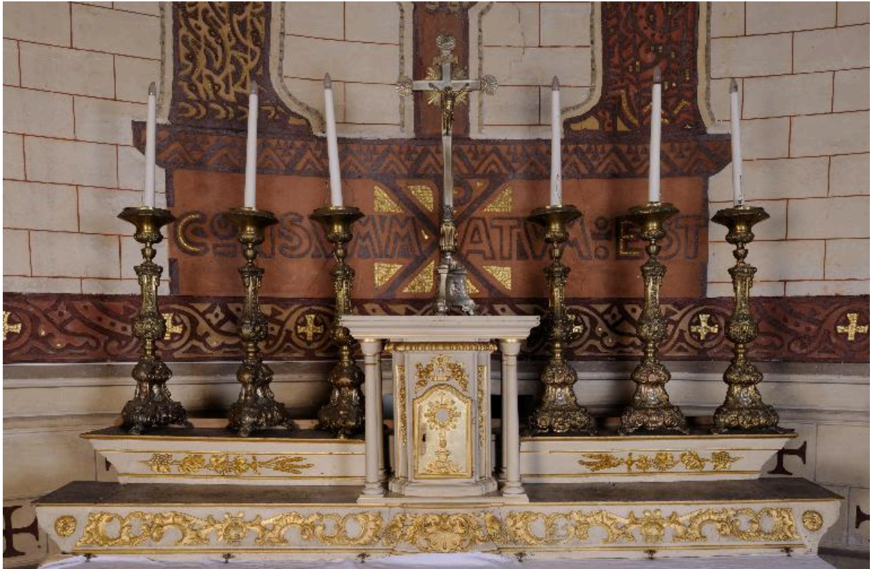
Vue du gradin et du tabernacle accompagnés de la croix et des chandeliers d'autel.