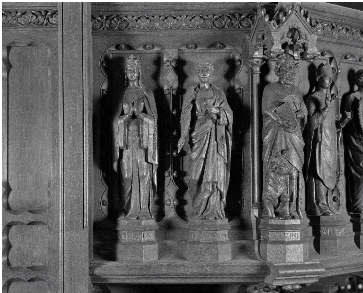
Détail de la cuve : vue des statues de sainte Clotilde, de saint Crépin et de l'évangéliste saint Luc.