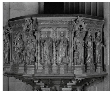
Détail de la cuve : vue des statues de saint Protais et saint Sinice, entre les évangélistes saint Matthieu et saint Marc.