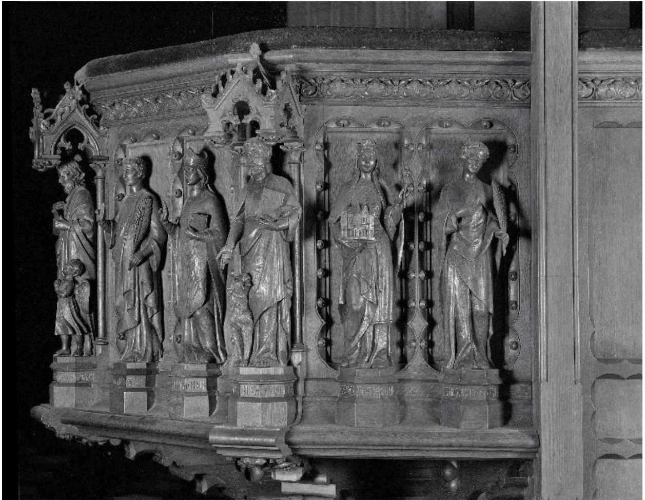
Détail de la cuve : vue des statues de l'évangéliste saint Marc, de sainte Radegonde et de saint Crépinien.