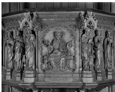
Détail de la cuve : vue de la représentation du Christ, entre les statues des évangélistes saint Jean et saint Matthieu.