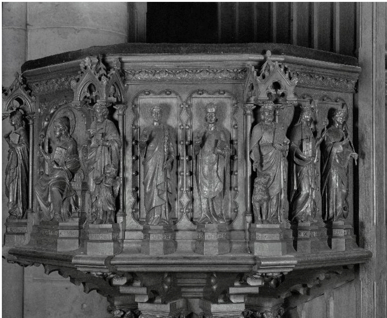
Détail de la cuve : vue des statues de saint Protais et saint Sinice, entre les évangélistes saint Matthieu et saint Marc.