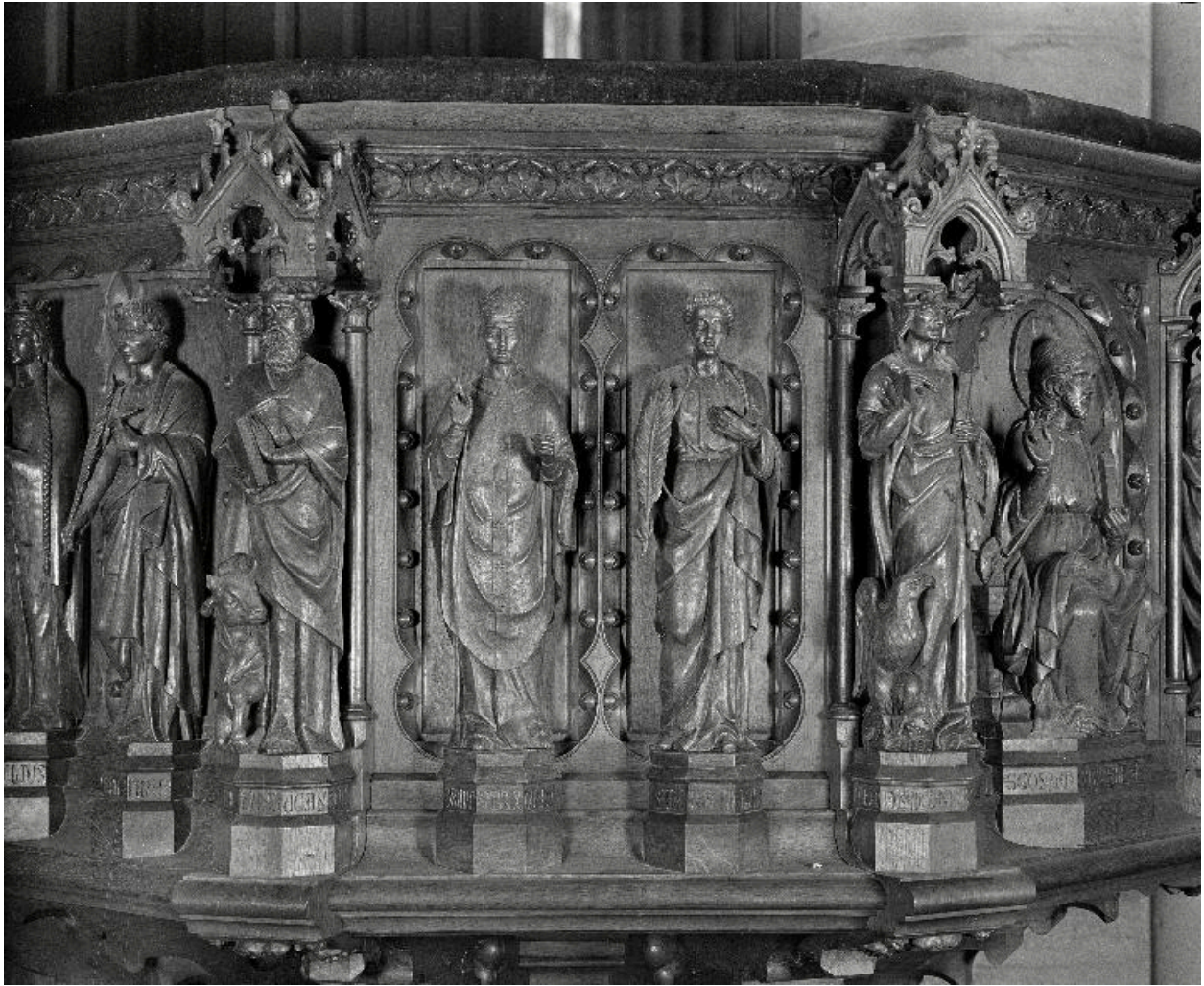
Détail de la cuve : vue des statues de saint Sixte et saint Gervais, entre les évangélistes saint Luc et saint Jean.