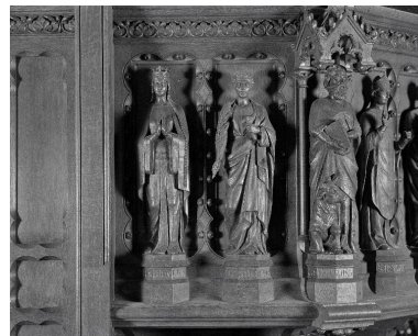
Détail de la cuve : vue des statues de sainte Clotilde, de saint Crépin et de l'évangéliste saint Luc. IVR22_20020200170X