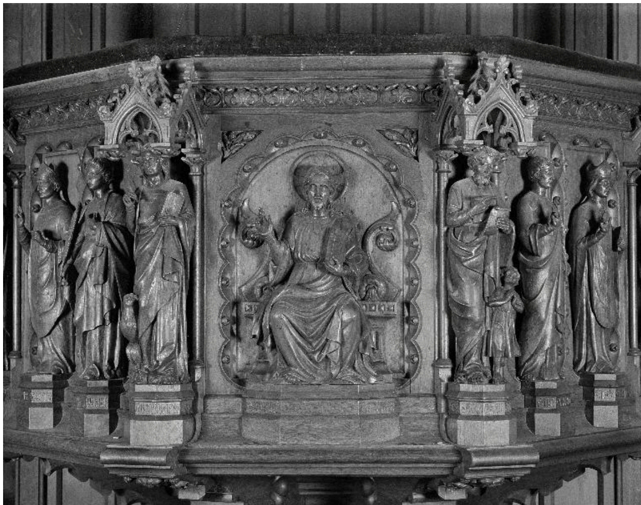
Détail de la cuve : vue de la représentation du Christ, entre les statues des évangélistes saint Jean et saint Matthieu.