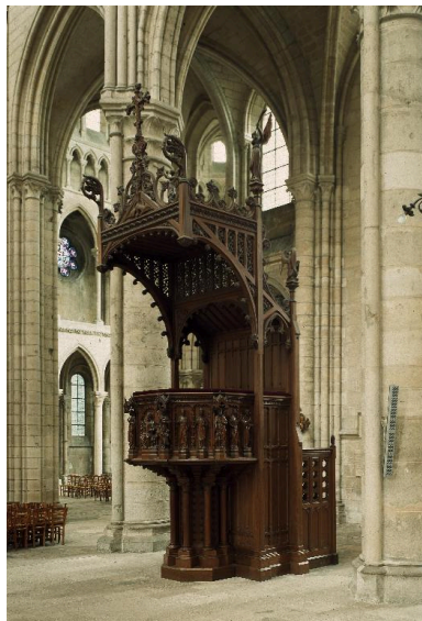
Vue générale. IVR22_19970200446XA