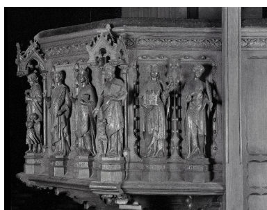
Détail de la cuve : vue des statues de l'évangéliste saint Marc, de sainte Radegonde et de saint Crépinien.