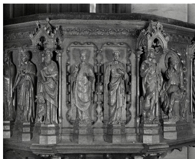
Détail de la cuve : vue des statues de saint Sixte et saint Gervais, entre les évangélistes saint Luc et saint Jean. IVR22_20020200171X