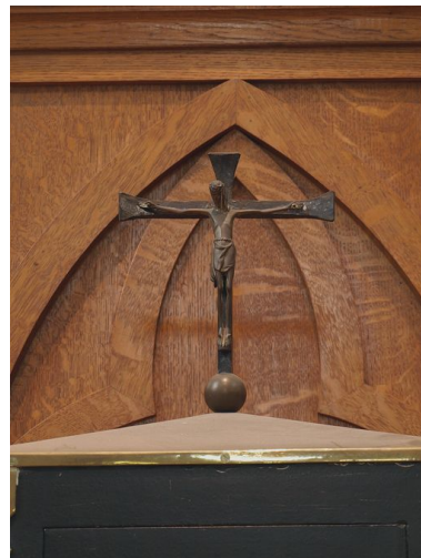
Croix sommitale