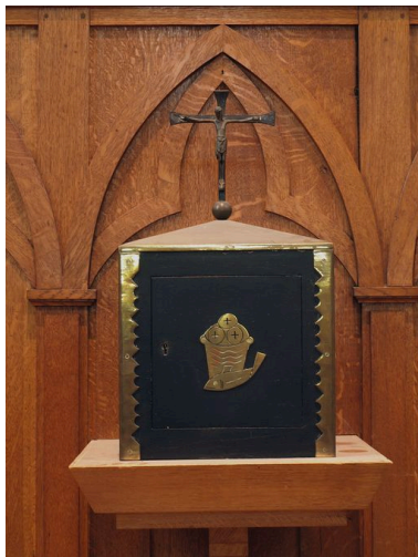
Vue générale IVR31_20126201514NUCA